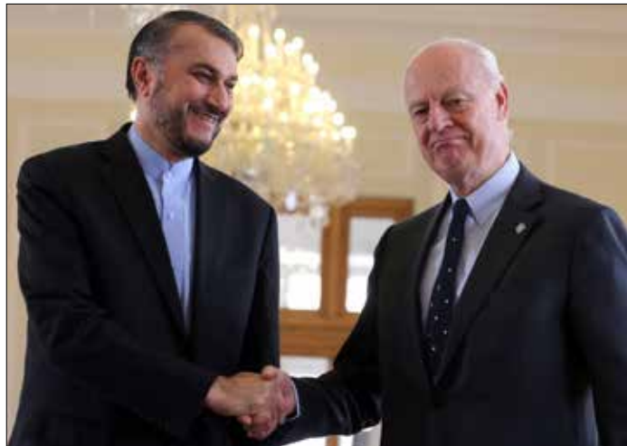
اعرب عبداللهيان عن ارتياحه «لاقتراب الحل السياسي»

الشعبي... وضرورة إصدار قانون حول علمانية الدولة في سوريا. كذلك، قال النائب الروسي سيرغي غافريلوف، إن الأسد أعرب عن تقديره لخطبه الروسي فلاديمير بوتين على المساعدة التي قدمتها روسيا في محاربة الإرهاب، وعلى دعمها الإنساني والاقتصادي للدولة السورية.