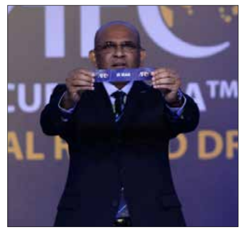
سحبت قرعة الدور الثالث الحاسم أمس في كوالالمبور

رسمت قرعة الدور الثالث الحاسم من التصفيات المؤهلة إلى مونديال روسيا 2018 لكرة القدم التي سحبت أمس في كوالالمبور، حيث مقر الاتحاد الآسيوي للعبة، طريفاً شائكة للمنتخبات العربية نحو النهائيات. وضمت المجموعة الأولى: إيران، كوريا الجنوبية، أوزبكستان، الصين، قطر وسوريا، والثانية: أستراليا، اليابان، السعودية، الإمارات، العراق وتايلاند. ويحق لقارة آسيا في المونديال بأربعة مقاعد ونصف مقعد. وتتنافس المنتخبات بنظام الدوري من مرحلتين: ذهاباً وإياباً، على أن يتاهل الأول والثاني من كل