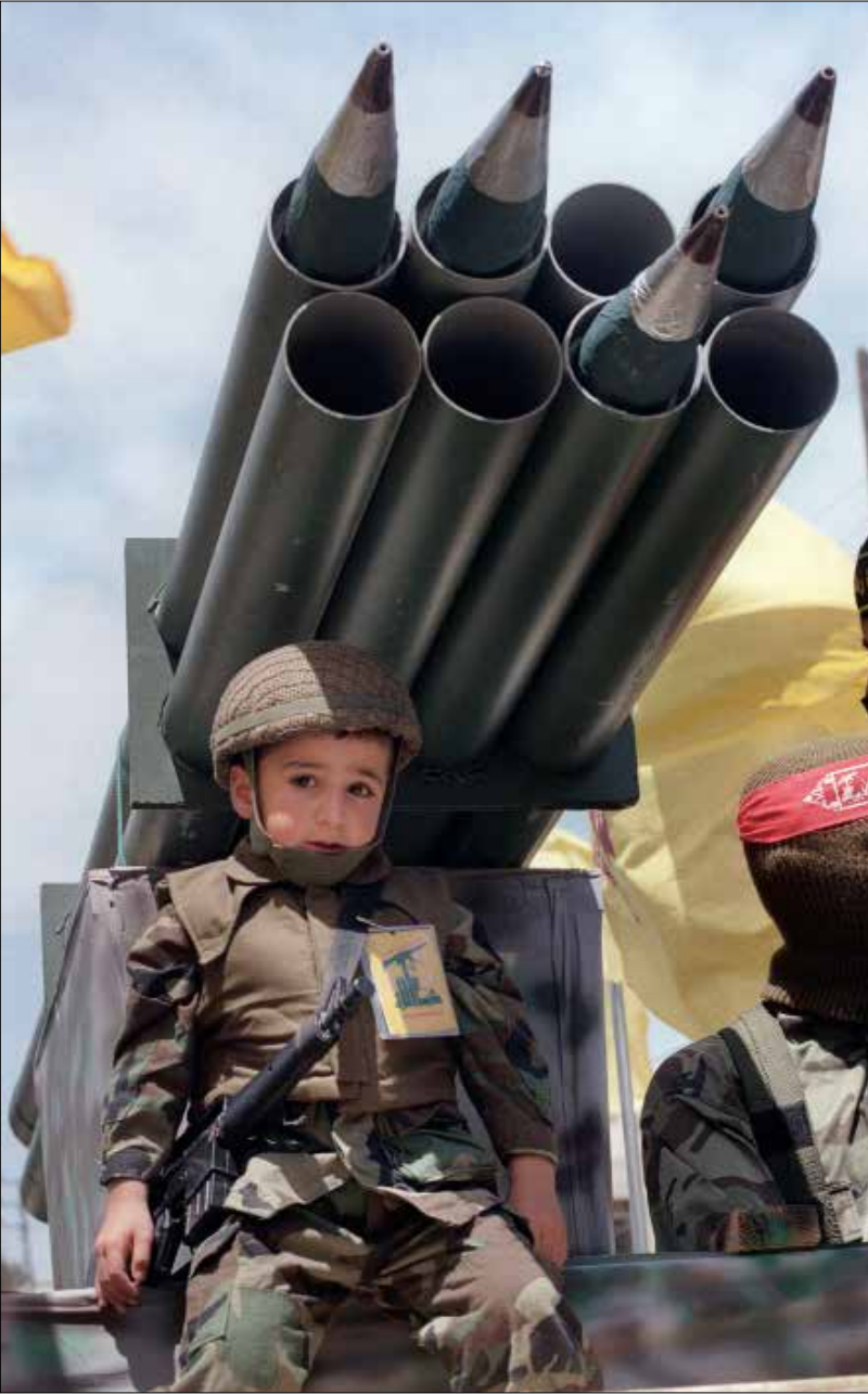
الاستراتيجية الصاروخية حولت المستوطنات إلى قيد على حركة جيش الاحتلال

طائلة تلقي ضربات مؤلمة. واعتمد العدو لتحقيق هذه الغاية استراتيجية استهداف البيئة الحاضنة للمقاومة وتهجير سكانها لتكوين حالة شعبية ضاغطة على المقاومة.