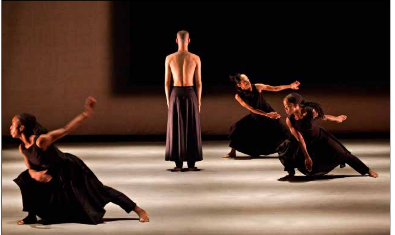
«كاش» لكارم خان

حالتني التناقض والضعف اللذين تعيشهما تونس على درب التغيير. حركة الراقصين السريعة على المسرح ليست سوى الرغبة في البقاء على قيد الحياة وربما في الثورة لتحرير الثورة مجدداً، أمام عيون الشهداء الذين يقفون كرسوم بأحجام بشرية. أكثر العروض المنتظرة هو «كاش» (22 و 4/23) لأهم مصممي الرقص البريطانيين أكرم خان. بعدما زارنا عام 2011، يعود الفنان البنغالي الأصل بعرض فرقة الأول «كاش» الذي قدمه قبل 14 عاماً، واستعادته قبل شهر في لندن. بين فنون وتقاليده «الكاتاك» ولغة الرقص المعاصرة براوح العرض على موسيقى نيتين ساوهاني. يدفع الراقصون الخمسة بالعرض إلى حدود الاستعارة والميتافيزيقيا بالاستناد إلى الفيزياء واللاهوت الهندي. أمام مرئع أسود على الجدار (أنيش كابور)، نشاهد حركات الدمار والأنبعاث من جديد، يبدل الراقصون وقفاتهم، ثم يصطفون من جديد في ملايين الاحتمالات.