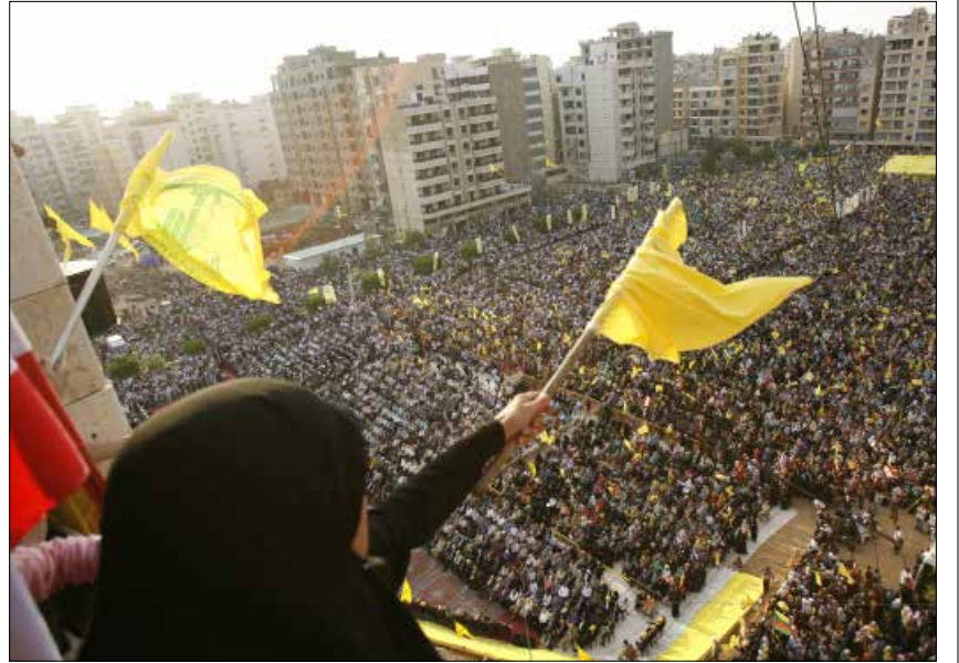
إحتفال لحزب الله في ملعب الراية (بلاك جاويز)

في ملعب الراية لا تطحن الكسارة الحجارة فقط، بل الأيام والذكريات أيضاً. هنا، حقبه طويت قبل أيام، تاركة خلفها المأ صلفاً كالإسمنت الذي سيكبر فوق الملعب. هذا ما يعتر عنه جيران «الراية» ورؤاده الذين اختزنوا فيه ذكريات