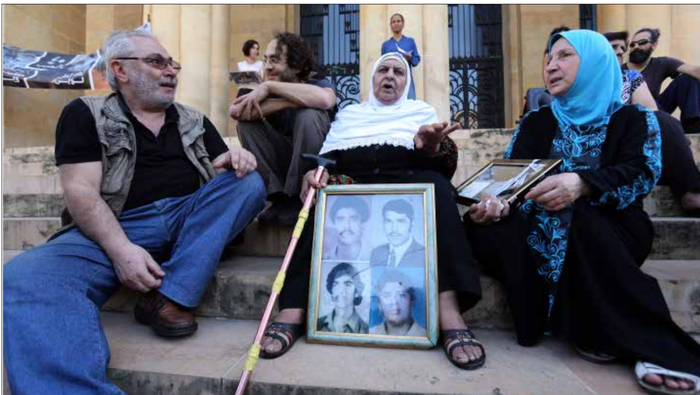
«هاجسنا ليس ان لا نعلم موت، بل كيفية حلها قبل ان نمت»، (مروان طحطح)