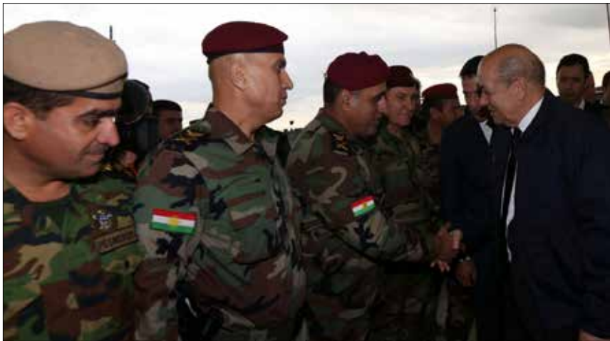
زار وزير الدفاع الفرنسي امس إقليم كردستان حيث التقى عدة مسؤولين