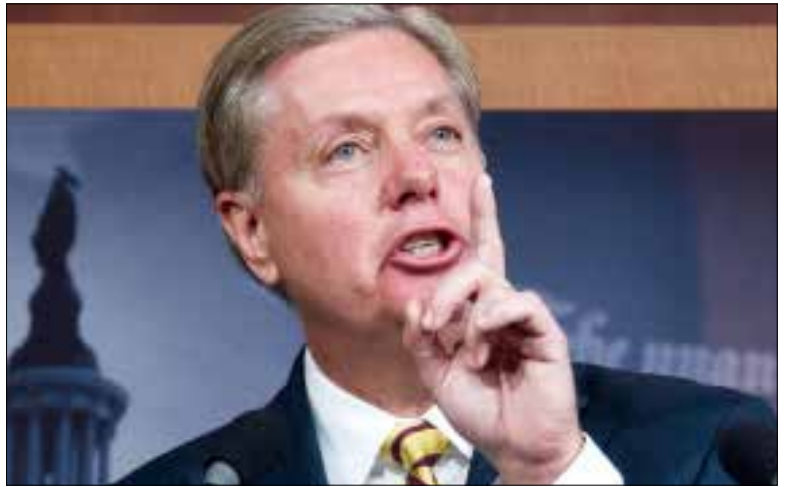
عرب هذه الخطة هو السيناتور الجمهوري ليندسي غراهام (من اليمين)

مصر، مشيرة إلى أن الدول المشمولة بهذا الاقتراح، هي مصر ولبنان والأردن، ذلك أنها «الأكثر حاجة إلى مساعدة سريعة من أجل تحمّل عبء النازحين السوريين، ومواجهة توسع داعش في ليبيا وشبه جزيرة سيناء»، لكن اللافت أن غراهام ضمّ إسرائيل إلى اللائحة، معتبراً أنها «من الممكن أن تكون المتلقي للمريحة الأولى من أموال المساعدات».