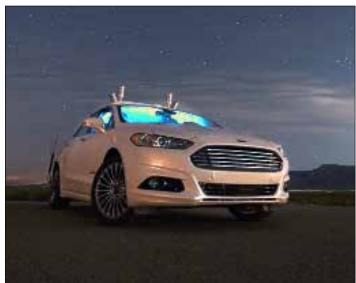
تقنية الاستشعار LiDAR «ليدار» تمكن ضمن برنامج السائق الافتراضي للسيارة

ويمثل الاختبار، الذي جرى وسط ظلام دامس في منطقة اختبارات فورد في ولاية أريزونا الأميركية، المرحلة التالية من مسيرة الشركة لإنتاج سيارات ذاتية القيادة بالكامل لعملائها في جميع أنحاء العالم، وهو