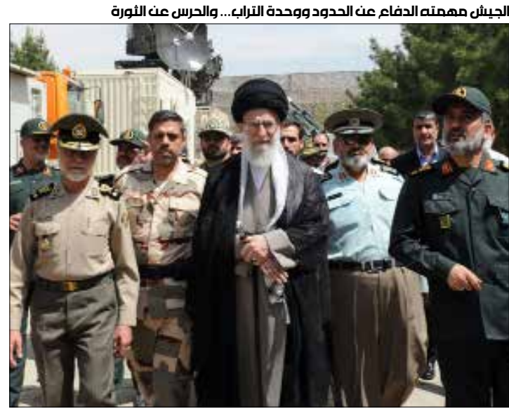
الجيش مهمته الدفاع عن الحدود ووحدته التراب... والحرس عن الثورة

المرشد هو القائد الأعلى للقوات المسلحة وأمر العمليات محصور به