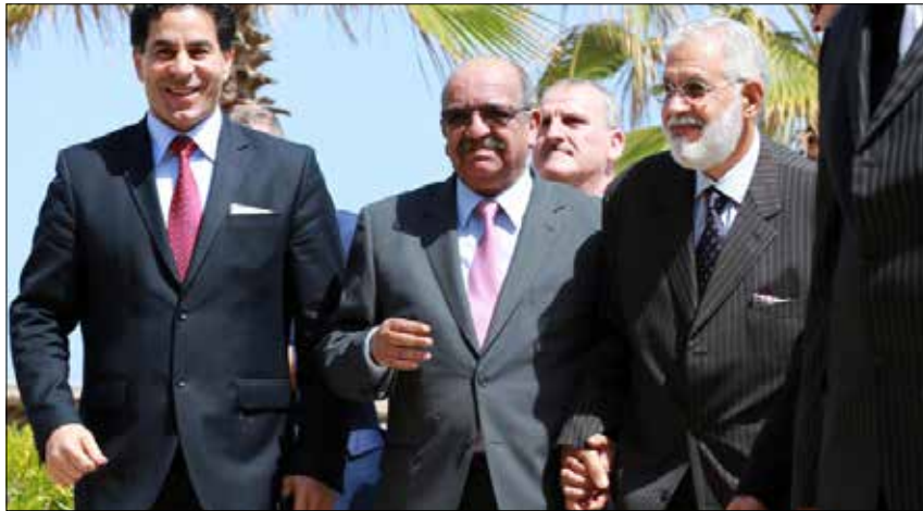
يعتبر الوزير الجزائري، أول مسؤولة عربي يزور السراج في طرابلس

على صعيد متصل، إن المعادلة السياسية التي تحكم الليبيين راهناً، باتت تعزز فرص تنظيم «داعش» المسيطر على عدة مناطق، أهمها مدينة سرت، لتوسيع نفوذه. ويقوم التنظيم فعلياً بمحاولات «جس النبض» ضمن الأراضي المحيطة بسرت، وخاصة بني وليد (منطقة السدادة)، ومنطقة الجفرة، وبالتحديد المدن الواقعة قرب مدينة ودان وكذلك الحقول النفطية الممتدة جنوب الساحل الشرقي في الصغراء.