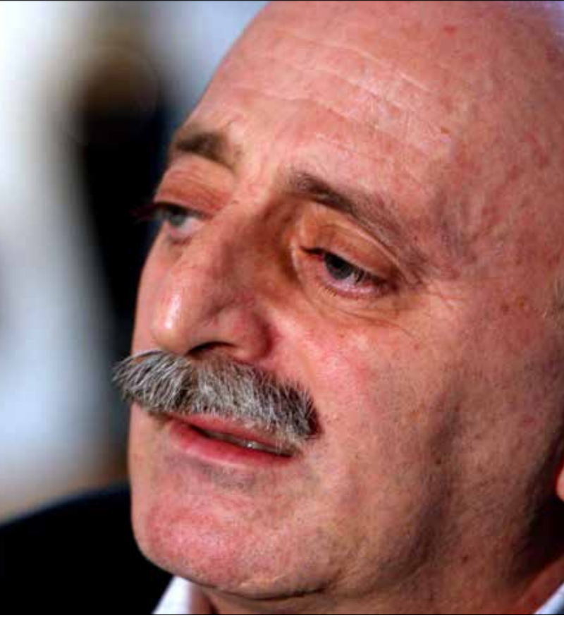
لا الحرس القديم ابتعد ولا الحرس الجديد استطاع ان يمسك بمقاليد الإدارة الحزبية

تُظهر الانتخابات البلدية الثغرات التنظيمية داخل الحزب التقدمي الاشتراكي. من راشيا وحاصبيا إلى المتن الأعلى والشوف وعاليه، يتخاضم الاشتراكيون بين حرس قديم وحرس جديد على بلديات القرى والمدن. وسط توجهات من النائب وليد جنبلاط بالابتعاد عن الانغماس المباشر في المعارك البلدية.