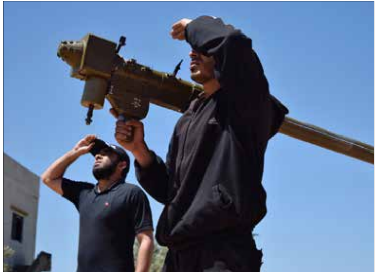
مقاتله يحمل صاروخ FN-6 المضاد للطائرات في تيرمعة في ريف حمص امس (اف ب)

ويبدو مُستبعداً حصول مسلحي هذه الجبهة على أنظمة مضادة للطيران، أقله في المرحلة الحالية (مع احتمال حيازتهم عدداً من الصواريخ الصينية المحدودة التأثير). وتؤكد معلومات متقاطعة واردة من المنطقة أن طيران الاستطلاع «لا يكاد يفارق الأجواء»، من دون أن يؤثر ذلك على حركة الاستعدادات النشطة. الالفت أن الاستعدادات توجي بعزم المسلحين على بدء معركة هجومية على نطاق واسع قبل أن يشن الجيش