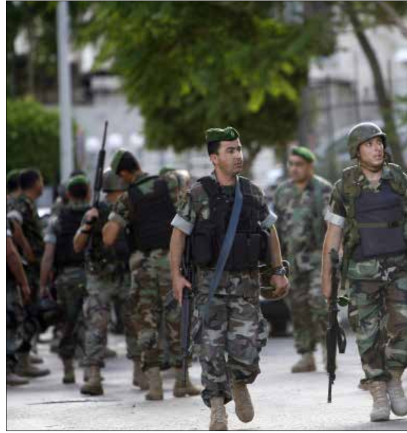
الجيش مستعد لتأمين حماية الانتخابات البلدية

عن التوصية، يمكنهم الاتفاق على قانون ليقرّوه لاحقاً بعد انتخاب الرئيس». وقانون الانتخابات يمثل جزءاً أساسياً من السلة المتكاملة التي يطالب التيار الوطني الحر بها. ورغم إهمال بري الأطراف السياسية أسبوعاً لدرس الاقتراح والعودة إليه بأجوبة، وصلته الردود من على باب عين التينة فور انتهاء الجلسة على لسان الوزراء والنواب. وتبين أن كل طرف لا يزال عند موقفه، باستثناء الموافقة المبدئية المستجدة للحزب التقدمي الاشتراكي الذي انضم إلى تيار المردة وحزب الله والطاشناق والمستقبل الذي رأى في طرح بري «مخرجاً لائقاً للتوصل من الوعد الذي قطعه الرئيس سعد الحريري لحلفائه المسيحيين عدم حضور أي جلسة لا يطرح فيها قانون الانتخابات». وقد أبدى الوزير جبران باسيل امتعاضه أمس من طرح رئيس المجلس، مجدداً التمسك بضرورة إدراج قانون الانتخاب على رأس جدول الأعمال للمشاركة في الجلسة. ونقلت قناة «أو تي في» عن «مصدر متابع» قوله إن مبادرة بري تأتي في إطار الالتفاف الدائم على إقرار قانون انتخابات جديد، وهو ما ينبغي بتوتر جديد في علاقة الرابطة وعين التينة. وتناقش المجتمعون أمس في تقرير لجنة الانتخابات الذي قدّمه النائب جورج عدوان، والذي لم يتضمن كما بات معلوماً سوى عرض مواقف القوى السياسية التي تختلف بشأن اعتماد النظام النسبي أو الأجنبي وتوزيع الدوائر. فرأى باسيل أن قانون عدوان والمستقبل والاشتراكي لا يعتمد معياراً واحداً لتوزيع الدوائر، ووافق رئيس كتلة حزب الله محمد رعد والنائب طلال أرسلان بصّب القانون لمصلحة فريق