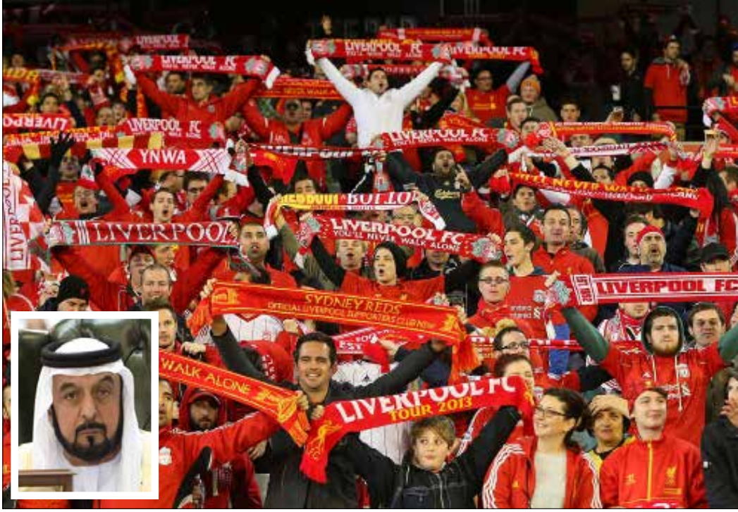
بإمكان جمهور ليفربول أن يحلم باللقاب مجدداً إذا كان الشيخ خليفة عملاً «الشاري السري» للنادي (الشاريف)

نعم، نستطيع الجزم بهذا الأمر، إذ إن كل شار عربي وطأت قدماه ملعباً أوروبياً أراد جعل ناديه ملكياً، فكيف الحال إذا صح ما أشارت إليه صحف إنكليزية عدة بقولها إن رئيس دولة الإمارات الشيخ خليفة بن زايد آل نهيان هو «الشاري السري» الذي لم يرد