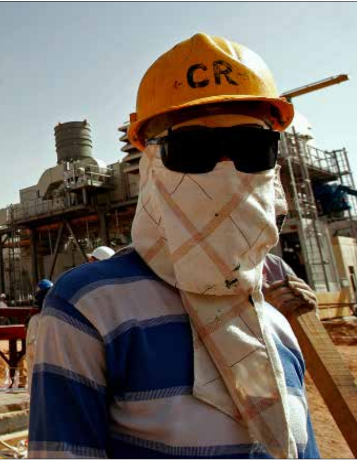
باعت «أرامكو» نفطها الخام للمصافي الأميركية بحسومات بلغت 8,5 مليارات دولار

عام 1981 برز دور «أرامكو» حين ضغطت شركات النفط الأميركية على صانعي القرار في الكونغرس. كان الرئيس الأميركي، رونالد ريغن، قد طرح حينها بيع السعودية نظام الإنذار والتحكم المحمول جواً،