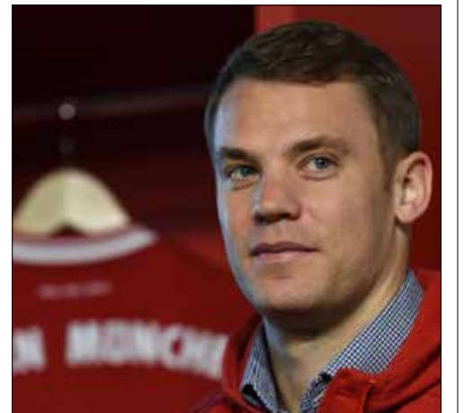
نوير خلك التوقيع على العقد الجديد