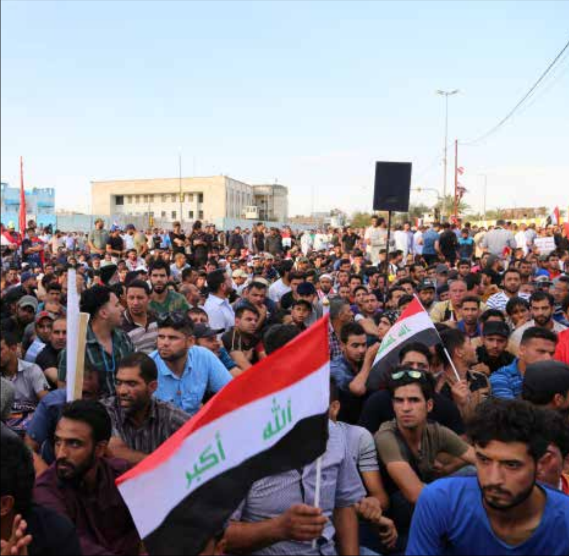
لم يبادر العبادي إلى عملية إصلاح حقيقية في ظل موجة التظاهرات الأولى (الانضام)

جرى التفاهم على حل وسط، بتأليف لجنة تشاور الأحزاب التي تقدم لائحة مرشحين من قبلها لتقلد مناصب وزارية، على أن يكونوا أقرب إلى التكنوقراط. قدمت اللوائح وجرى تعيين جلسة يوم الثلاثاء 12 نيسان عند العاشرة صباحاً. تأخر العبادي فأرجئت إلى الثانية من بعد الظهر، لكن رئيس الحكومة عوض أن يمثل في القاعة العامة، توجه لى وصوله إلى مكتب رئيس المجلس سليم الجبوري، الذي عقد معه اجتماعاً مطولاً، تسلم في خلاله التشكيلة الجديدة من العبادي الذي غادر من دون المشاركة