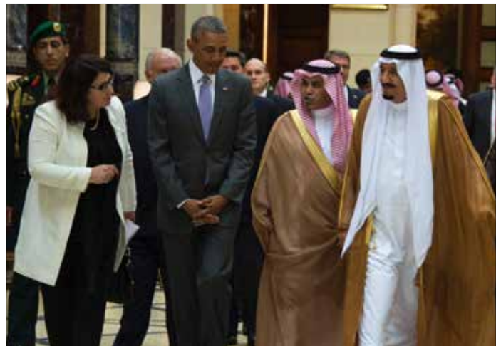
يشارك أوباما اليوم في قمة مجلس التعاون ثم يتوجه إلى بريطانيا ثم ألمانيا

خيم الاستياء الخليجي، بوضوح، على زيارة الرئيس الأميركي، باراك أوباما، بالرياض، أمس، وظهر ذلك من خلال طريقة استقباله في المطار من قبل القادة السعوديين. إلا أن الاستياء لم يمنع زعمي البلدين من تجديد تأكيد الصداقة التاريخية والشراكة الاستراتيجية العميقة، بين الولايات المتحدة والسعودية، وفق بيان صادر عن البيت الأبيض. وكانت البرودة في العلاقات ظاهرة في عدّة محطات من الزيارة، خصوصاً لدى نزول أوباما من الطائرة، حيث كان في استقباله أمير منطقة الرياض فيصل بن بندر بن عبد العزيز، ووزير الخارجية