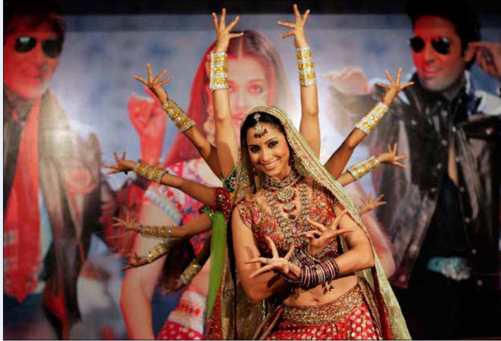
الافتتاح سيكون بالالوان الفاقعة والحنين المزركش الى بوليوود

لنبدأ إذاً من «مهرجانات بيت الدين الدولية» (8 تموز/ يوليو - 9 آب/ أغسطس). يغلب هذه السنة على البرنامج طابع الاستعراض، مع الافتتاح «البوليوودي»، والأمسيات المشتركة التي تجمع الطاقات والأسماء والمواهب: تارة لتوجيه تحية جماعية إلى سوريا الحضارة العريقة والشعب الجريح، وتارة أخرى لاستعادة الموسيقى والمعلم زكي ناصيف. المفاجأة الثانية هي الكثافة العربية على حساب الروك والجاز الغائبين، والكلاسيك (فقط) موسيقى بروكوفيفيف ضمن باليه