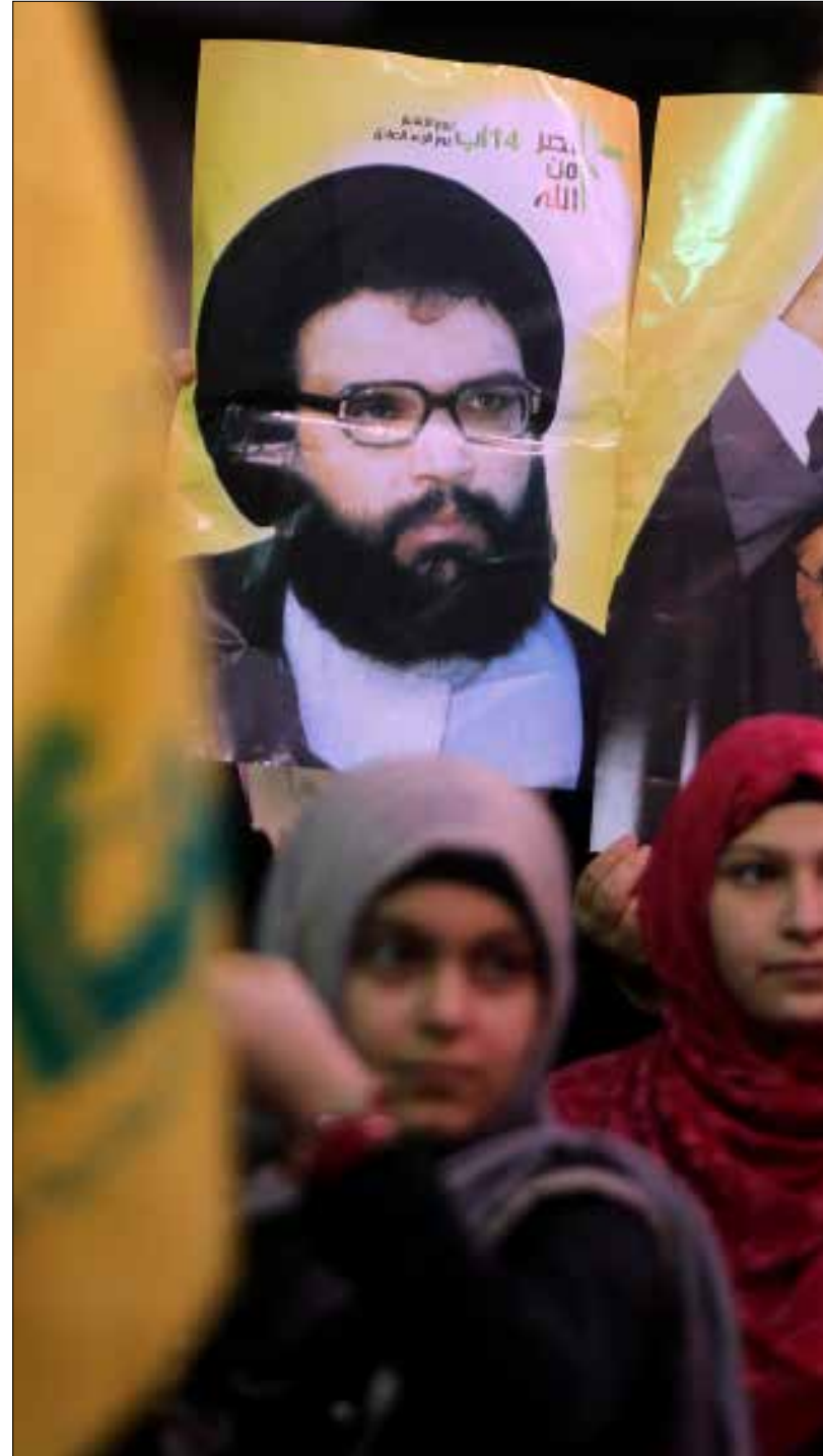
ما صدر حتى الآن ليس سوى خطوة أولى على طريق تنفيذ القانون (هيثم الموسوي)

أسئلة عن كيفية تعامل الحزب مع التدابير الجديدة على المستوى العام وعلى المستوى الضيق. فإذا كان بديهياً ألا تكون للأمين العام لحزب الله السيد حسن نصرالله حسابات باسمه في أي مصرف لبناني، وتالياً لن يتأثر بشخصه