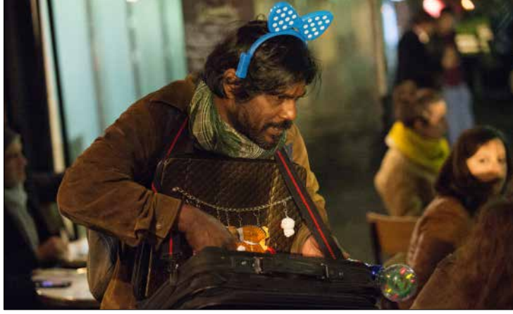
من فيلم «ديبان»