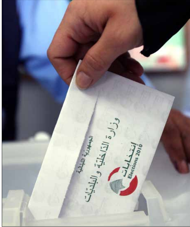
لا تكرار للتركية 2010 (هيلم الموسوي)

وعلى عكس الانتخابات البلدية السابقة، حيث كان جنابلاً ناخباً «خفياً» في الدامور، يكفي الآن أن طرفي الصراع يبديان تحفظات على إعلان تأييد جنابلاً لهما، بحيث يتحول تأييد رئيس الاشتراكي لأي من اللائحتين سبباً في خسارة الأصوات وتجيئها للائحة المقابلة».