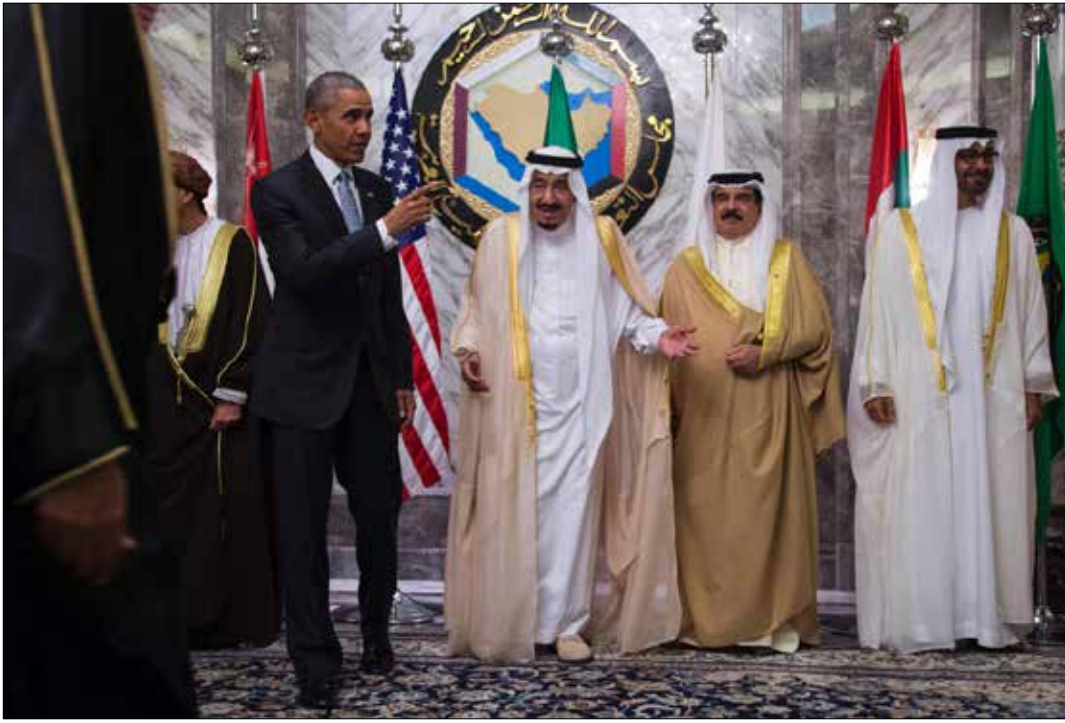
صرح أوباما بأن بلاده ودول الخليج «متحدة» في الحرب ضد «داعش»

للتحديات الخارجية والداخلية، ومعالجة الأنشطة الإيرانية المزعزعة للاستقرار، والعمل معاً للحد من التوترات الإقليمية والطائفية التي تغذي عدم الاستقرار، بما في ذلك برنامجها للصواريخ الباليستية ودعمها الجماعات الإرهابية مثل حزب الله وغيره من وكلائها المتطرفين في كل من سوريا واليمن ولبنان وغيرها».