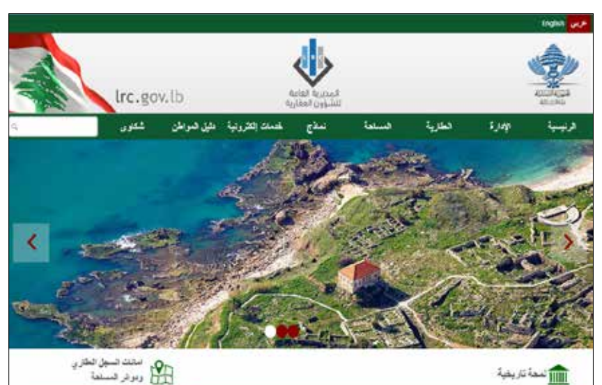
الموقع الإلكتروني يتيح الاطلاع على الصحيفة العقارية لأي عقار