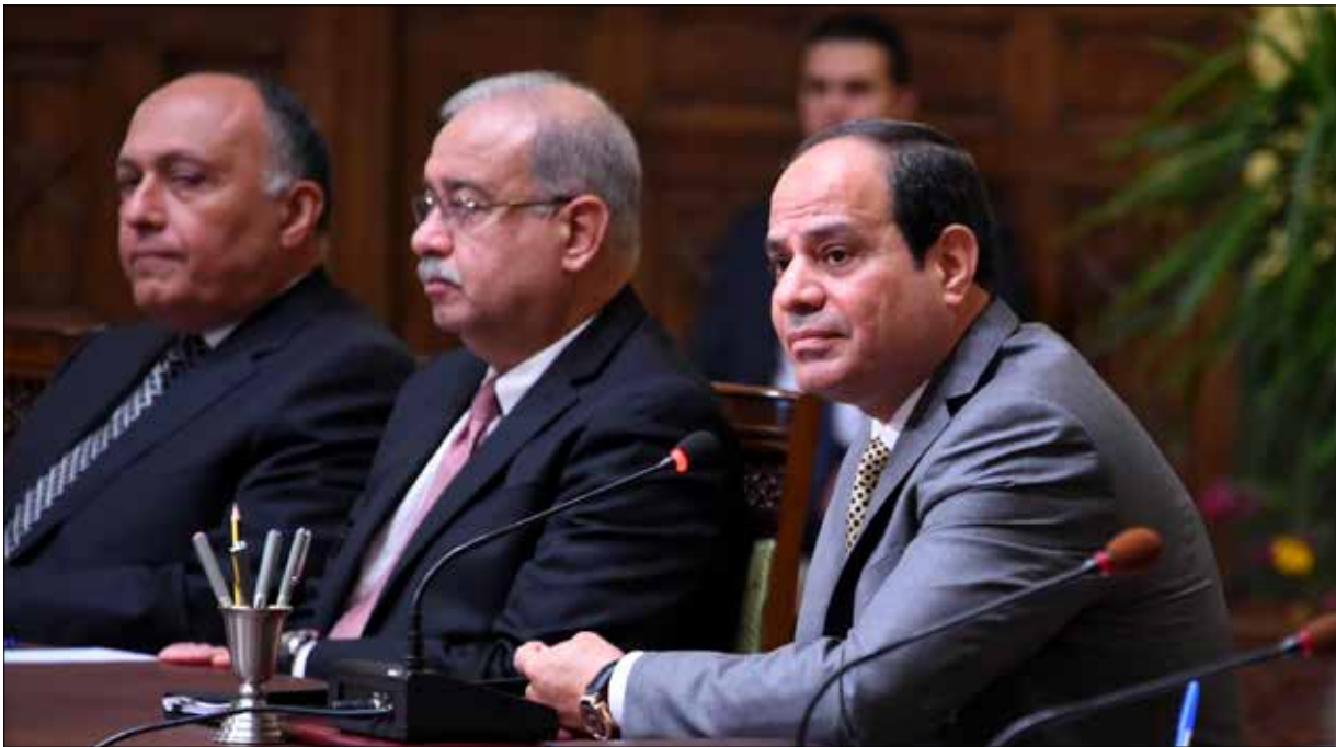
سياسات الرئيس رمت إلى مجد شخصي لم تناسبه الموارد المالية المتاحة

ويبدو أن محمود عزت يدرك ذلك جيداً، لكن تبقى عينه في المقام الأول على «التنظيم الأم» للحفاظ عليه من برائن الانشقاق والانهييار، أخذاً في الوقت نفسه بعين الاعتبار أن ملف الجماعة بات على طاولات المفاوضات الإقليمية، ولن يحسم بنتيجة صراع داخلي.