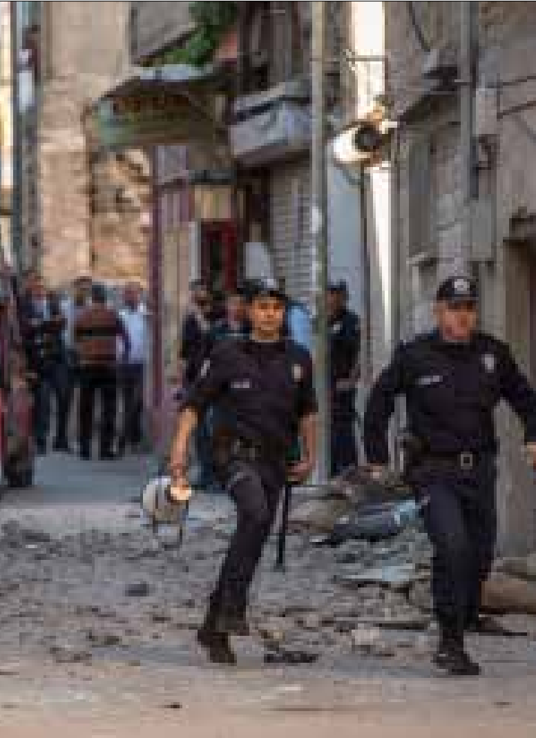
المواجهات الضاحية بين الجيش التركي والأكراد تصيد المسألة الكردية إلى واجهة الأحداث