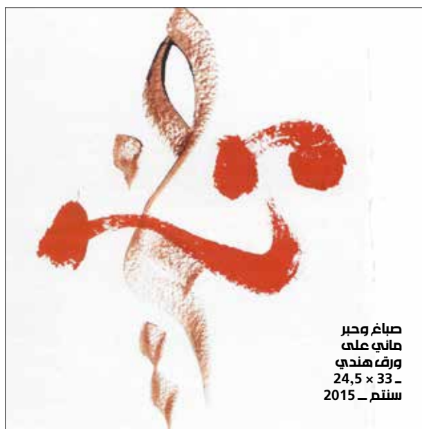
صباغ وحبر هاني على ورق هندي 24,5 x 33 - سنتم - 2015

ومعاصرة تتخلص فيها الحروفية كتيار أو تجربة في اللوحة العربية من كسلها اللغوي وزخرفتها التي كانت قائمة على معاني الكلمات وسياقاتها الشعرية والبلاغية أولاً، ومن المقترحات التجريدية والهندسية التي طالتها في مراحل تالية أيضاً. ما ترسمه أو تخطّه الفنانة اللبنانية يتجاوز هذه «الذاكرة» الحروفية إلى البحث عن حيز أو