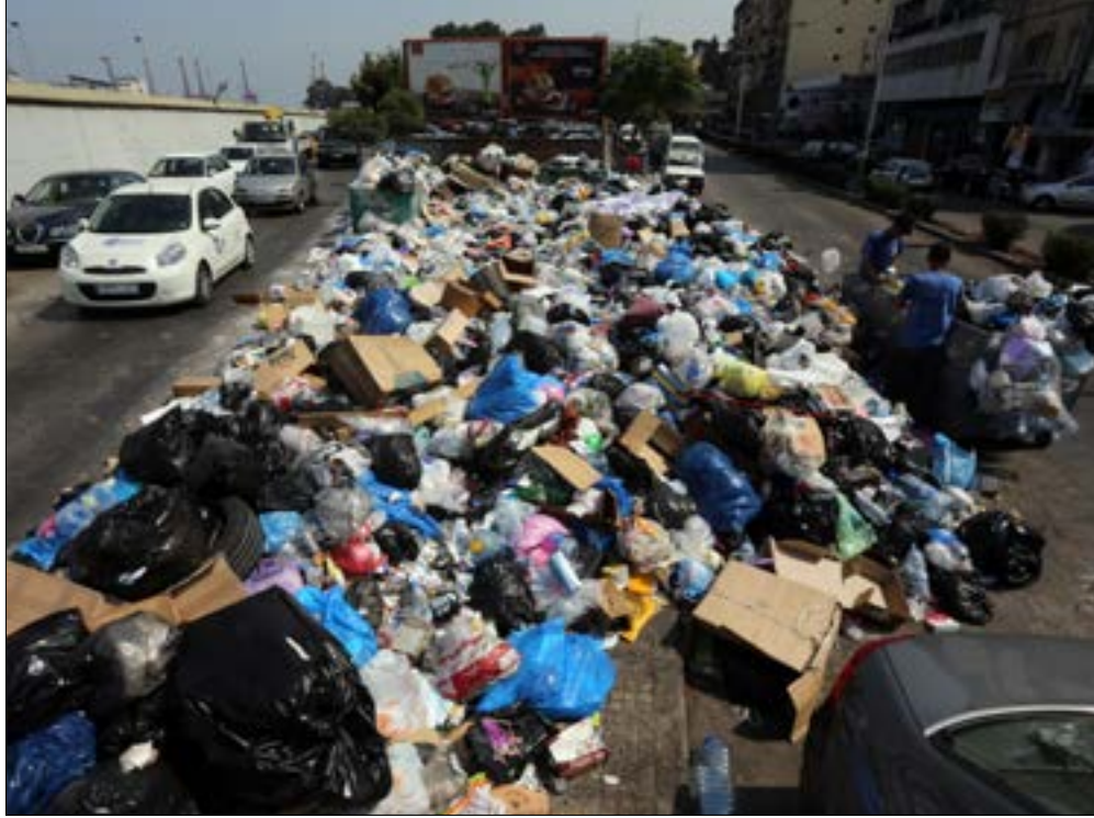
معمل عين بعل يبالغ 10 في المئة فقط من النفايات

في صور ومنطقةها النفايات ليست في الشوارع، بل في اللودية والأحراج وعلى ضفاف الينابيع وضوء المياه الجوفية. إضفاء مكبر رأس العين وتعتبر العمل في معمل عين بعل. أنتج عشرات المكبات العشوائية. اقتراحات المعالجة وصلت أخيراً إلى المحارقة، رغم إحباط وزارة البيئة لاستثمار محرقة ضهور الشوير