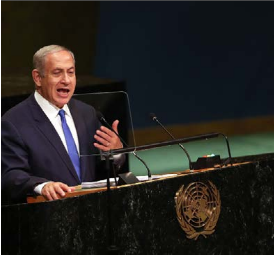
رأى نتنياهو ان «اتفاقات السلام مع مصر والاردن مرسة الاستقرار في الشرق الأوسط»

الدعم الذي تقدمه واشتد على تل أبيب في الأمم المتحدة بأنه «الحجر الأساس». كما أعرب عن تقديره للدعم الذي قدمه الرئيس باراك أوباما الذي أعلن من على هذه المنصة أن السلام لن يأتي من قرارات الأمم المتحدة»، ثم أعرب عن اعتقاده بأنه لن يكون بعيداً اليوم الذي تستطيع فيه إسرائيل الاعتماد على الكثير من الدول التي ستقف إلى جانبها في الأمم المتحدة. نتنياهو استغل الخطاب لينتقد رئيس السلطة الفلسطينية، محمود عباس، واتهمه بأنه لا يزال «غارقاً في الماضي»، ورأى أن الفلسطينيين «يرفضون الاعتراف بحقوقنا»، مهدداً بذلك لتأكيد أن «النزاع ليس حول المستوطنات، ومطلقاً لم يكن كذلك». واستدل على موقفه بالقول: «النزاع بدأ قبل عشرات السنوات من إقامة مستوطنة واحدة... وعندما أخلت إسرائيل المستوطنات من قطاع غزة لم نحصل على السلام، وإنما على آلاف الصواريخ».