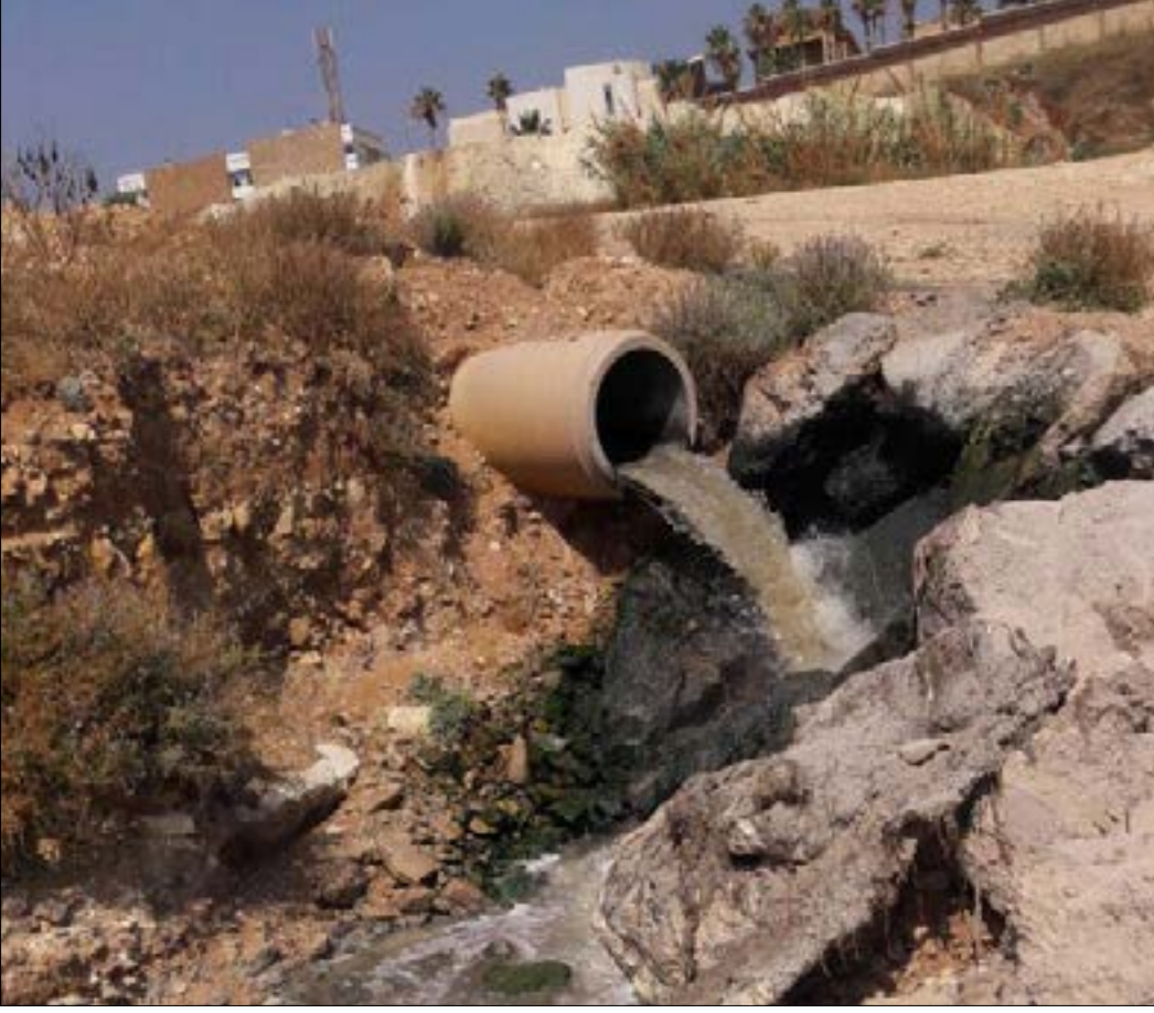
المحارير تصب على شاطئ الرملة البيضا