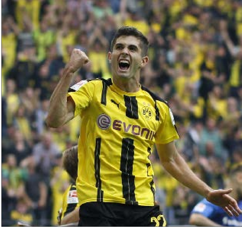
نحت الوجوه الشابة الجديدة في تعويض رحيل النجوم السابقين (الناضول)

لا يهم توخي أن تكسب الجماهير وده، ولم يظهر كرجل عاطفي مع اللاعبين، على الأقل ليس أمام الكاميرات، عكس كلوب، بل ما يهيمه فقط هو ما يظهر في كلامه وتفاعلاته، والإبقاء بهدوء على فريقه منافساً لا يرحم أحداً أمامه وهدفه الأول التتويج بالبطولات.