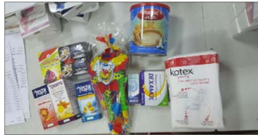
من المساعدات التي قذمتها «الجمعية»

سياسة تلقي المسلحين للعناية الطبية لا تنقطع منذ شباط عام 2013. على الأقل، كانت هي المرة الأولى التي أعلنت إسرائيل عن تدخلها في الدعم اللوجستي، طبياً، لمصلحة الجماعات المسلحة. في موازاة هذه السياسة المعلنة، تسرّب عن المسؤولين الإسرائيليين حديث تأكيد عن دعم يتجاوز الدعم الطبي، وهو ما عاد وأكد من جديد رئيس أركان الجيش الإسرائيلي غادي أيزنكوت، قبل أيام، حول العلاقة الخاصة المتبادلة، التي تربط الجيش الإسرائيلي بالجماعات المسلحة، في تأمين الحدود وإشغالها