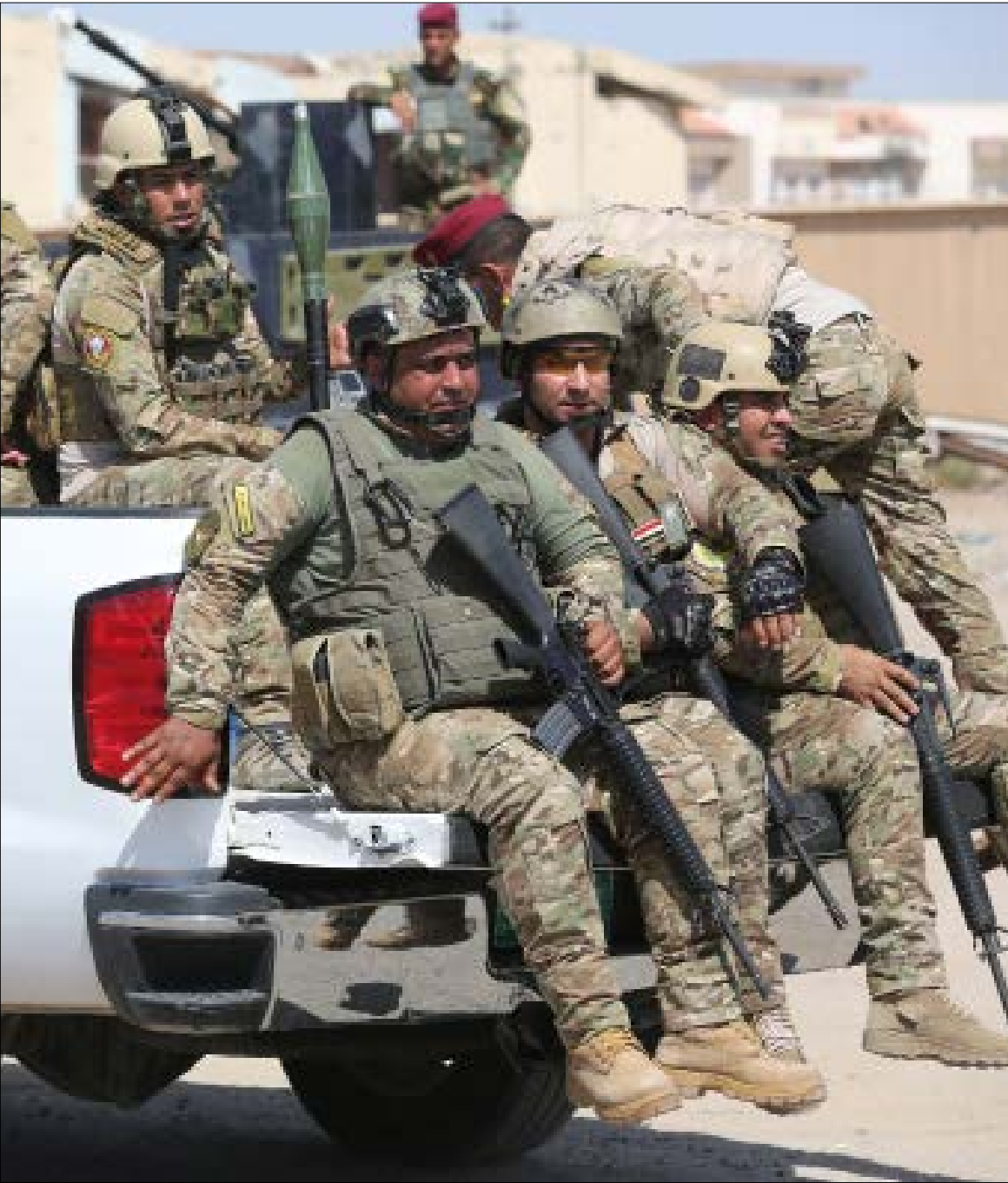
جرى تحرير مناطق عدة قريبة من الرمادي في الانبار امس (الاناضول)

ووزعت قيادة العمليات صوراً للقوات العراقية داخل شوارع الشرقاط، وهي تنزل رايات تنظيم «داعش» وصوراً أخرى لجثث المسلحين وبينهم أجانب.