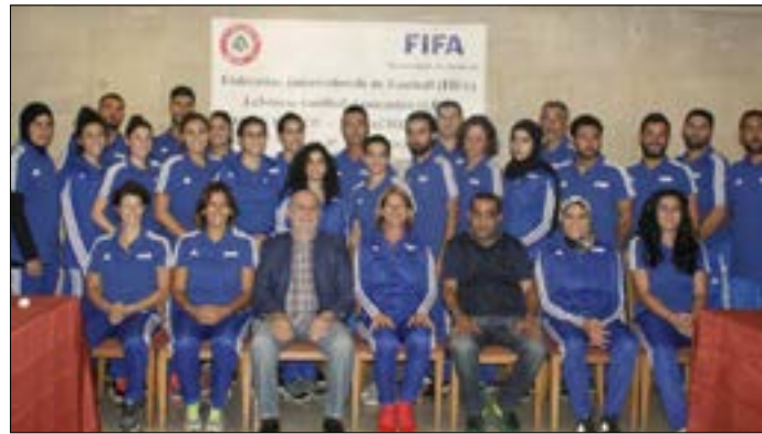
الشغف وموراتشي مع المدربين والمدربات

افتتح الأمين العام للاتحاد اللبناني لكرة القدم جهاد الشغف دورة صقل وتخريج مدربين ومدربات في كرة القدم النسائية، التي يقيمها الاتحاد اللبناني بإشراف الاتحاد الدولي للعبة. وتقام الدورة من 1 حتى 5 تشرين الثاني الجاري في فندق رامادا، على أن تقام التدريبات العملية على ملعب مجمع بئر حسن بمشاركة 32 مدرباً ومدربة. ويحاضر في الدورة المحاضرة الإيطالية كارولينا مورانشي التي تعدّ من أهم لاعبات ومدربات كرة القدم النسائية. حفل الافتتاح أقيم أمس في فندق رامادا، حيث تحدث الشغف عن أهمية الدورة مع وجود محاضرة بقيمة مورانشي التي حضرت إلى لبنان لتطوير كرة القدم النسائية. وشدد الشغف على ضرورة التمتع بالجدية من قبل المدربين، وخصوصاً في تطبيق البرامج والقوانين في البطولات المحلية.