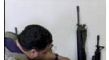
يستخدم السلاح أحياناً لـ«الأتاوات» وكذلك الاستنجاز (إيه بي آيه)

المصادر نفسها لفتت إلى أن الأجهزة الأمنية التابعة للسلطة عمدت في الأشهر الأخيرة إلى «فرض القانون والنظام في مخيمات اللاجئين في الضفة، وتحديداً ما يتعلق بحملة السلاح