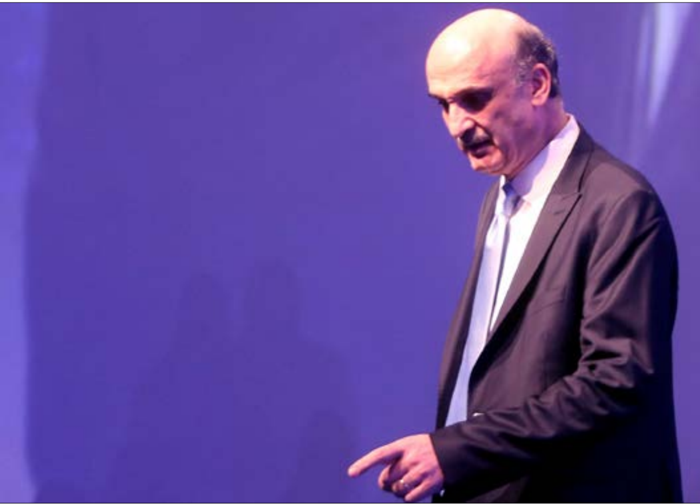
حزب القوات اللبنانية يحاول وضع «فيتو» على توزيع حردان (هيثم الموسوي)

بعدها بات رئيس حزب القوات اللبنانية سمير جعجع متيقناً من إجماع خصومه وحلفائه على عدم منح وزارة سيادية، لم يجد غير «الحركة» على العهد، في أولى حكوماته. في المقابل، يبدي الرئيس نبيه بري إيجابية لافتة مع الرئيس سعد الحريري، رغم «الطعنة» التي وجهها الأخير إليه