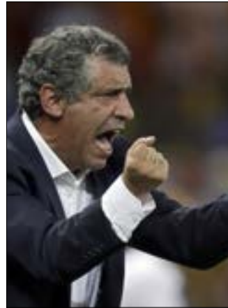
بين المرشحين (أرشيف) البربرغ فرانكو سانتوس

وبعد انتهاء شراكتها مع مجلة "فرانس فوتبول"، حدد "الفيفا" 8 جوائز سيعمل الفائزين بها في 9 كانون الثاني المقبل خلال حفل في زيورخ، وهي: أفضل لاعب وأفضل لاعبة وأفضل مدرب في فئة الرجال، وأفضل مدرب في فئة السيدات، وجائزة بوشكاش لأفضل هدف واللعبة النظيف والمشجعين 2016 والتشكيلة المثالية. ويكشف النقاب اليوم عن الأسماء العشرة المرشحة لنيل جائزة أفضل لاعبة، فيما ستُنشر قائمة المرشحين الـ 23 لجائزة أفضل لاعب غدًا الجمعة.