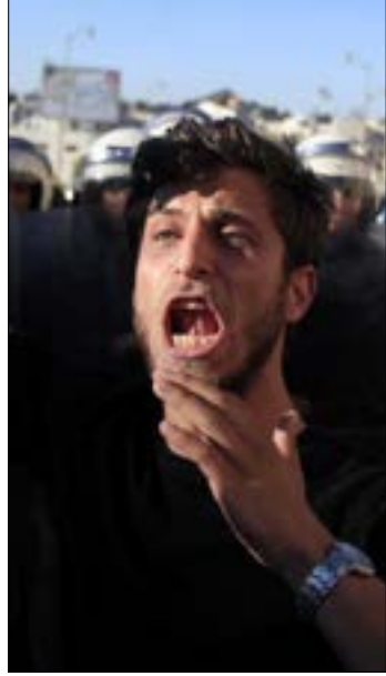
(إيه بي آيه)

على الاحتلال، وخصوصاً أنها أتت في الوقت الذي تتكالب فيه القوى الدولية والكثير من القوى الإقليمية لحشر الشعب الفلسطيني بين خيارين: إما استمرار الطوق وسلبه عناصر الصمود والمقاومة، وإما التسليم بالهزيمة عبر قبول شرعنة الاحتلال والتكيف مع سقوفه السياسية والاستيطانية.