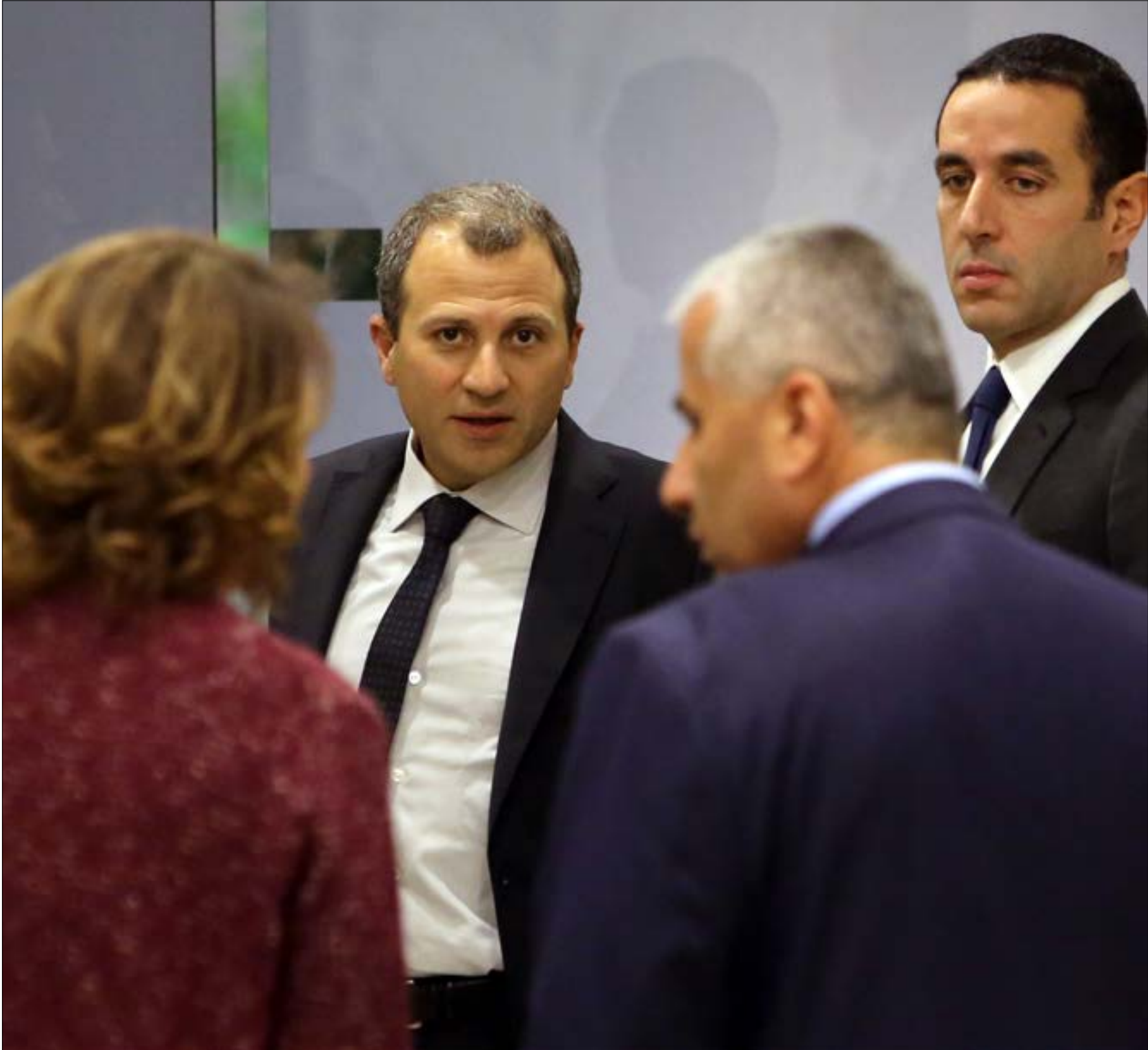
قد تتألف الحكومة من 30 وزيراً لإرضاء الجميع مع عدد من وزارات الدولة