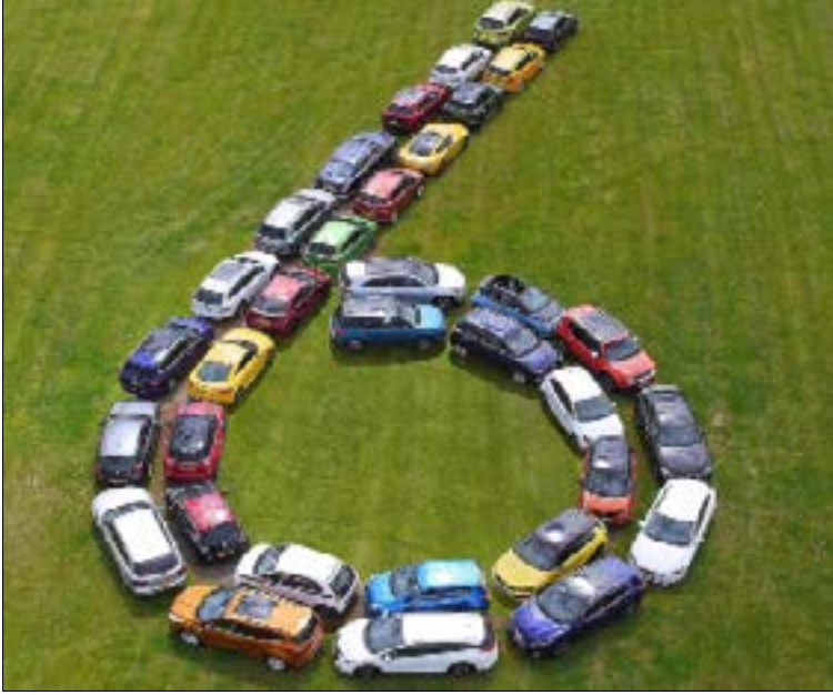
مصادر وزارة الطاقة: ليس هناك منع على استيراد السيارات

https://www.youtube.com/watch?v=SU7BvqelkA