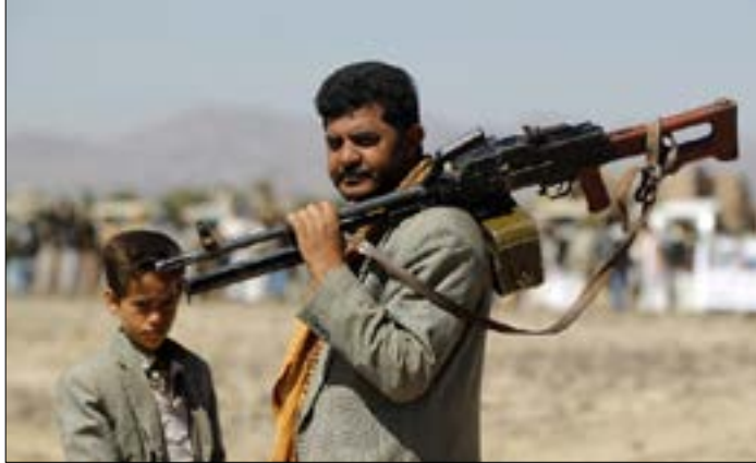
سجّل ارتفاعاً ملحوظاً في عمليات قنص بنفها قناصة يمنيون

إضافة إلى مواقعهم المستحدثة وتحركاتهم. وتابع المصدر أن عمليات رصد الجيش السعودي في تحركاته وتغييراته المستحدثة في الميدان تقلص كثيراً من هامش الخطأ في الضربات المدفعية والصاروخية التي تنفذها يومياً القوات اليمنية، وتزيد من حجم الخسائر في صفوف الجيش السعودي وعتاده العسكري. وأشار المصدر إلى زيادة اعتماد الجيش السعودي ومراهنته على سلاح الطيران نتيجة فقدان القدرة على التحكم في مسار العمليات على الأرض وتضييق الخناق أكثر على هامش تحركات عناصره وتنقلاتهم، مؤكداً أنه تم خلال الأسبوع الأخير استهداف عشرات التجمعات التابعة للجيش السعودي. وكان مصدر عسكري يمني قد أكد اشتعال النيران داخل معسكر عين الثورين في عسير بعد استهدافه من قبل سلاح المدفعية اليمنية، مشيراً إلى مباشرة سيارات الإسعاف عمليات إجلاء الجنود السعوديين ممن أصيبوا نتيجة الضربة.