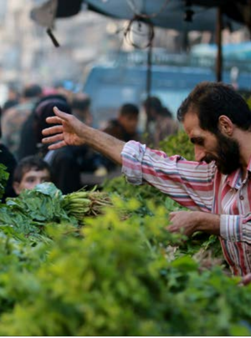
من أحد أحياء حلب الشرقية أمس

وحصلت «الأخبار» على معلومات مؤكدة تفيد بدخول شحنات جديدة من الأسلحة إلى البلدة الواقعة في أقصى الريف الشمالي لإدلب عبر معبر باب الهوى الحدودي. وبدأ لافتاً أن دخول تلك الشحنات ترافق مع هبوط مروحيات تركية على مقربة من مخفر البلدة، ووفقاً لمصادر «الأخبار» فقد أقلت الحوامات ضباطاً وصناديق نُقلت إلى المخفر. ويبدو مستغرباً استخدام الحوامات في ظل إمكانية الاقتصاص على الطرق البرية المفتوحة بين الأراضي التركية والبلدة الواقعة تحت سيطرة «فيلق الشام» و«حركة أحرار الشام الإسلامية». وليس من الواضح ما إذا كان الأمر يتعلق بخصوصية الضباط المذكورين، أو أنه يأتي في سياق رسائل عرض قوة ترسلها أنقرة إلى دمشق التي هددت قبل فترة وجيزة بإسقاط أي طائرة تركية تخترق الأجواء السورية. وتعد أطمه منفذاً شديداً الحيوية في ما يتعلق بمعارك حلب تحديداً، إذ تسلك الإمدادات طريقها بسلاسة عبر الدانا (ريف إدلب الشرقي) إلى الأتارب الملاصقة لها في ريف حلب الغربي. يأتي ذلك في وقت تعثرت فيه محاولات «جيش الفتح» في إحداث اختراق جديد مؤثر على تخوم الأحياء الغربية لمدينة