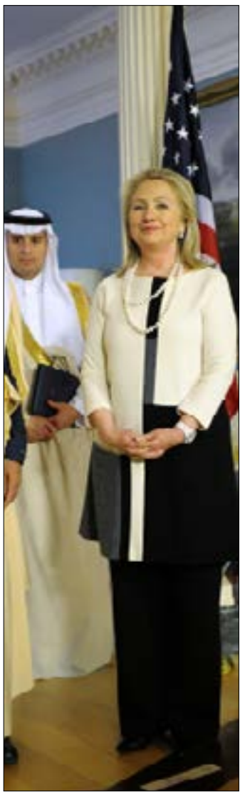
تظهر مفاعيل الكرم السعودي من خلال عمله مراكز تنبؤ كلينتون

الأكيد أن السعوديين يعولون على وصول هيلاري كلينتون إلى البيت الأبيض لضمان تحسّن علاقاتهم بواشنطن بعد تضررها في أواخر عهد أوباما، ومن المؤكّد أن لائحة المطالب السعودية لدى صديقتهم القديمة لن تكون قصيرة. أخطرها قانون "جاستا" الذي تأجل بت إمكانية تطبيقه إلى ما بعد الانتخابات، وملف الصراع مع إيران وتعويل الرياض على إقناع واشنطن بسياسة مختلفة تجاه الجمهورية الإسلامية، عنوانها تصعيد المواجهة المباشرة معها ومع حلفائها في المنطقة.