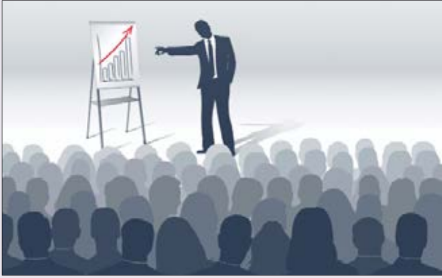
احرص على أن يكون في حوزتك نموذج أولي عن فكرتك

يقال إنَّ الأسلوب هو رداء التعبير. كيفية إيصال الفكرة، صياغتها، طرحها، تقديمها، كلها عوامل تؤثر في الفكرة بحد ذاتها. بعض الأفكار العظيمة قد تضيع لأن صاحبها لم يجد الطريقة الأمثل للتعبير عنها. كما أن بعض الأفكار العادية قد تجد من يتبنّاها لأنها قدّمت بطريقة جذابة. ولأن أصل الشركات الناشئة واية مشروع بالمطلق مصدره فكرة، وطالما أن التمويل أساسي لتجسيد الفكرة على أرض الواقع، لا بد أن تدرك أن أسلوبك، وكيفية طرحك لمشروعك يعتبران من الأمور المحورية لكي تكسب اهتمام المستثمرين