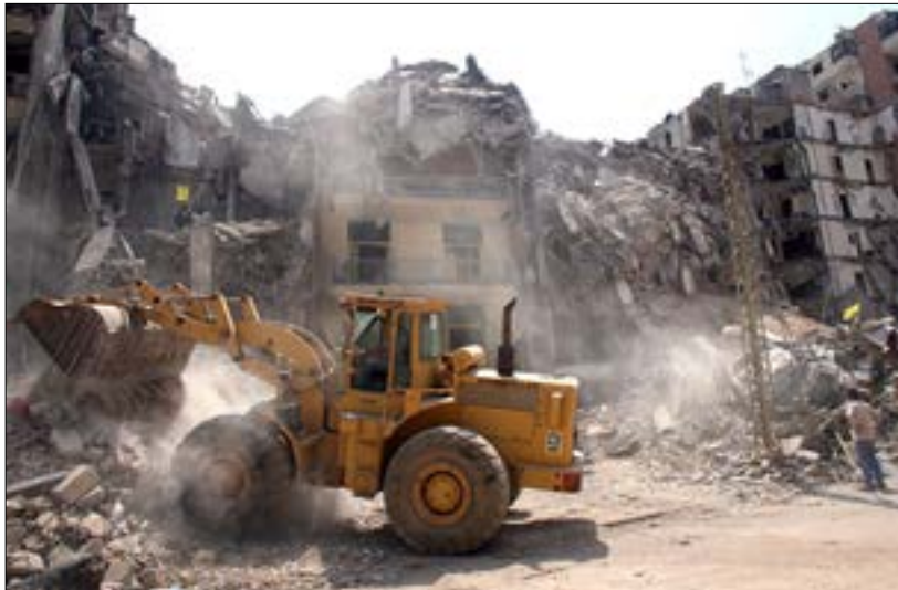
برغم الانتصار ما زالت بعض القوى مستمرة في حربها على الأمة (هيثم الموسوي)