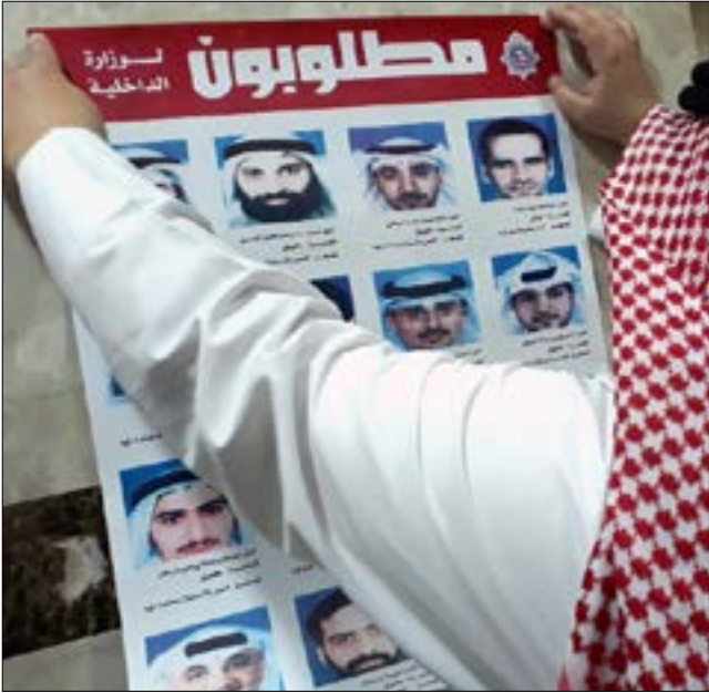
جاء القرار بعد صدور حكم محكمة التمييز بشأن «خلية العبدلي»

في خطوة لا تبدو بعيدة من تداعيات الأزمة الخليجية المندلعة راهناً. أقدمت الكويت أمس، على إجراء غير مسبوق في علاقاتها مع إيران؛ إذ عمدت إلى طرد السفير الإيراني ومعه 14 دبلوماسياً معتمداً لديها بدعوى ارتباطهم بـ «خلية تجسس وإرهاب». خطوة تحمل، من حيث توقيتها ونوعيتها، دعماً للموقف السعودي المناوئ لقطر على خلفية علاقاتها بإيران، وتضعف جهود الوساطة التي يقوم بها أمير الكويت صباح الأحمد الصباح، والتي لم تفلح إلى الآن في اختراق جدار الأزمة. ونقلت وكالة الأنباء الكويتية الرسمية عن مصدر مسؤول في وزارة الخارجية أنه تم إبلاغ السفير الإيراني علي رضا عنابتي بقرار السلطات خفض تمثيل طهران الدبلوماسي في البلاد. وأوضح أن القرار يتضمن خفض عدد الدبلوماسيين العاملين في السفارة الإيرانية (من 19 إلى 4)، وإغلاق المكاتب الفنية التابعة لها (مكتب الملحقية الثقافية والمكتب العسكري)، وتجميد أي نشاطات في إطار اللجان المشتركة بين البلدين. وأشار المصدر إلى أن القرار جاء