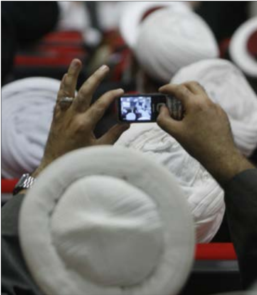
بعض التجارب الفردية لعلماء دين تشير إلى نحو من التكاثر الحيوي في استنهاض الأمة (هيلم الموسوي)

* رئيس معهد المعارف الحكمية للدراسات الدينية والفلسفية