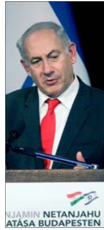
NJAMIN NETANJAHU ATÁSA BUDAPESTEN