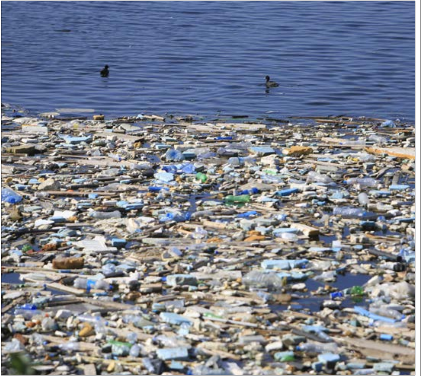
في صيدا جزيرة بيئية تحصل بوميا ولا يدفع ثمنها الاسكان المدينة علي (حشيشو)

علماً بأن الضغط على الشركة المشغلة لمعمل النفايات، أنتج حلولاً جزئية، ولا سيما أنه منذ مطلع الشهر الجاري، بدأت مهلة الأشهر الأربعة التي منحها السعودي لإدارة معمل معالجة النفايات في صيدا، للتخلص من جبل العوادم الذي ارتفع في باحته الخلفية بعد تراكمها لأشهر عدة (مقدرة بنحو 16 ألف طن). ومنذ أيام، بدأ عمل الكسارة الضخمة التي استقدمتها الشركة المشغلة (IBC) لفرم العوادم بعد خلطها بالردميات. السعودي تفقد قبل أيام معمل النفايات، ليعلم لاحقاً أن تراكم العوادم المختلطة بالنفايات العضوية التي سببت انبعاث الروائح الكريهة في الأونة الأخيرة «ستزال في غضون أربعة أشهر، على أن يتوقف أي تراكم جديد للعوادم نهاية العام الجاري». وقال السعودي لـ«الأخبار» إن الكسارة الضخمة، إضافة إلى الكسارة التي كانت متوافرة، تقوم