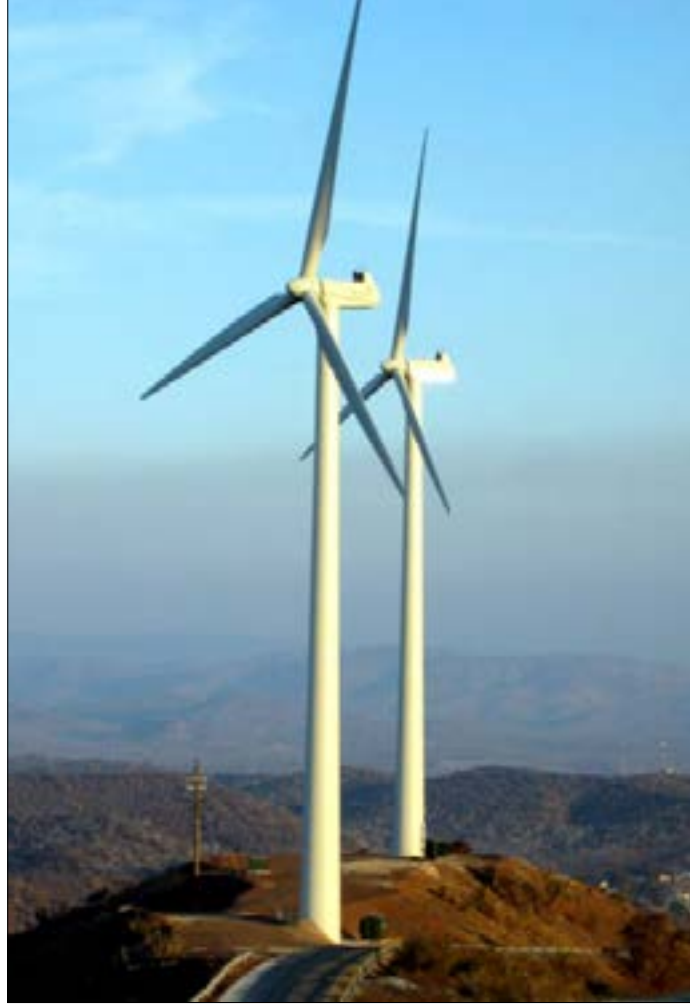
هل هبت رياح طاقة الرياح؟

وأضاف: «إذا كان بالإمكان، حسب مصادر وزارة الطاقة، إنتاج الكهرباء بواسطة الغاز الطبيعي بكلفة أقل بكثير من كلفة الإنتاج من الطاقة الهوائية الخيالية، فلماذا هذا القرار الملزم على مدى عشرين سنة؟ كذلك لم يحدد قرار مجلس الوزراء قدرة الإنتاج المرخص بها لكل من الثلاث شركات... مستنداً (قرار مجلس الوزراء) بالشق الفني إلى العقود المعمول بها في