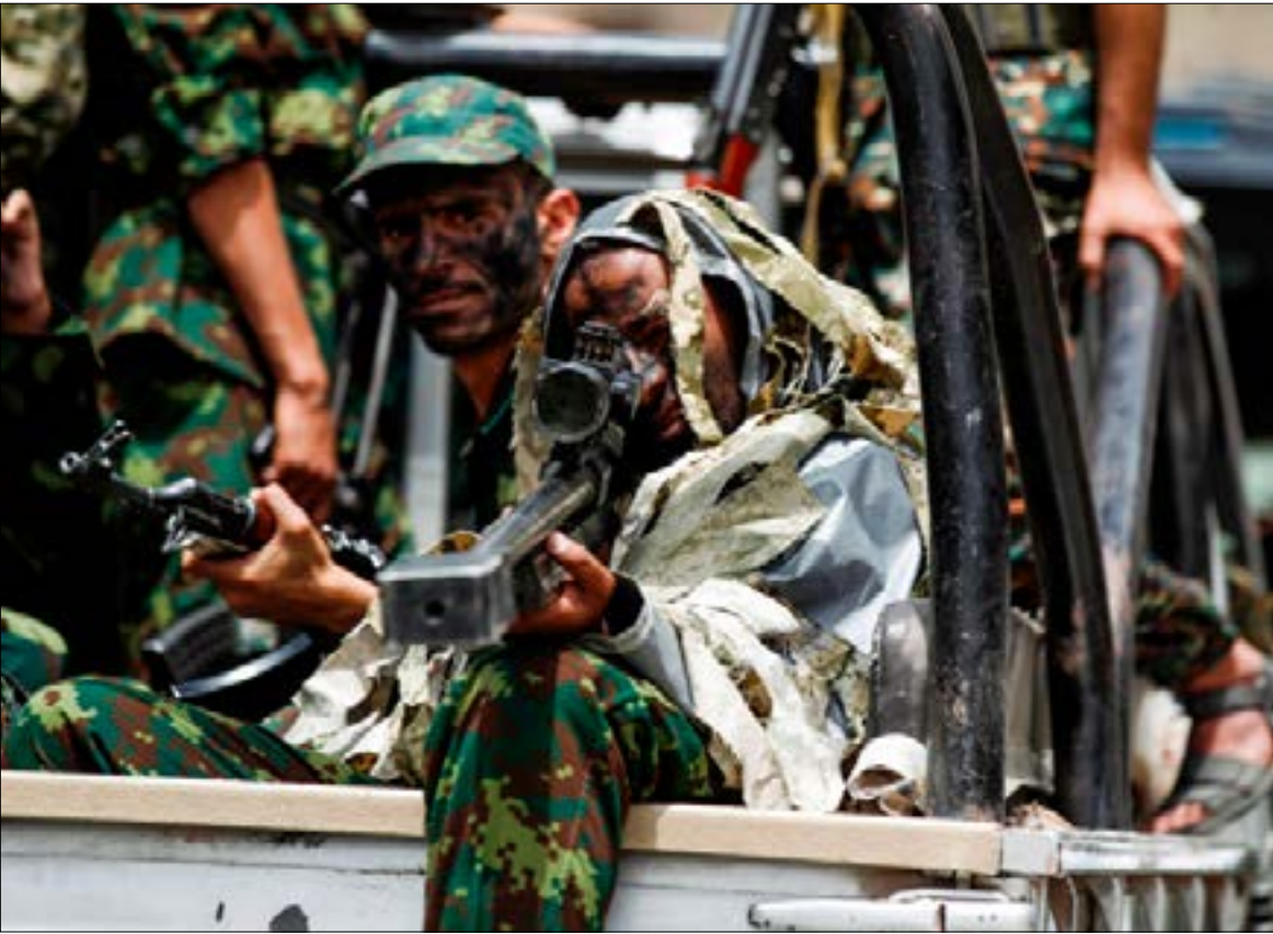
مع اتسام رقعة سيطرة الإمارات اتخذ الموقف القطري مساراً أكثر وضوحاً

بعدها لمبت دوراً رئيساً في تسعير أوار الحرب باليمن لمطامح خاصة بها. تحاول قطر اليوم نفض يديها عن «لوثة» الحرب. محيلة الملف اليمني إلى منصة إطلاق ضد السعودية والإمارات. وهو ما قد يفتح الباب على تبدلات إضافية أكثر جوهرية في الاصطفافات على الساحة اليمنية. لكن إحجام الدوحة عن إجراء مراجعة حقيقية (لا من باب المكابدة) لدورها واستراتيجيتها ربما يجعل التقارب معها عسيراً أقله على المدى المنظور