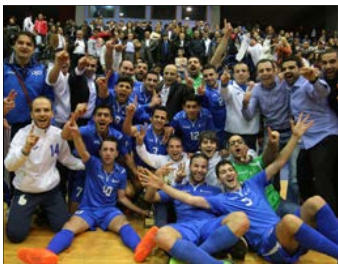
بعثك الفريق لبنان بعد إحرازه لقب الفوسنك

يستهل نادي بنك بيروت الرياضي بطل لبنان لكرة الصالات مشاركته في بطولة آسيا للأندية 2017 المقامة في فييتنام، اليوم الجمعة عندما يواجه فريق تشونبورى بلو وايف بطل تايوان عند الساعة العاشرة بتوقيت بيروت. وكانت بعثة الفريق قد وصلت إلى مدينة هو شي منه في فييتنام منذ 10 أيام، حيث خاض اللاعبون تمارين مكثفة يومياً، بالإضافة إلى جلسات فيديو تحضيراً لمواجهة الفريق التايلاندي وفريق الماليك الأوزبكي صباح الأحد في التوقيت عينه. وعن التحضيرات للبطولة، يقول مدرب الفريق الصربي دييجان ديدوفيتش الذي يخوض غمار هذه