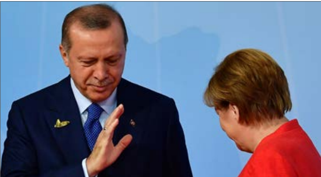
قال الرئيس التركي إنه لم يندم على مقارنة النظام الألماني الحالي بأيام النظام النازي

وأوضح أن الهدف من الأكشاك «استعادة القيم المهجورة في حياة الناس، وهم في أشد الحاجة إليها، مثل قيمة التراحم والتعاون والمحبة بين الناس، وتبيان قيمة المواطنة والانتماء إلى الوطن، ومواجهة التحديات الراهنة التي تقف القوات المسلحة بالمرصاد لمن يحاولون النيل من استقرار الوطن بالتعاون مع قوات الشرطة»، مشيراً إلى أن مواجهة الإرهاب لا تنحصر في الجهود الأمنية فقط، «بل لا بد من مواجهة الفكرية، وتصحيح الأفكار المغلوطة والتفسيرات الخاطئة للنصوص القرآنية والنبوية التي تستخدم أحياناً لاستباحة القتل والتفجير وتدمير مقدرات الوطن». وأكد أن «جماعات التكفير والإرهاب تستند في أعمالها إلى فتاوى