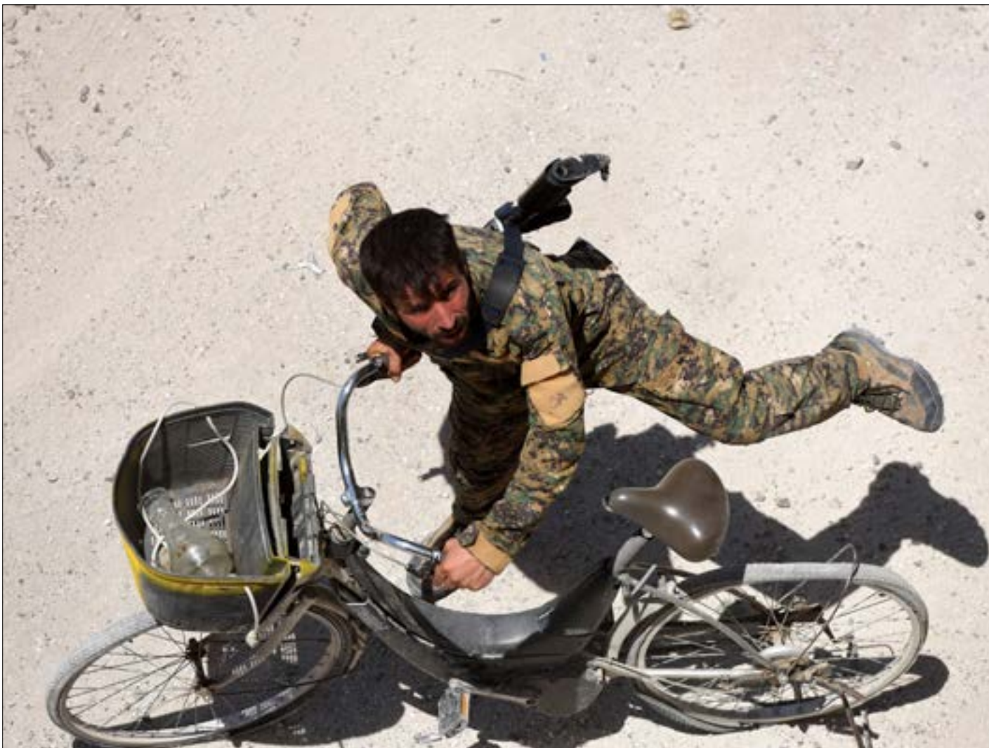
يشير تحريك انقرة لـ«فصائلها» نحو إدلب إلى قرارها الترتيب في أي عملية نحو عقرب

تجتمع معطيات المشهد السوري الراهنة لتكشف عن مرحلة جديدة من «التفاهات» الأميركية - الروسية، لا تختلف عن التصور الذي ناقشته اجتماعات مسؤولي البلدين الطويلة في زمن إدارة الرئيس الأميركي السابق باراك أوباما. نجاح التفاهم على «محاربة الإرهاب» اصطدم حينها بعدم الجدية الأميركية تجاه «فصل المعتدلين عن المتطرفين»، وبشكل أوضح إقصاء «جبهة النصر» من المشهد. أما اليوم، فتبدو الأجندة الأميركية مركزة على الحفاظ على ما تم تحقيقه (مع الاكراد في الشمال) والعمل مع الروس على ما يمكن الرهان عليه (كما في اتفاق الجنوب أو اتفاقات لاحقة متوقعة)، مع مراعاة تكثيف الضغط على إيران في سوريا، و«محاربة داعش» بطبيعة الحال.