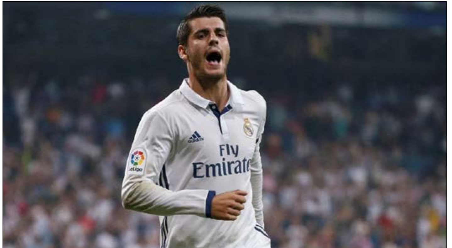
انضم موراتا إلى كتيبة الإسبان في النادي اللندني

قلنا موراتا وكوستا؟ ها هو موراتا يحل بدلاً لكوستا في تشلسي، وبالتأكيد فإن تألقه في لندن سيكون بوابته لأن يحل بدلاً منه في منتخب إسبانيا في صيف المونديال المقبل.