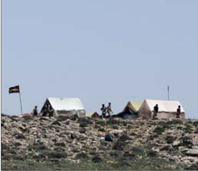
القصف الجوي والمدفعي أمس بمهد لبدء تقدّم قوات مشاة المقاومة والجيش السوري