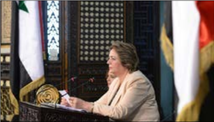
شكاوى نيابية متكررة على ممارسات عباس «المستفزة»