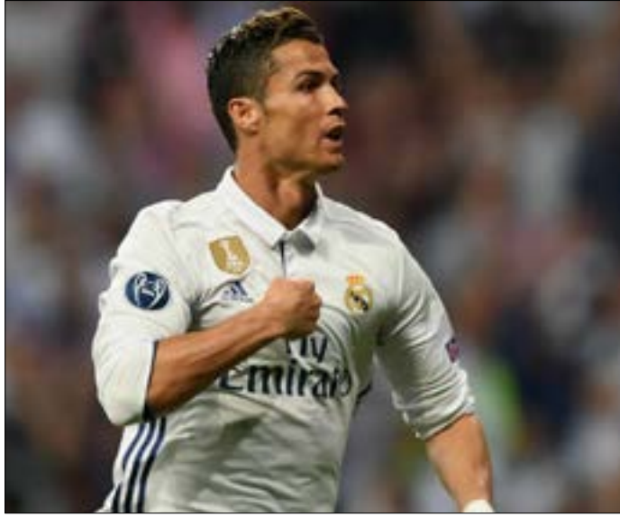
يستعين رونالدو حالياً باختصاصي في امراض النوم (ارشيف)

رونالدو. وبسبب ليلتهالز، فإن «سي آر 7» لا ينام كمعظم الناس ثماني ساعات متواصلة، بل خمس مرات في اليوم، لمدة تسعين دقيقة في كل مرة. وبذلك، يتبع رونالدو الآن نصائح