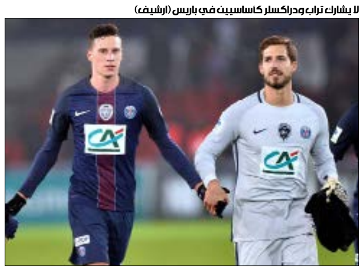
لا يشارك تراب ودراكسل كاساسين في باريس

هذا الموسم مع فريق العاصمة الفرنسية، وهو يريد أن يلعب لمدة أطول لتعزيز فرصه في المشاركة مع منتخب بلاده في كأس العالم 2018، وقد سبق أن عبّر عن رغبته في الانتقال إلى الدوري الإنجليزي الممتاز، ما سيسهل المهمة على ليفربول، الذي يعاني من هبوط مستوى حارسه