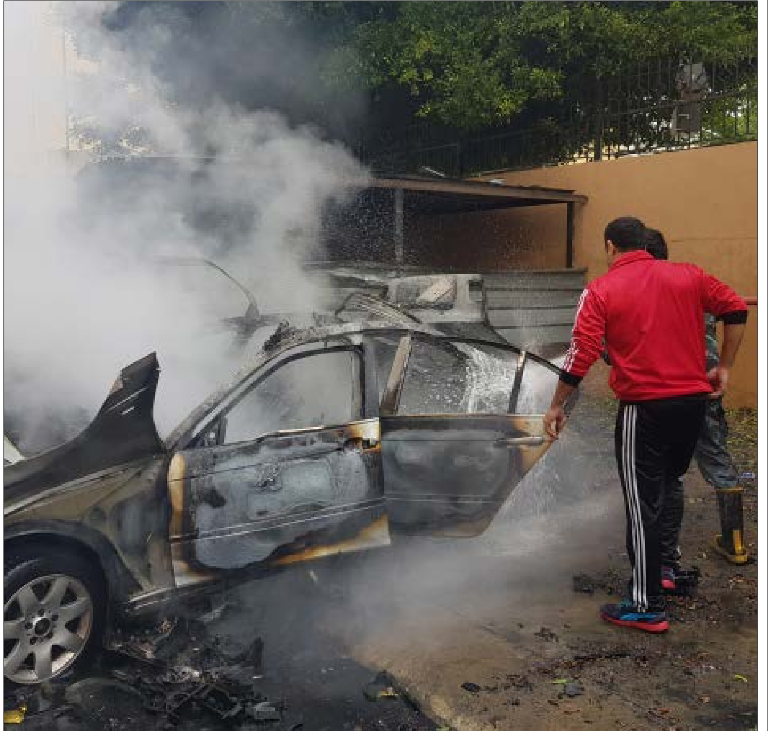
يجري التحقيق في تسجيلات كاميرات المراقبة لمحاولة تحديد متورطين