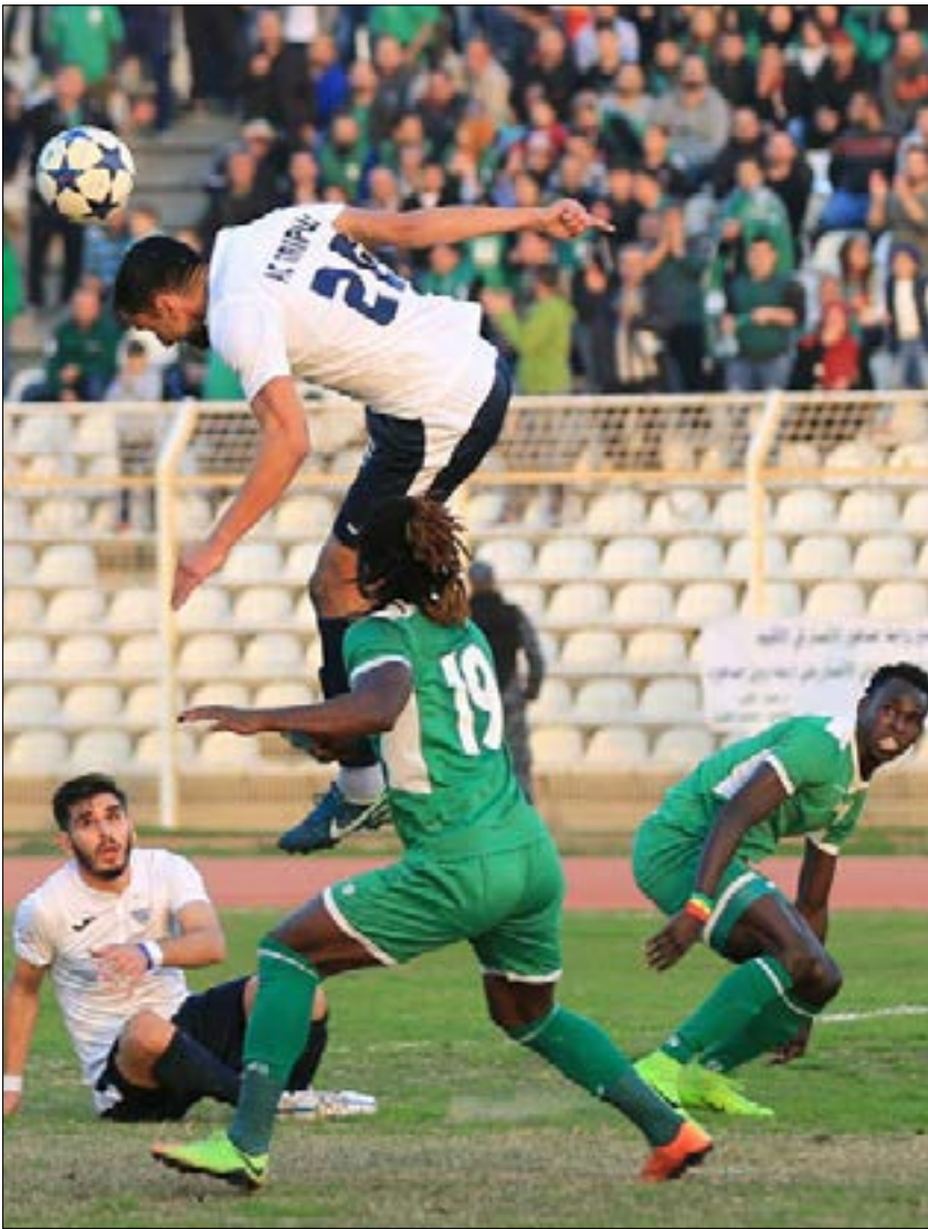
نار الطرابلسيون من الانتصارات وابعدوهم عن المنافسة على اللقب