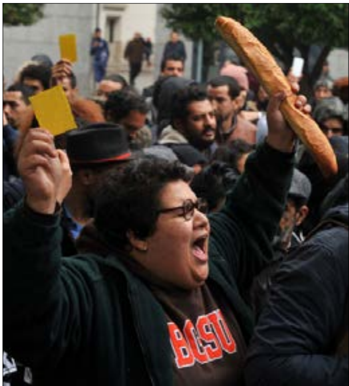
حصدت الحملة الأمنية ما يقارب 800 موقوف

طبعاً رأي السلطة. الواقع أن التعامل الإعلامي المحلي طغت عليه المبالغة في تضخيم أعمال الشغب والسرقعة (وهو ما نسبته قائد السبسي إلى الإعلام الأجنبي)، على حساب القضية الأصلية، ما جاء في قانون المالية من ترقيع للضرائب على كل شيء تقريباً.