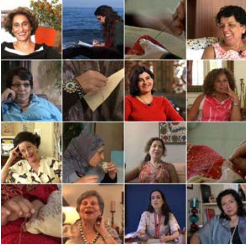
من «خيوط السرد» لكارول منصور

الإحتلال، حياتهن الحالية، أحلامهن وفلسطين التي تربطها شيئاً فشيئاً خيوط من فن التطريز القديم. سنرى ونستمع إلى محاميات، وفنانات، وربات منزل، وناشطات،