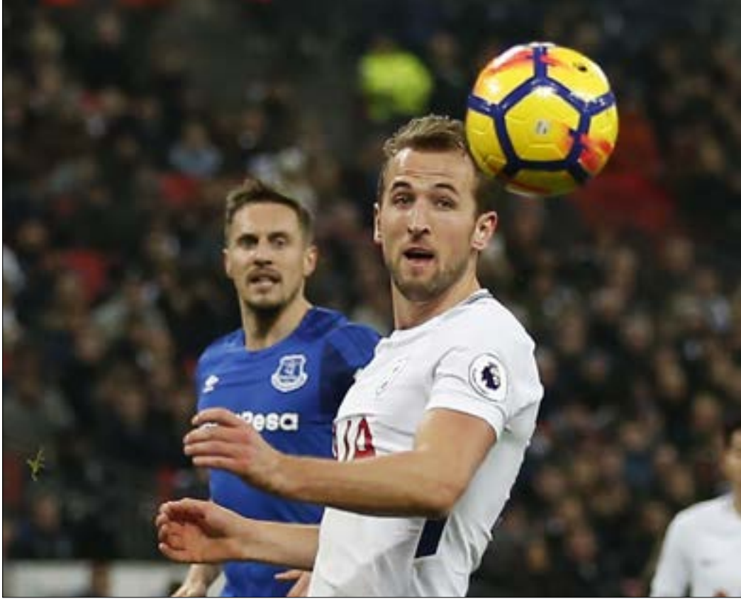
رفع كاين رصيده إلى 98 هدفاً مع توتنهام

قبل انطلاق الموسم الحالي، وقبل أن يحقق كاين ما يحققه الآن، سئل مدرب تشلسي، الإيطالي أنطونيو كونتي، في مقابلة مع صحيفة «ذا غارديان» الإنكليزية عن المهاجم الذي يرغب في ضمه، فأجاب: «إذا أردت أن أشتري مهاجماً، فسأختار هاري كاين. إنه الآن أحد أفضل المهاجمين في العالم». اللافت أن كونتي قال كلماته تلك متجاهلاً مهاجمه الإسباني ألفارو موراتا الذي كان قادماً لتوّه إلى الفريق من ريال مدريد الإسباني. هكذا، بات كاين يشغل فكر المدرب، رغم أن الكثير لا يزال بإمكان هذا اللاعب تقديمه، ورغم أنه لا يزال في بداية مسيرته.