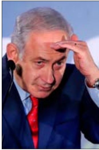
من التسهيلات منح تأشيرات لرجال الاعمال الهنود صلاحيتها 5 سنوات (أ ف ب)

في هذا السياق، ركزت مراكز الأبحاث والدراسات الإسرائيلية التي قاربت العلاقات مع الهند، طوال المراحل السابقة، على ثلاثة عناصر رأت أنها