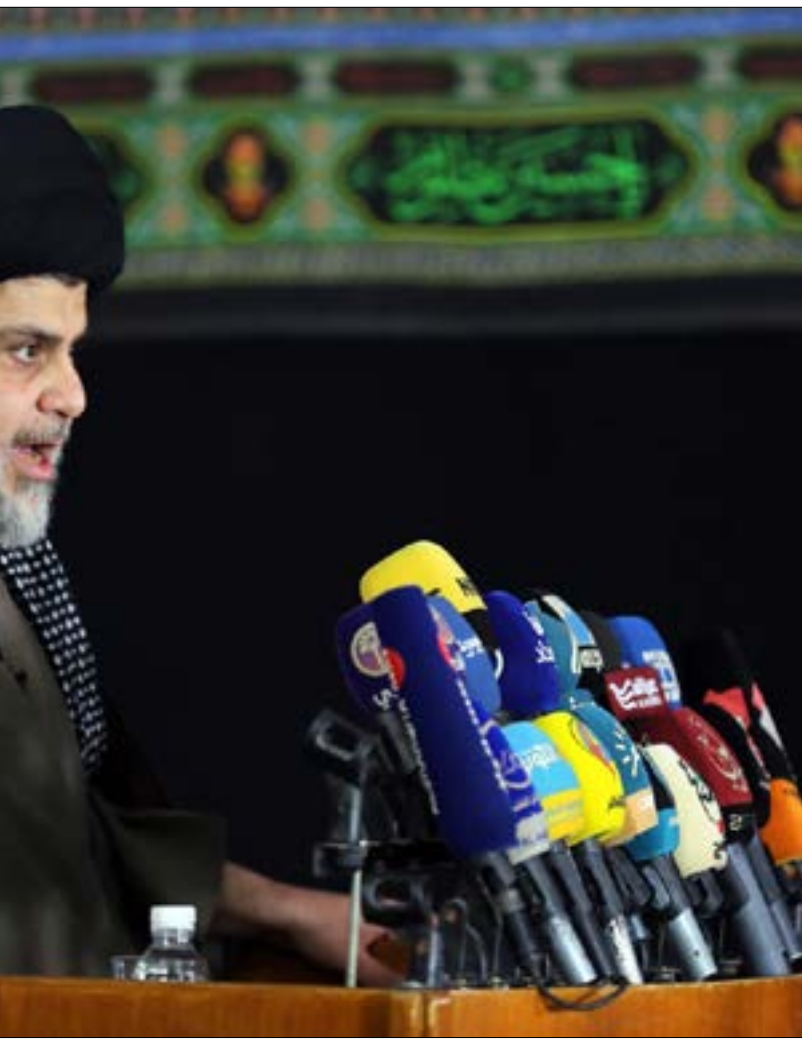
امتعاض الصدر من «نصر العراق» بتفاسمه مع العديد من القوى والتيارات

القرارات، وتحديد المسارات، وصنع السياسات ثالثاً».