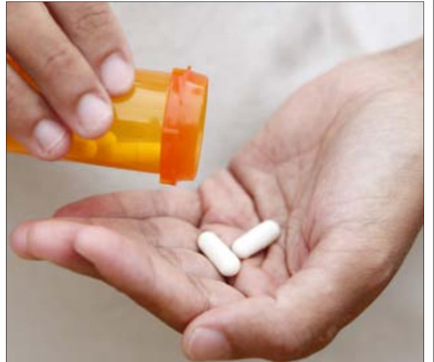
الجمعية تنتظر احتضان وزارة الصحة العامة للتطبيق، وإعطاءه فرصة الإخضاع للتجربة

الانطلاقة كانت مع مشروع بحثي طلابي يبتكر طريقة جديدة لكشف الأدوية المزورة والبديلة. المشروع شارك في مباراة العلوم في العام الدراسي 2015 . 2016، وهي مباراة سنوية يتنافس خلالها طلاب الثانويات الرسمية والخاصة على ابتكار مشاريع علمية لها صفة تطبيقية، ونال يومها جوائز محلية وعالمية.