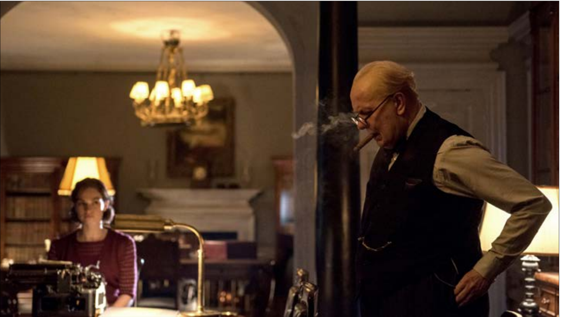
إداء عاك لطاغم الممثلين على رأسهم غاري أولدمان