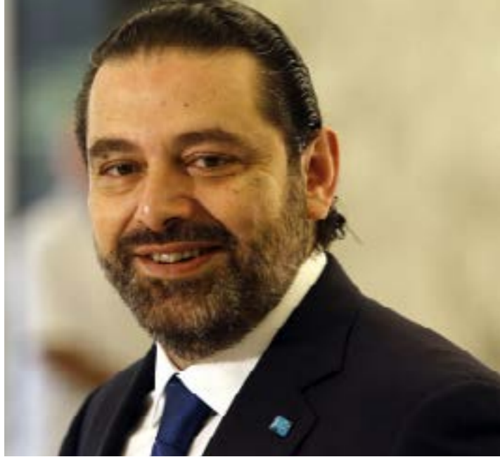
بين 2009 و2018: اي حريري رئيسا للحكومة؟

أكثر من أي وقت مضى من فيه الرئيس رفيق الحريري، بما في ذلك وصوله للمرة الأولى إلى رئاسة الحكومة عام 1992 واتساعه بيروت في انتخابات 2000 بتوجيهه ضربة قاسية إلى عهد الرئيس اميل لحود، أعطت انتخابات 2009 الحريري الإبن ما لم يحظر في مخيلة أحد قبله. بالكاذ اقتضت ثلاثة شهور على بدء المحكمة الدولية أعمالها في الأول من آذار، وكانت حينذاك جزءاً لا يتجزأ من معادلة القوة والسلطة في الداخل مع كل فاضل القوة ذاك، وجد نفسه يقترن عن تكلفه تأليف الحكومة الجديدة جراء شروط الحلفاء والخصوم. أعيد تكليفه بعد 80 يوماً، ولم يتمكن من إحصارها لأن بعد أربعة أشهر و13 يوماً، فأعلنت من الرابية لا من قصر بعدها، وحازت معارضة خسرت الانتخابات النيابية الثلث 1+ لا ماضي بينهما. الواقع لكليهما أن ماضيها، واحدهما في مواجهة الآخر ثقيل للغاية. هو توقيف المدير