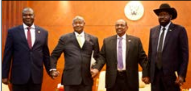
وطني كير ومشار اليه الخرطوم اول من اتس ان