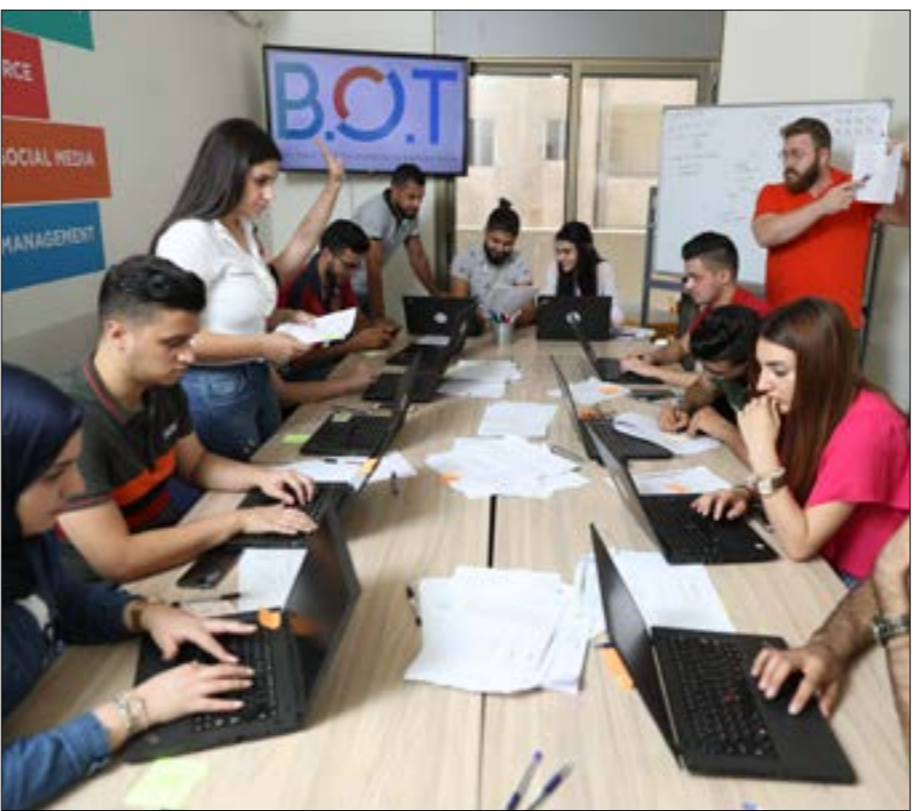
تنحصر فرص العمل التي توفرها المنصة في المجال الرقمي فحسب

مناطق لبنان، وذلك عن طريق تطوير مهاراتهم وتأمين مصادر دخل لهم عبر تشجيع القطاع الخاص على توظيفهم. «الشباب المهتمّش» الذين يستفيدون من المشروع هم «العاطلون من العمل، ومن يسكنون في الأطراف حيث لا تتوفر فيها فرص عمل بشكل كبير، ومن يعملون مقابل أجر زهيد، إضافة إلى