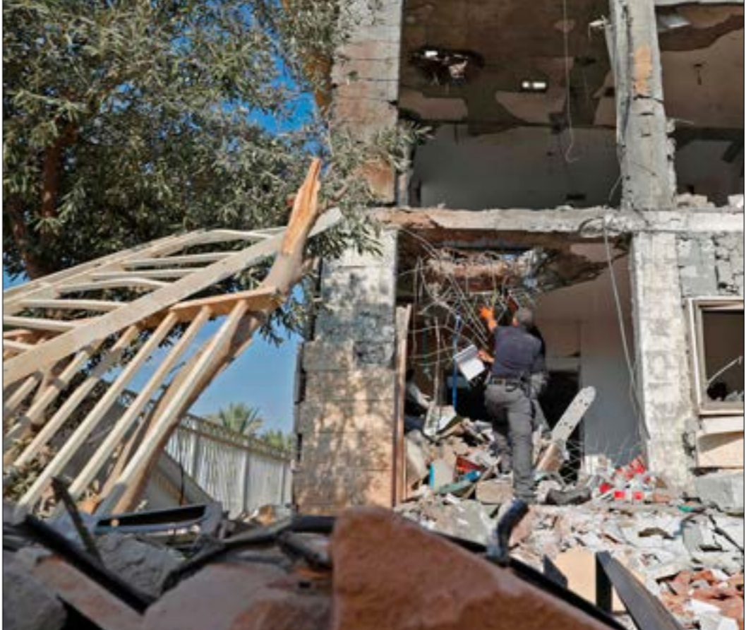
اخترف الصاروخ 3 طبات من الخرسانة، وكان يحوي رسا متفجرا زنته 20 كلغم (٢ ف ه)

في المقابل، قالت مصادر في المقاومة إن الضباط رفعت مستوى استنفارها «خشية حدوث غدر إسرائيلي»، وفرضت إجراءات خاصة لحماية قياداتها، بالتوازي مع إرسالها عبر الوسطاء لمحاولة تحذيراً بانها سترد على أي اعتداء فورا.