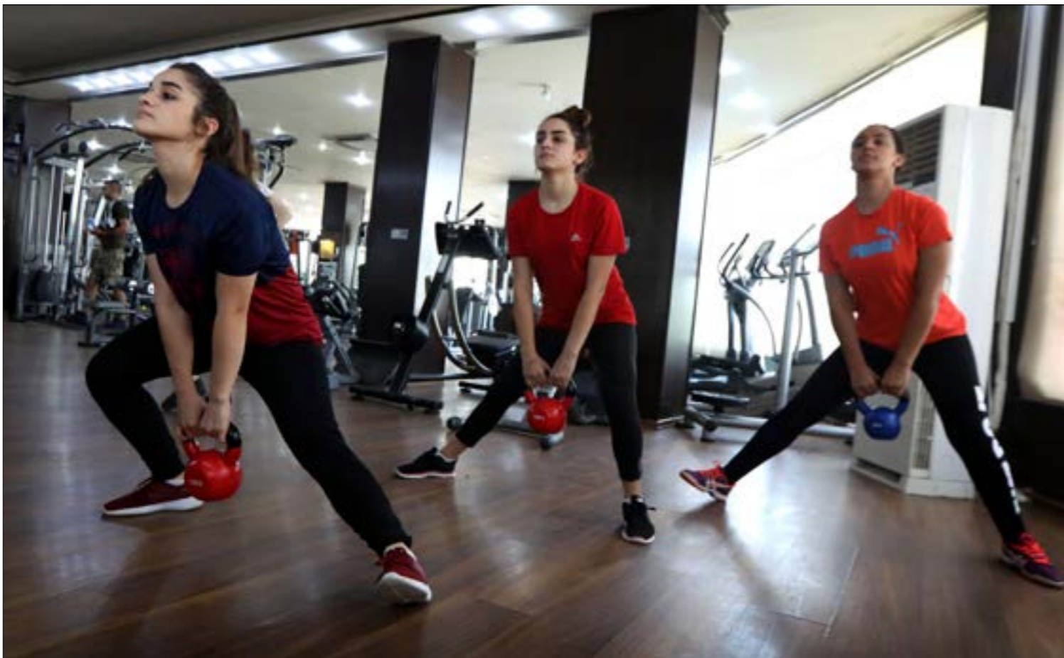
نساء عراقيات في اقليم كردستان خلال التمارين في اربيل. وعرف العراق تاريخياً دوراً لافتاً للنساء في الرياضة على مختلف انواعها، وفي مختلف المحافظات، قبل أن يتراجع هذا الدور ولا سيما في عهد الاحتلال الأميركي للعراق، وفي فترة هيمنة الميليشيات الطائفية بعده، إلا أنه، وفي الشمال، ما زالت المرأة تناضل من أجل حقها في الحياة وفي الرياضة

لا يُمكن المرور على اسم المدرب الأرجنتيني هيكتور كوير عند الحديث عن المديرين الذين يفضلون الخط الدفاعية. السبّتي الذي قاد منتخب مصر في المونديال الماضي، عُيّن منذ فترة على رأس الجهاز الفني للمنتخب الأوزكي، وأشرف عليه في أربع مباريات، فاز في اثنتين منها أمام قطر وكوريا الشمالية، بهدفين دون رد، وتعادل مع سوريا بهدفٍ لثمة وخسر أمام إيران بهدفٍ وحيد. مواجهته الخامسة ستكون مع المنتخب اللبناني اليوم الخميس في الثامنة مساءً بتوقيت أستراليا، الحادية عشرة صباحاً في بيروت، على ملعب «الانغ بارك»، منافسه في