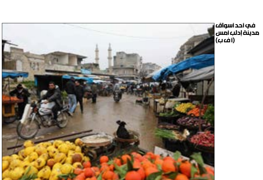
في أحد أسواق مدينة ادلب، أسس

بينما تؤكد تركيا استعدادها لإنشاء «المنطقة الآمنة» بدعم «لوجستي» من حلفائها، وفيما تناوّل التحضيرات لقمة سوتشي الثلاثية المقبلة بين قادة «ثلاثي أستانا»، برزت أسس معلومات عن جدوله زمني قصير للانسحاب الأميركي من سوريا