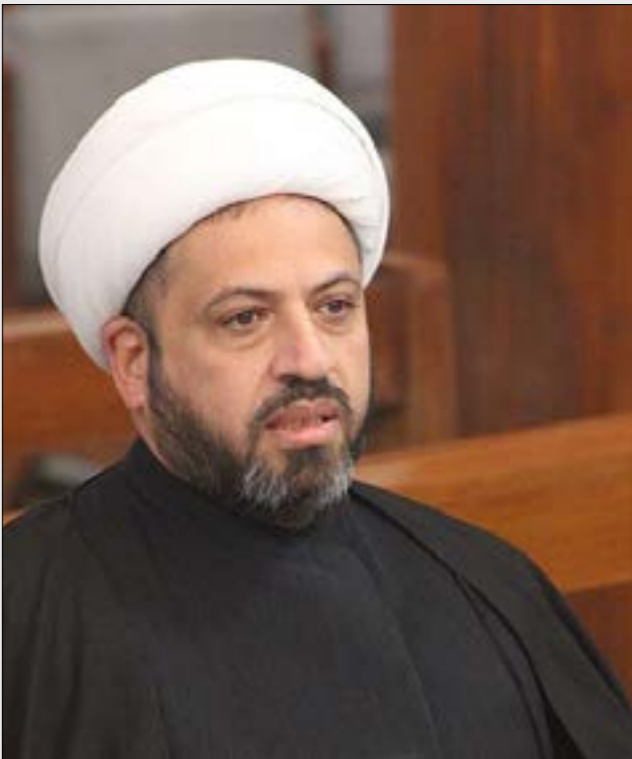
مصادر «الحشد»: جاء اعتقال الحفاجي وصفه مذكرة قضائية (من الويبر)