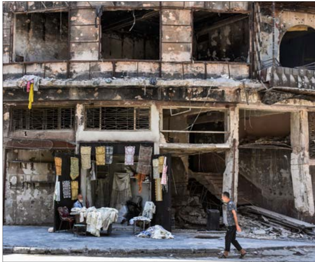
زرك العمر للسكان الذين قصه جزء والسكت في ظروف مأسوية

التقدير الأولي يشير إلى وجود عشرة آلاف مبنى «عالي الخطورة»!