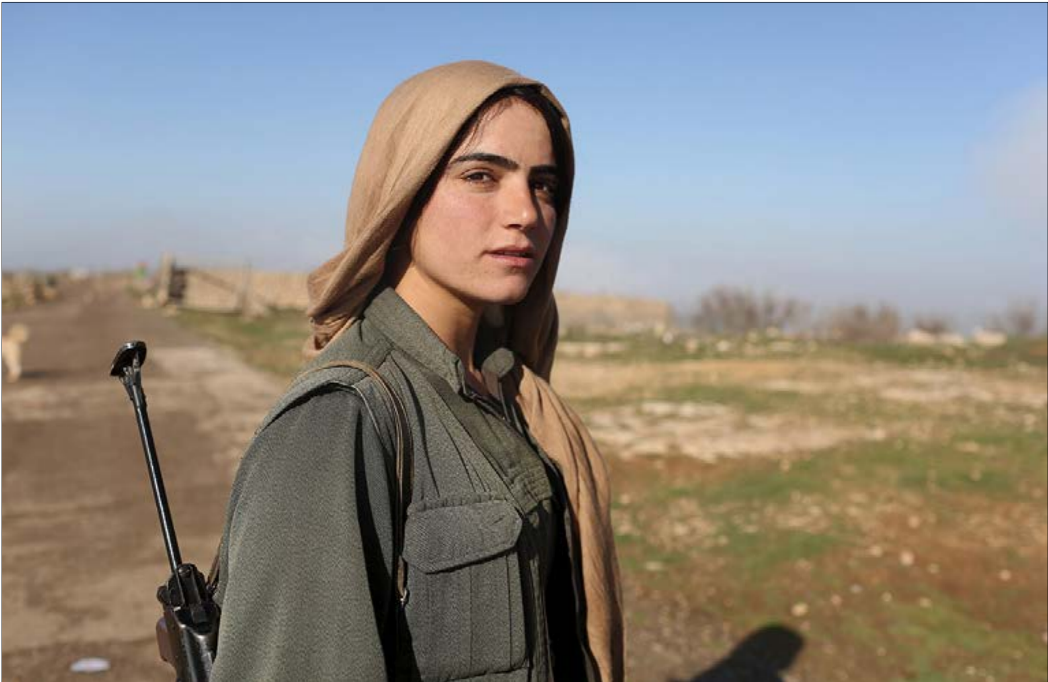
(اسماء، وجيه - روزنر)

عني تركيا العميق لها يعنيه تسليم الورقة الكردية لدمشق بالمنطقة الآمنة