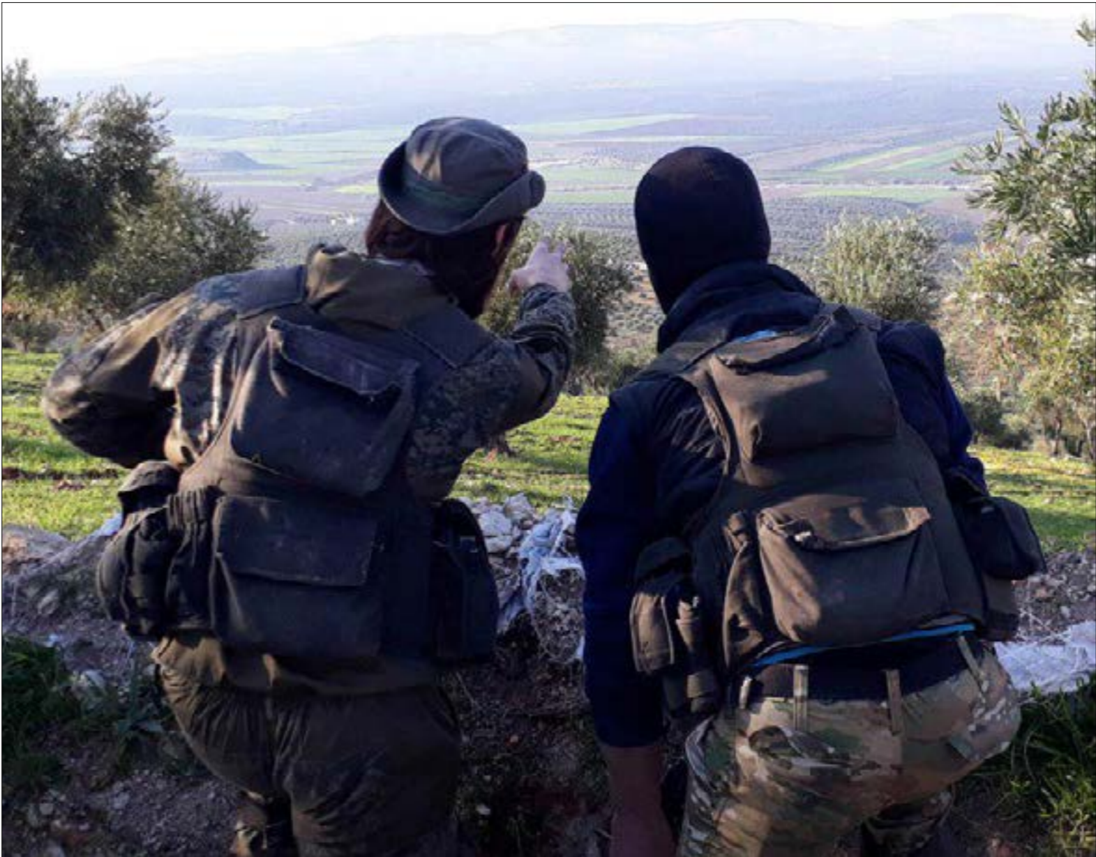
ظلت «جبهة انصار الدين» متمسكة بوقوعها في صفّ «حراس الدين» (رشيّف)

ويأتي هذا الحراك في إطار استعار «صراع المشاريع الجهادية»، (راجع «الأخبار»، ١ شباط 2019)، وتنشط في إدلب مجموعات «قاعدية»، عديدة، علاوة على فئات (على الأقل) من «المهاجرين» وهم «الجهاديون» غير السوريين) المنتسبين لتنظيمها (تحرير الشام)، من دون التخلي عن «البيعة الشرعية» لـ«القاعدة»، وتوضّح معلومات «الأخبار» أن «عدداً كبيراً منّ خاطبهم بمعوتو الجولاني باتوا قاب قوسين من «الموافقة على تبديل البيعة»، فيما