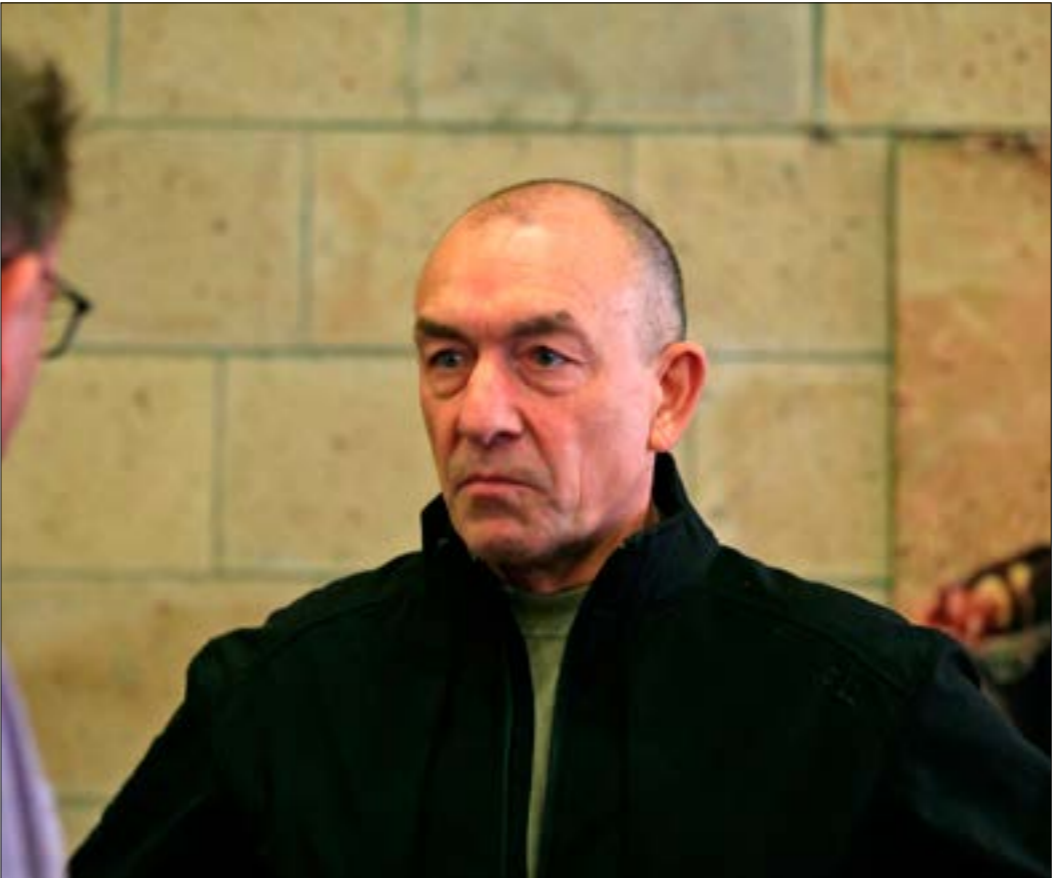
يتوقّع لوليسغارد وضع اللمسات النهائية على الاتفاق الأسبوع المقبل

ما مع بدء لوليسغارد مهماته بدلاً من سلفه الجنرال الهولندي المتقاعد باتريك كاميرت. وفي سياق تغريداته أمس، ردّ الحوثي على تصريحات لوكيل الأمم المتحدة للشؤون الطرفيين، وتنفّذ إعادة الانتشار من الطرفين، وإزالة الحواجز»، مستدرّكاً بـ«أننا» فوجئنا بحوارات سياسية بدل التنفيذ». موقف يمكن قراءته، في انتظار الموقف الرسمي لسلطات صنعاء على أنه إشارة إلى تحوّل