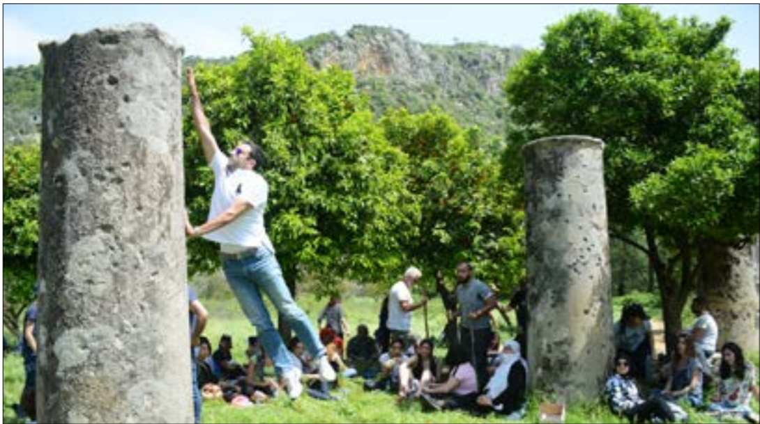
رفضت وزارة الثقافة رسم الآثار ونقلها إلى عفار فصلته بلدية بلدة الميدان لتحويله إلى متحف (علي حاشيو)