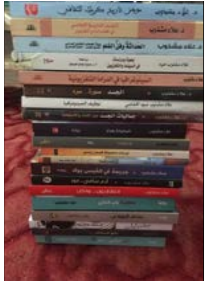
واحد اعتراضاً على الاغتيال.