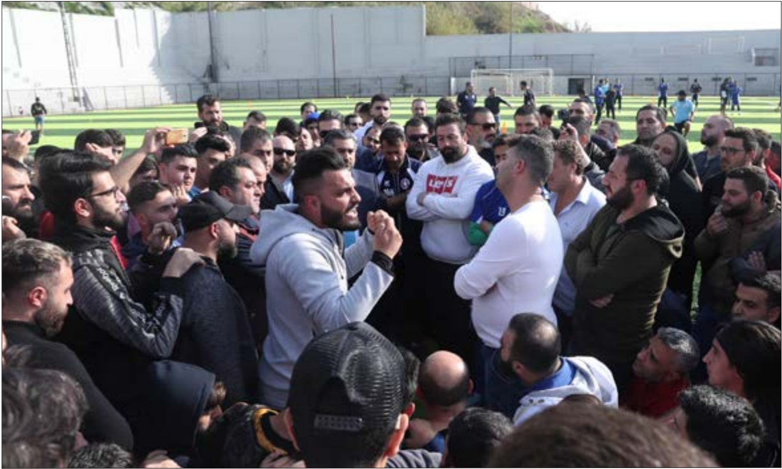
تحفم الجمهور في ارض ملعب المنارة لملعبة الإدارة (عدنان الحاج علي)

لا علاقة للجمهور بهذا الموضوع»، حجيج الذي وجه كلاماً قاسياً إلى اللاعبين بعد التدريب يوم الأربعاء، علّق على موضوع مستحقات اللاعبين، وخصوصاً المكافآت بالقول: «طبعاً. أنا لست ضد اللاعبين ومع الرئيس. أنا مع كل شيء يمثل النادي. أنا مع اللاعبين واحميهم من أنفسهم ومن الجمهور والإعلام والإدارة. وأودّ أن اتكلّم في موضوع المكافآت. هل هي فرض واجب على الإدارة؟ هي هديّة يعود للنادي منحها أو عدم منحها. يقال إن بعض اللاعبين سيرحلون عن النادي في نهاية الموسم، وإنهم فقدوا الحافز للفوز، لعدم وجود مكافآت. أقول لهؤلاء: ارحلوا من الآن، ولا تنتظروا حتى نهاية الموسم. واتحدى أي لاعب أن يملك الجرأة ويقول على العلن إنه لا يلعب كما يجب لهذا السبب. لا يمزّ علينا عقليّة كهذه أو لاعبون يتحدّثون بهذا المنطق»، يقول حجيج في حديثه مع الأخبار.