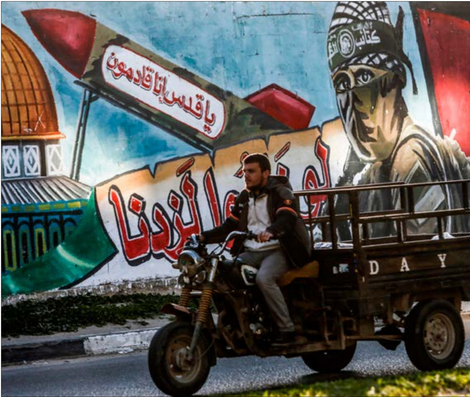
صفتة تك أيبب اعترت تقهيرا لقواعد الاشتباك بين المقاومة والاحتلال

مهدت لذلك بنشر منظومة القبة الحديدية في محيط تل أيبب في شهر كانون الثاني/ يناير الماضي. مساء امس، وخلال اجتماع الوفد المصري مع قيادة «حماس» في غزة، دوت صفارات الإنذار للمرة الأولى منذ العدوان الإسرائيلي على قطاع غزة في عام 2014، في منطقة تل أيبب. جيش العدو اعترف بأنه