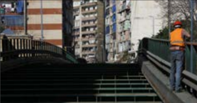
المطلوب سياسة للثق لا تأهيل جسور يفترض إزالتها (مروان طحطح)