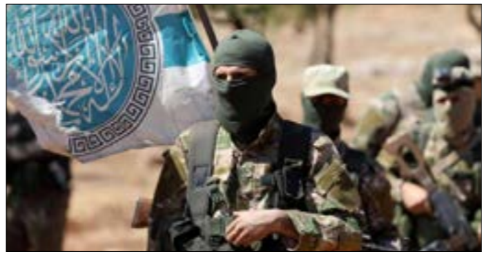
تراهت أنقرة على «براغماتية» زعيم «تحرير الشام، أبو محمد الجولاني

بين عام 2011 واليوم، تبدّلت أولويات أنقرة غير مرة على وقع تطورات الحدث السوري وتغيّر موازين القوى. في العام الأول، بدا أن كل الضغوط التركية تلوح إلى تحقيق هدف أساسي هو انتزاع «مكتسبات سياسية» لصالح جماعة «الإخوان المسلمين». سرعان ما اتسعت الطموحات إلى حدّ التفكير بإمكان «إسقاط النظام» والتمهيد لانفراد «الجماعة» بالحكم. في أيلول 2012،