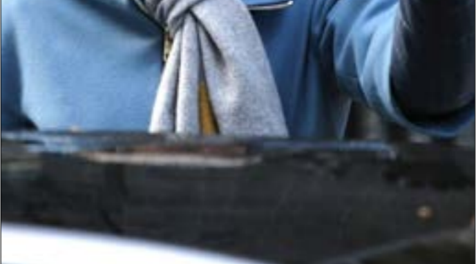
شهد البرلمان التصويت على عدة تعديلات منسلة في الحصول على الأغلبية (أ ف ب)

النواب صوّتوا، أيضاً، على إجراء استفتاء شعبي ثان على الخروج، في تعديل على المقترح الحكومي، لكنه لم يحصل على الدعم البرلماني. فقد هُزم بفارق 249 صوتاً، بعدما صوّت ضده 334 مقابل 85 نائباً. وكان «العمال» قد حدّث نوابه على الإمتناع عن التصويت على هذا التعديل، وقد شرح وزير «بريكست» في حكومة الظل، كير ستارمر، موقف حزبه في المباحثات البرلمانية قبيل التصويت، قائلاً إن «العمال» يعترض على توقيت طرح الأمر للتصويت، وليس على مبدئه». كذلك، شهد البرلمان، التصويت على مفاوضات أخرى فشلت جميعها في الحصول على الأغلبية البرلمانية. أوروبياً، قال كبير مفاوضي الاتحاد الأوروبي في محادثات «بريكست»