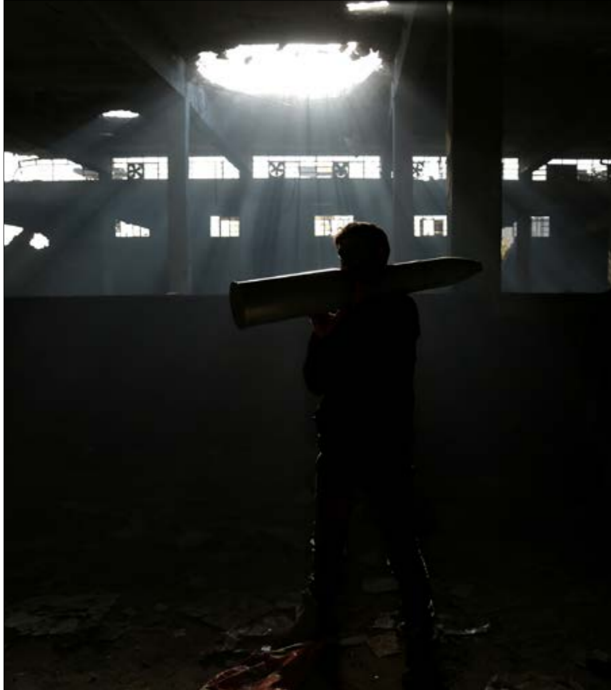
يحتفظ احتمال التفجير العسكري بحظوظ أقل على خطوط التماس بين الجيش السوري ومناطق الاحتلال التركي (أضرب)

وتصلح كل المعطيات المذكورة للاستثمار لاحقاً في صورة حرب عسكرية، أو فرض «امر واقع» يجعل كل حديث عن «وحدة سوريا» فعذاً للاستهلاك الإعلامي فحسب. ويمكن تمييز ثلاث جغرافيات قابلة للتحويل إلى مسرح عسكري نشط في المراحل التالية من الحرب، على رأسها مثلث «إدلب، حلب، حماة» الذي تهيمن عليه «الرايات السود». ويحفظ احتمال التفجير العسكري بحظوظ أقل على خطوط التماس بين الجيش السوري ومناطق الاحتلال التركي (ريف حلب الشمالي)، كما على خطوط التماس بين الجيش وقوات سوريا الديمقراطية شرق الفرات. كذلك تحضّر احتمالات التصعيد امتداد المسافة بين منبج وعين ديار. ويرغم خروج بعض اللاعبين من خريطة الصراع على شمال سوريا وشرقها، فإن المشهد اليوم يُذكر بما كانت عليه الأمور قبل أكثر من أربعة أعوام (راجع «الأخبار» 4 كانون الأول 2015). ولا يغيب جنوب البلاد عن الاحتمالات المفتوحة، في ظلّ عدم استقرار «ببلة المصالحة» في درعا، واستمرار التحديتات «الإمنية» في السويداء، وحضور مخاطر اعتداءات الكيان الإسرائيلي دائماً.