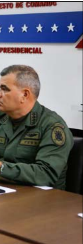
أعلنت مادوره عن لجنة تقصي حقائق تضم خبراء من روسيا والصين وكوبا وإيران

بعد نحو ثلاثة اموام من الاستفتاء الذي أدى إلى «بريكست»، وفيه 15 يوماً على موعد خروج بريطانيا من الاتحاد الأوروبي، وافق مجلس العموم في لندن على تأجيل موعد الخروج في ثلاثة أشهر، الأمر الذي يعطي «نفساً» لتيريزا ماي، من أجل إعادة التفاوض على الانساق الذي وقعته مع بروكسل بعد ثلاثة أيام «مراثونية» مرّت على بريطانيا، وافق مجلس العموم، أخيراً، على تأجيل الخروج من الاتحاد الأوروبي، إلى أواخر حزيران/يونيو المقبل، بعدما رفض بغالبية ساحقة، مطلب حزب «العمال» تنظيم استفتاء ثان على «الخروج» وفي تصويت كانت نتيجته متوقّعة، وسط غياب حول بدلية تضمن خروجاً منظماً للندن، وافق المشرّعون البريطانيون على تأجيل موعد «بريكست»، حتى 30 حزيران/أوروبي في محادثات «بريكست»