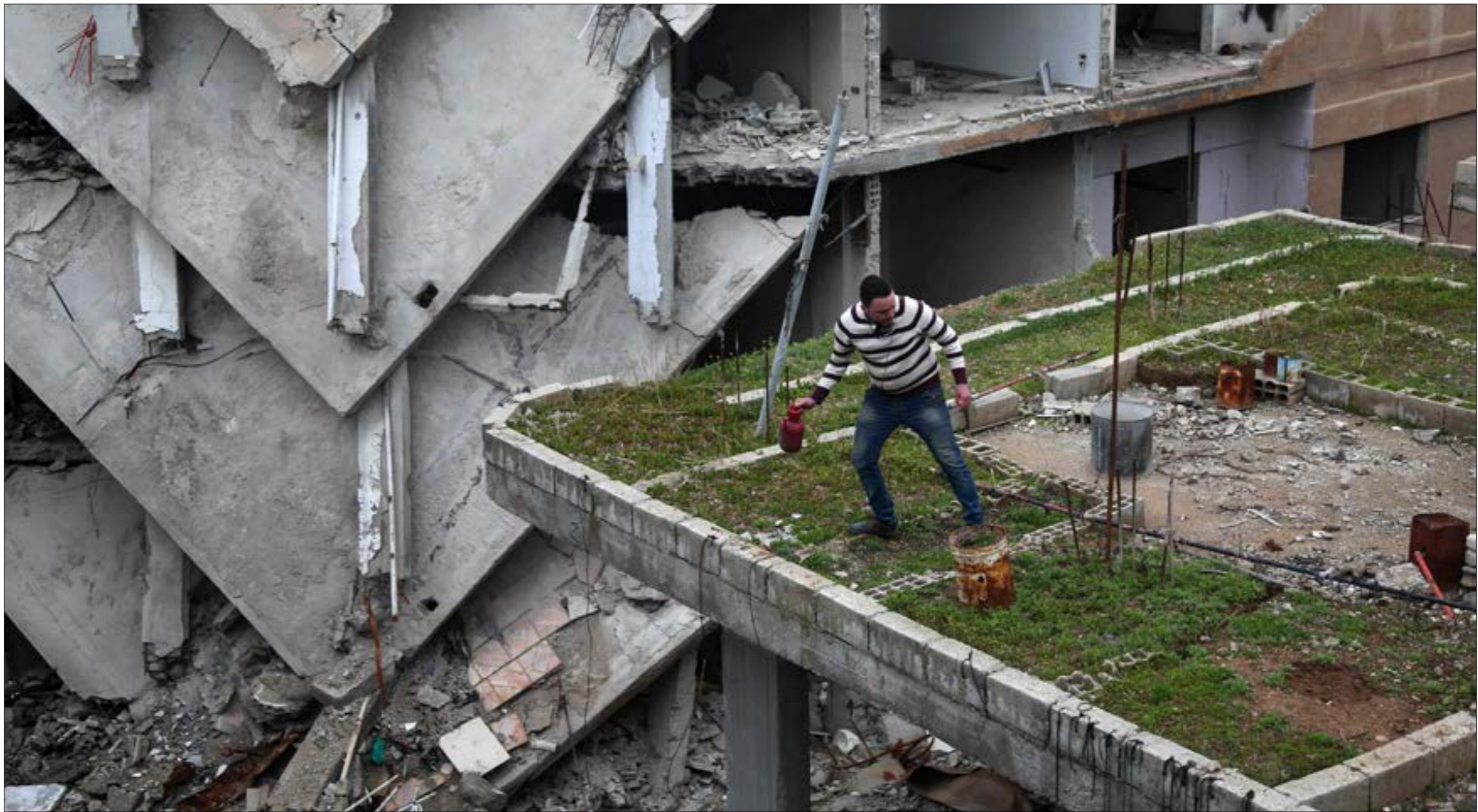
فدّرت «اسكوا» أضرار المباني والبنية التحتية بأكثر من 90 مليار دولار خلال السنوات الخمس الأولى (أ.ف.ب)

الخبير المتعاقد مع الأمم المتحدة، فإن «بعض المناطق المحيطة بالمدن الرئيسية ستكون مفيدة للشركات على تحمل تلك التكلفة، خاصةً أن إعادة بناء المنازل وتوزيعها لن تكون مجانياً في مرحلة إعادة الإعمار، والعامل الثاني يتمثل في توافر التمويل اللازم لبناء المرافق على السكن من جهة، وإلى نزاعات على الملكيات العقارية لأسباب عدة، مستنداً في ذلك إلى تجربته مع الأمم المتحدة عام 2014 في مدينة عدن اليمينية لدراسة الأراضي التي صودرت بعد حرب عام 1994؛ إذ تبين بعد عشرين سنة