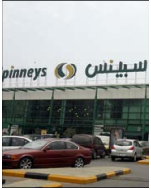
بعض المصروفين تلقوا توبيهات بصلهم اخيراً (هيلم الموسوي)

بعد ثمانية أشهر على صرفها نحو خمسين موظفاً، اقدمت إدارة مجموعة «سبينيس»، أخيراً، على صرف أكثر من عشرين موظفاً جديداً. وفيما كانت ذريعة الصرف سابقاً «إعادة الهيكلة» بعد انتقال ملكية المجموعة من شركة «إبراج كابتال» إلى عدد من المستثمرين اللبنانيين في كانون الثاني 2018، لم تُعرف أسباب الصرف هذه المرة، ولم تُبلِّغ غالبية المصروفين بأسباب إنهاء خدمتهم، وفق ما أبلغ عدد منهم «الأخبار». مصادر المصروفين قالت إنَّ الإدارة طلبت من بعضهم تقديم استقالاتهم مقابل حصولهم على تعويضات، فيما أجبرت البعض الآخر على أخذ إجازاتهم السنوية «تخصيرا للصرف في ما