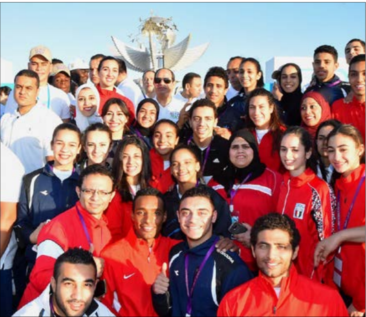
حوّل السيسي الحوار مع الشباب إلى زهرة، تارة في البحر الأحمر وتارة على النيل (أبي أيه)

إلى التوقف بناءً على التحذيرات. بينما تصر كل هؤلاء، كان السيسي وزوجته يشاركان في أجواء احتفالية مع شبان يفترض أنهم جاؤوا من غالبية البلاد العربية والأفريقية للمشاركة في الملتقى، مع قلة من الشبان المصريين المختارين بعناية فائقة من الأجهزة الأمنية وشباب «البرنامج الرئاسي»، إلى درجة أن عدسات الكاميرات التخلّط شباناً من الأمن وهم يرقصون ويرفعون الأعلام الذي أيدهم هاتف التريا الذي يتواصلون به لتأمين مكان انعقاد الحفل.