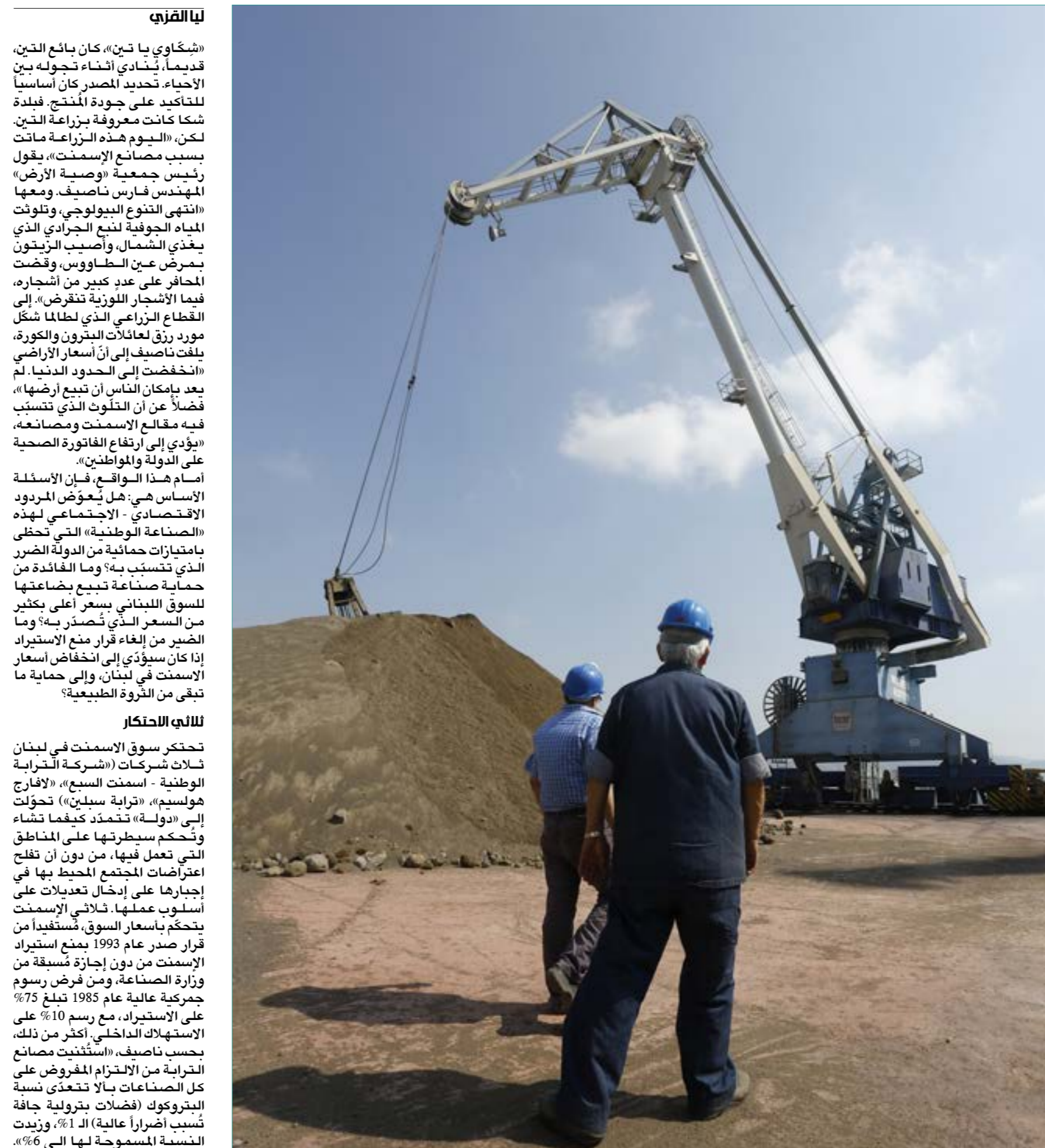
إلغاء الدعم سيؤدي إلى انخفاض الأسعار وحماية ما تبقى من الليرة الطبيعية (مروان حطّط)