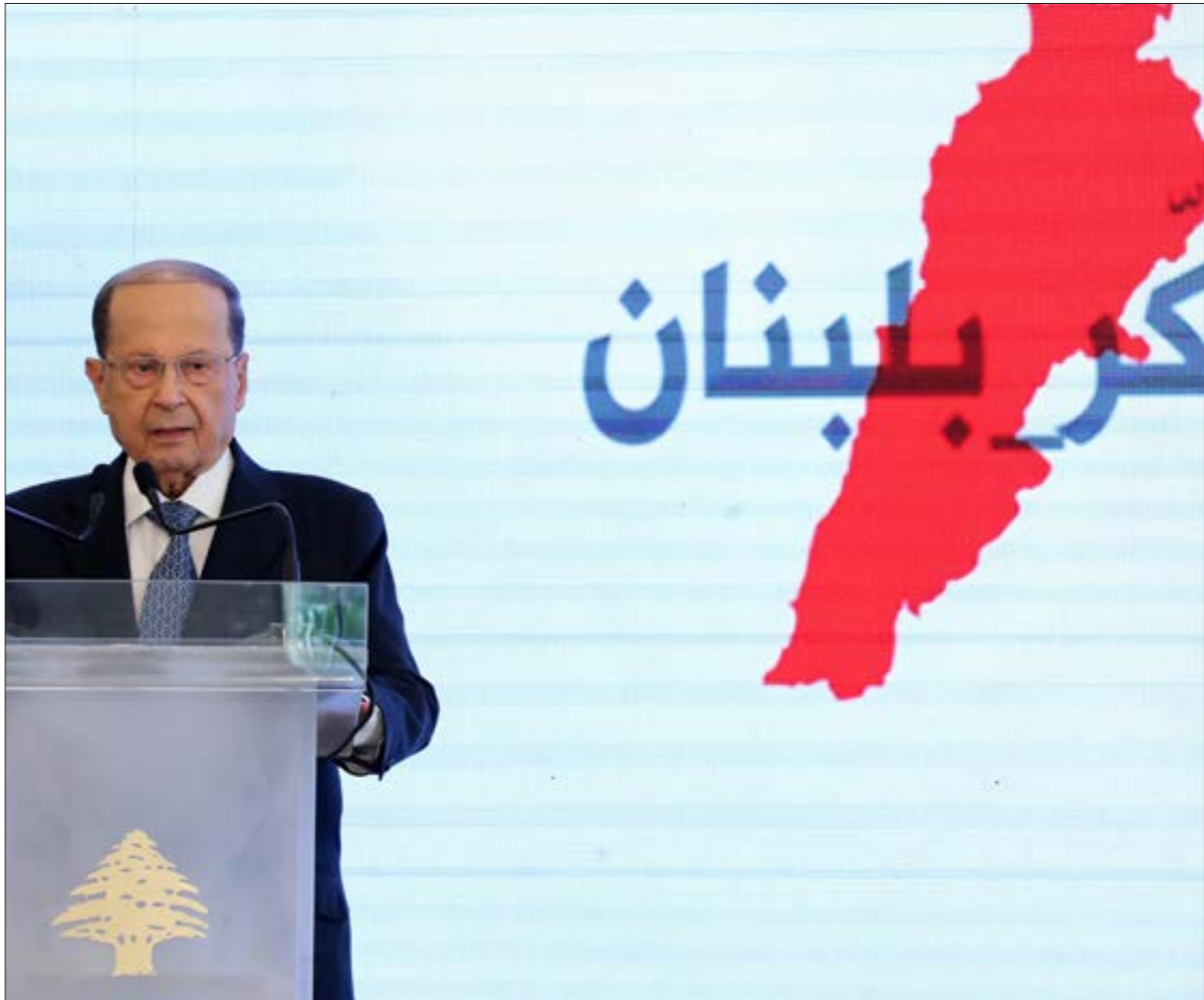
الرئيس عون يجيب عن سؤال الجيمع أثناء حفلة لاحتفاء (حالاته ونهرا)

وباسيل»، فيما أكدت أوساط سياسية بارزة «تخّبه المعنيين إلى ضرورة عدم الانجرار إلى سقف لا يمكن العودة عنه، خاصة أن البلاد تمر في مرحلة دقيقة جداً». ووُزِع أمس جدول أعمال جلسة مجلس الوزراء، وهو من 54 بنداً، منها 19 بنداً يطلب قبول هبات، و17 بنداً لسفر وفود إلى الخارج؛ أما البنود المخططة له من قبل مجلس الوزراء المسودة «سياسة الإدارة المتكاملة لقطاع محافى الرمل والأترية والمقالع والكسارات، بما فيها مقالع وكسارات شركات الترابية، واتخاذ القرار المناسب بشأن الاستثمار المرخص أو غير المرخص من قبل المرجع الصالح، أو المنتهي المدة المخططة له من قبل مجلس الوزراء وغيره»، وفيما لم تتمكّن «الأخبار» من الاطلاع على مضمون البند، إلا أن الصيغة التي ورد فيها عنوانه تشير إلى احتمال وجود نية لدى وزارة البيئة ومجلس الوزراء بتعميد المخالفات في المقالع والكسارات، مع كل ما فيها من مخاطر على البيئة. وإضافة إلى قبول استقالة زياد حايك من منصب الأمين العام للمجلس الأعلى للخصخصة، يضم الجدول مشروع قانون الموارد البترولية على البير، وصرّف الاعتمادات اللازمة لإجراء الانتخابات النيابية الفرعية في طرابلس، فضلاً عن تعيين أعضاء المجلس العسكري في الجيش، وبحسب مصادر وزارية، فإن الأسماء المقترحة للتعيين لا تزال هي نفسها التي أدرجت على جدول أعمال جلسة مجلس الوزراء الأخيرة، وطلب سحبها بسبب اعتراض رئيس الجمهورية العماد ميشال عون على اقتراح تعيين العميد الركن محمد الأسمر أميناً لسر المجلس العسكري وأميناً عاماً للمجلس الأعلى للدفاع. وبحسب المصادر، فإن الحريري وضع فينبو على تعيين العميد مبالد إسحق مفتشاً عاماً للجيش، جرى إسقاط الفيتوين معاً، فأعيد وضع البند نفسه على جدول الأعمال. ويضم الاقتراح إلى إسحق والأسمر تعيين