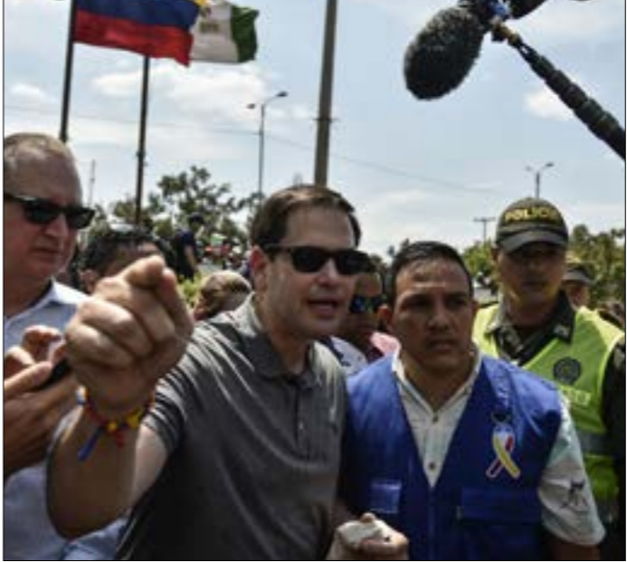
خلال زيارة روبيو للحدود الفنزويلية ـ الكولومبية الشهر الماضي

إليه في خضمّ المواجهة بشأن إدخال المساعدات الإنسانية، بالنقول إن هذه المساعدات استمرّت» إلى فنزويلا مع تعاونه أو دونه، بل ستمنّ عبر الطريق السلمي أو الدموي وسط كل ذلك، تظهر لروبيو علاقة مُهممة بالانقلابي خوان غوايدو. وإن كان لا يمكنه تذكّر عدد المرات التي التقاه خلالها، وإنما قد يصلح القول إن غوايدو رحله في فنزويلا، قبل أن يكون رجل واشنطن عموماً.