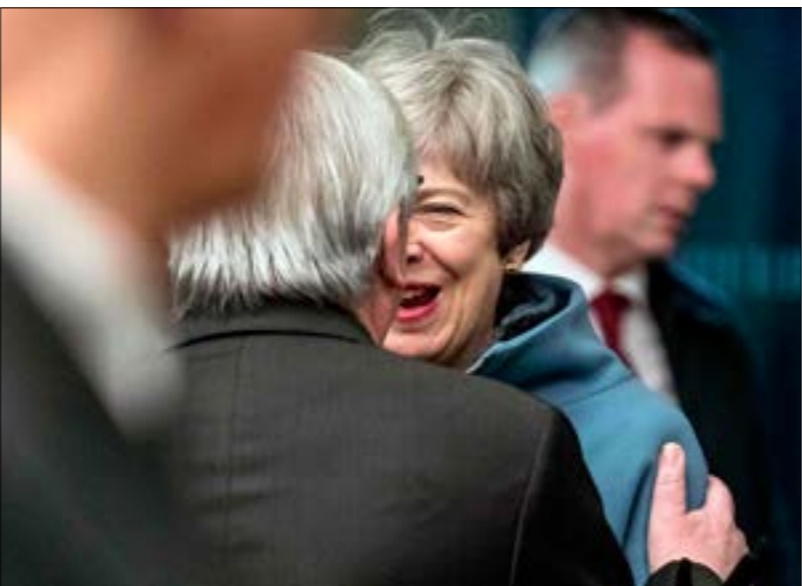
تحاول نيريرا ماي استسلام عامل الزمن لمصلحتها على الصعيد البريطاني والأوروبي

بداً بحليفها في مجلس العموم الحزب «الديموقراطي الودودي» الإيرلندي. وقال المتحدث باسم رئيسة الوزراء أمس: «أجرت ماي مباحثات مع عدد من البرلمانيين في نهاية الأسبوع، وجرت مباحثات مع الحزب الديموقراطي الودودي، وهي مستمرة اليوم (أمس)». هذه الجبارة أكدها أيضاً وزير الخارجية