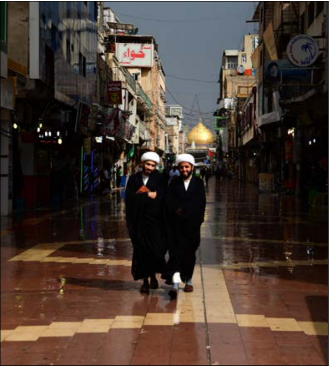
انس عدد من قادة «الدعوة» التاريخيين، خرج، تمكك على تقرب الوجوه

تشبي علاقة المالكي ـ العبادي بانها وصلت إلى طريق مسدود. لكن هذا دقيقة للواقع، فهناك أسس وممارسات أفرزت هذا الواقع، وقد تتكرر في المستقبل. أبرزها الدأؤنا السياسي الحزبي، إلى حد أن مشكلة صغيرة وقع فيها الحزب (انتقال السلطة من المالكي إلى العبادي في آب/ أغسطس 2014) أتت إلى كل هذه النتائج. والنصر» في تحالف ثنائي واحد. صحيحٌ أن هناك مساعي جدية لخطوة مماثلة، لكنّ «طبيعة الوضع فـالحراك يحاول أن يضع أسساً لبناء حزب يحاكي المدارس الحديثة