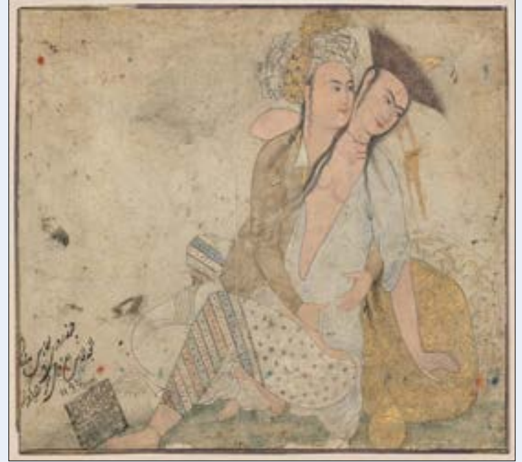
لوحة من الحقبه الصفوية - إيران (1660)

«الحب بين العذري والجري»: قراءات حرة: 20:00 حتى 22:00 مساءً غد السبت - مكتبة بيروت العامة في مونو - للاستعلام: 01/203026