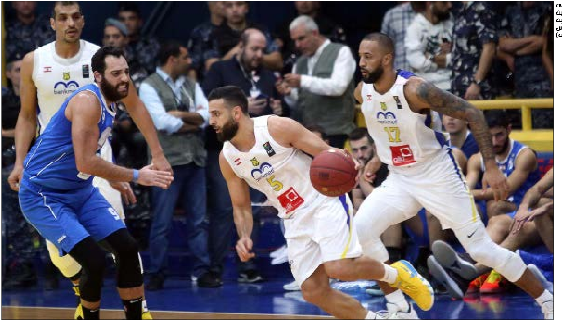
المستحم مفارق، بيت الضربت (سركيس بريسينا)