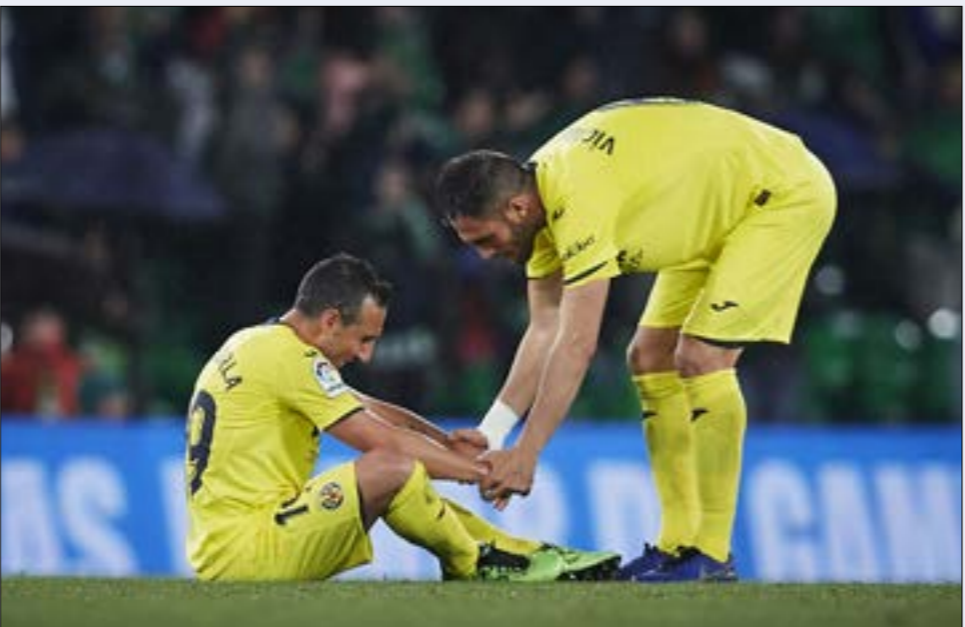
اهتزت شبكته فياريال 45 مرة مناسبة هذا الموسم (الأسف)

المعروف بـ«الفواصات الصُفر» يحتل المركز السابع عشر في جدول الترتيب، ويات قريباً من الهبوط إلى الدرجة الثانية. نتائج سلبية. أهداف تدخل مرمى الحارس الإسباني سيرخيو أسينخو في كثير من المناسبات وفي غالبية المباريات. أرقام سيئة تأتي من فريق اعتاد المتابعون مشاهدته، على الأقل، بين العشرة الأوائل في الدوري، فياريال، من الدرجة الأولى من الليغا (1998-1999، 2011-2012). كلها أرقام ستعطي في النهاية إسبانيا التي تخرّج لاعبين أصحاب مستوى عال. يملك النادي الإسباني كُشافين أذكاء، ومدرسة كروية تضم عدداً كبيراً من المواهب. فياريال اليوم، أصبح قاب قوسين أو أدنى من الهبوط إلى الدرجة الثانية، وهذا ما قد يمثل «الكارثة». مع خسارة الفريق الأخيرة أمام ريال بيتيس ضمن الجولة الـ31 من الليغا، يكون فريق «الفواصات الصُفر» قد سجّل في كتب الليغا أسوأ نتائج له في تاريخه، وذلك مع تبقي سبع جولات على نهاية الدوري. حصل النادي 30 نقطة من 31 مباراة، وكان قد وصل إلى المركز ما قبل الأخير في الدوري، تفاصيل موسم فياريال هي كالآتي: 6 انتصارات، 12 تعادلاً و13 هزيمة. ستة انتصارات فقط، هو رقم يصعب تصديقه، خصوصاً أن صاحب هذا الرقم هو أحد الفرق التاريخية في الدوري الإسباني. الأرقام السلبية لم تنته بعد، حيث سجّل زملاء سانتي كازورلا 39 هدفاً هذا الموسم في الدوري، بينما اهتزت شبكاتهم في