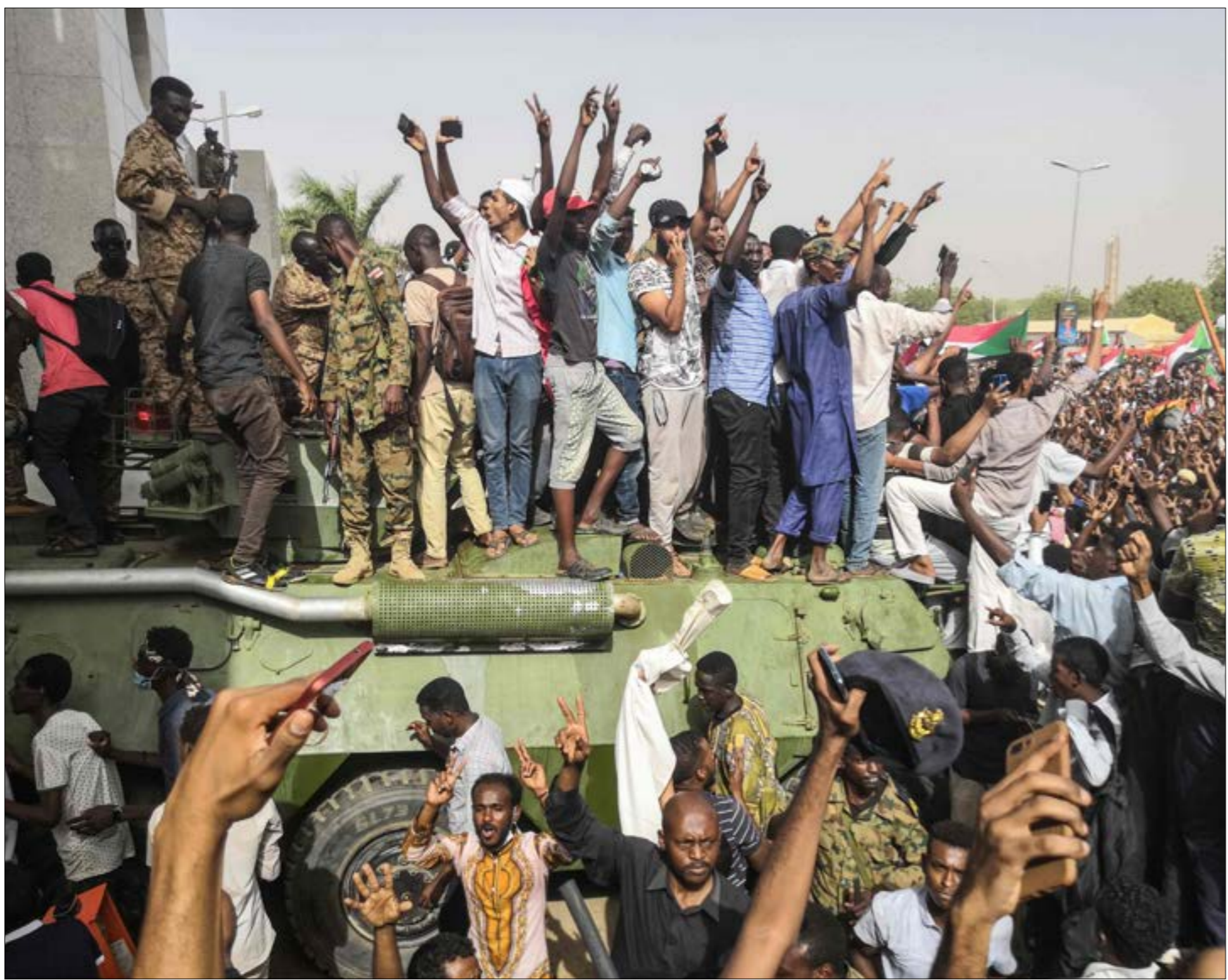
لجنة أطباء السودان؛ 13 قبلاً برصاص قوات النظام خلال احتجاجات (أف ب)

بينما أبدى الجيش دعافاً عن المحتجين أمام مقارّة الانقلاب، في مواجهة قوات الأمن والشرطة التي استخسرست في محاولة فض الأمانة للثورة».