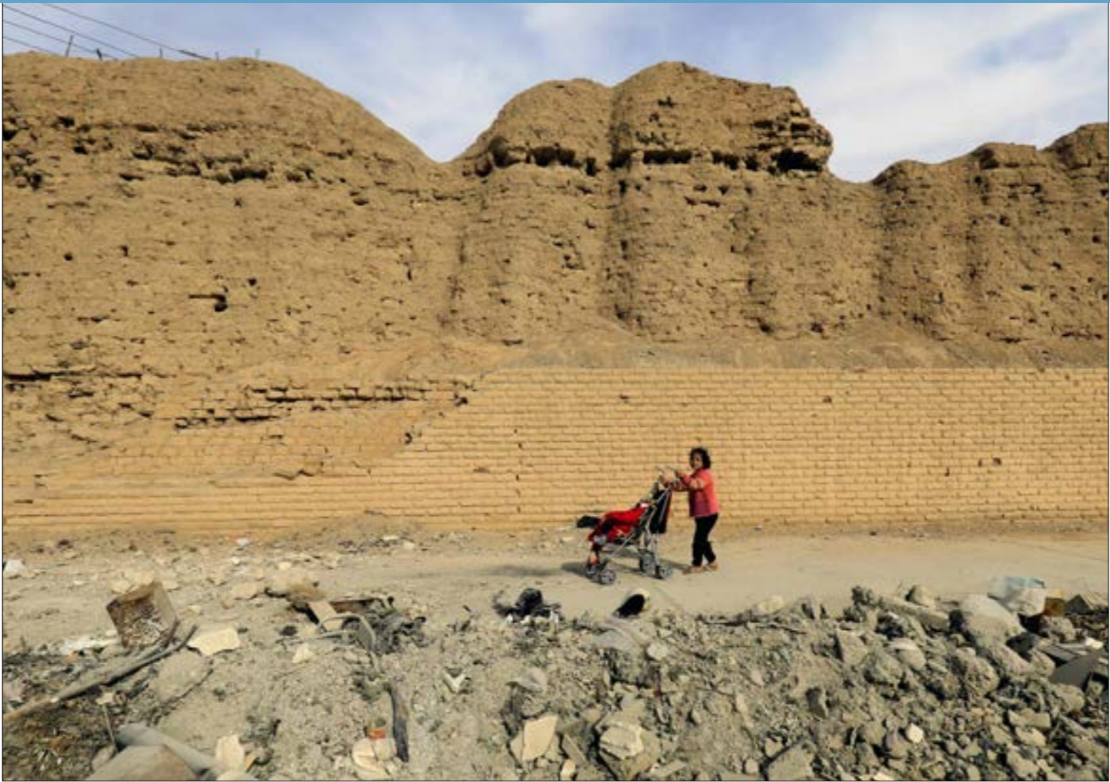
يخفف القانون الحكم عن ام الطفل إذا تلكت عن طفلها مكرهة او لصون شرفها، (ا ف ب)

الأب، ذكر أنه قام بذلك بسبب «سوء حالته المادية وعدم قدرته على تامين علاج وطعام لها»، وضجت وسائل الإعلام التي تناقلت خبر الطفلة باعتراقات الأب، إلى درجة وصلت إلى حدّ اعتبار الأوضاع المادية سبباً مباشراً لقيام البعض