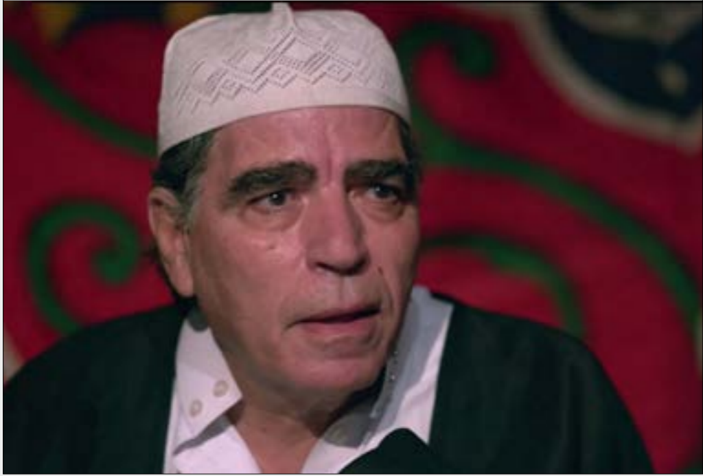
رحل عن عمر يناهز 74 عاماً، تاركاً حواليه 390 عملاً فنياً

عبر صفحات التواصل الاجتماعي، بل كتب «وداعاً سلامة الطفشان» (شخصيته في فيلم «شمس الزناتي» . 1991) أو «علي الزهار» (شخصيته في فيلم «اللعب مع الكبار» . 1991) وغيرهما من الشخصيات الأخرى التي تنوعت ما بين الكوميدي والتراجيدي. ما أغضب الجندي في السنوات الأخيرة هو «قلة التقدير» على حدّ قوله، سواء من المهرجانات الفنية الرسمية التي اتهمها بالفساد لأنها لم ترَ في ما قدمه ما يستحق التكريم، أو التعامل داخل الوسط الفني الذي دفعه إلى إعلان الاعتزال بعد نهاية شهر رمضان 2017 قبل أن يقنعه أصدقاؤه بالعودة إلى الأضواء.