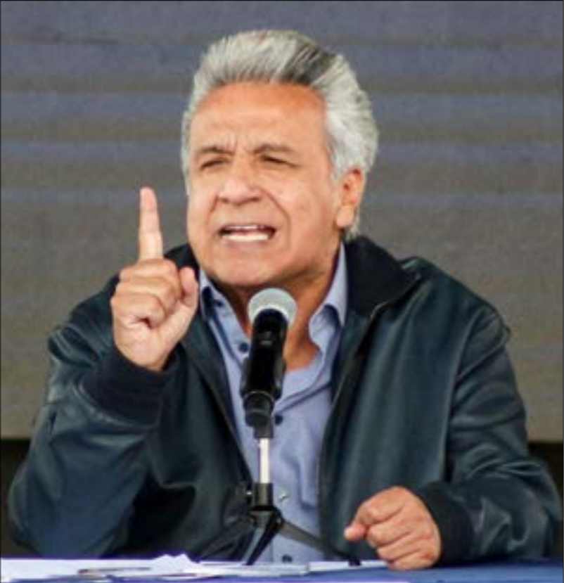
بز الرئيس مورينو تسليم اسانج بانّ الأخير «خرف الاتفاقات الدولية، (ف ب)

الشرطة البريطانية بلباس مدني إلى مقرّ سفارة الإكوادور لدى لندن، لاعتقال أسانج الذي كان يتحصّن هناك منذ 2012. أدانته محكمة وستمنستر بـ«انتهاك شروط الإقامة البريطانية» بطلبه حقّ اللجوء لدى سفارة الإكوادور، وهي «جريمة» يعاقب عليها بالسجن عاماً واحداً، لكن سرّية، وأوصحت مذكرة الاتهام أنه بعد قبول أسانج مساعدة مانينغ