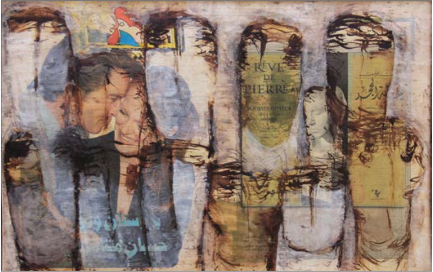
من دوت عنوان (مواد مختلفة على كanvas، 46 × 60 سنتيم - 2014)