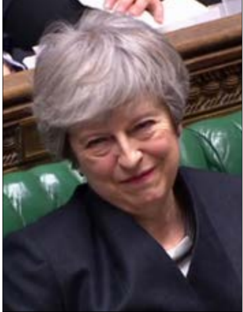
اكدت هاي إمكانية الخروج قبل انتخابات أوروبا إذا صدق النواب على الاتفاق الانسحاب

في علم الإدارة والأداء الحزبي، بدأ من التنظيم وحشد الطاقات، وصولاً إلى ما يجعلنا فعالين في الحياة السياسية، والتأثير في المجتمع و ثقافته ووعيه».