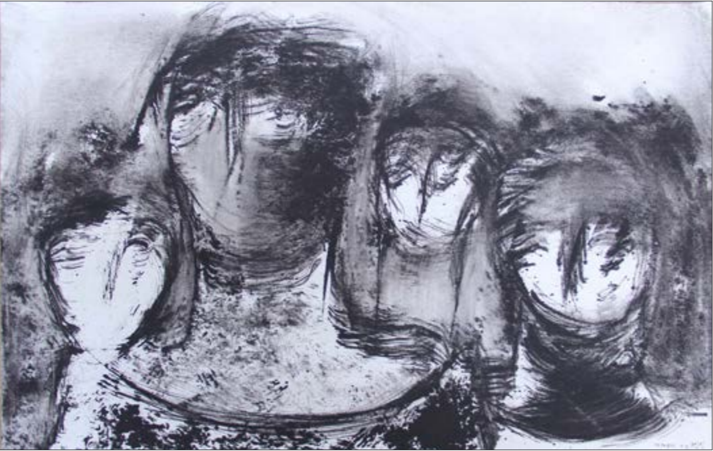
من دوت عنوان (مواد مختلفة على ورق، 56 × 76 سنتيم - 2013)

عند هذا المنعطف، سينخرط بمغامرة جديدة، هي رسم البورتريه، هذه المغامرة التي سترافق تجربته إلى النهاية بتنوعيات مختلفة. وجوه تبدو للوهلة الأولى، متماثلة، لكنّ فحصاً دقيقاً لتعبيريته التشخيصية، سيضيء مواقع الاختلاف بين عمل