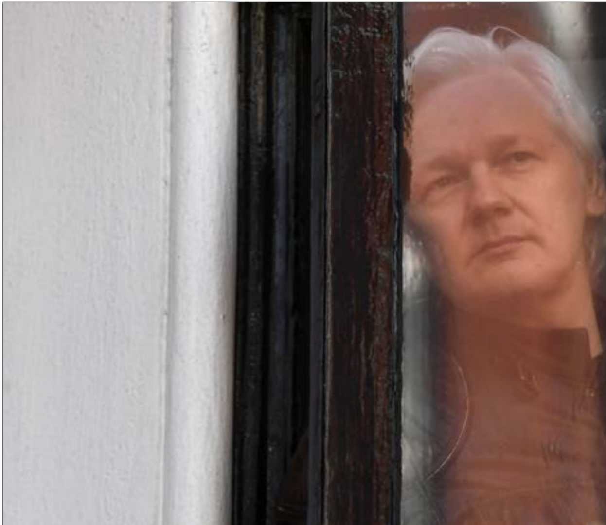
نريد واشنطن، بإذلال اسانج وربما قتلته لاحقاً، إيلام كل «اسانج محتلم» أن يها طويلة (ف ب)

هو في أوروبا، عبر تليفك تهم له بالاعتداء الجنسي في السويد، قبل أن تصر طلنا بإسترداده من المملكة الألاف من الوثائق الرسمية المصنّفة سرية، التي تكشف بالتفاصيل العملة الوجهة للإمبراطورية في سلسلة حروبها الظالمة في أفغانستان (90 ألف وثيقة) والعراق (400 ألف وثيقة)، إضافة إلى ربع مليون من بريقات وزارة الخارجية 800 من تقارير سجن غوانتانامو وغيرها. لم يُغفر لجوليان أبدا كشفه هذه الوثائق، رغم ثبوت صحتها قطعياً وخطورة ما جاء فيها للمواطنين الأميركيين قبل مواظني الدول الأخرى. وقد حاولت واشنطن ترتيب مكيدة لاعتقاله، بينما