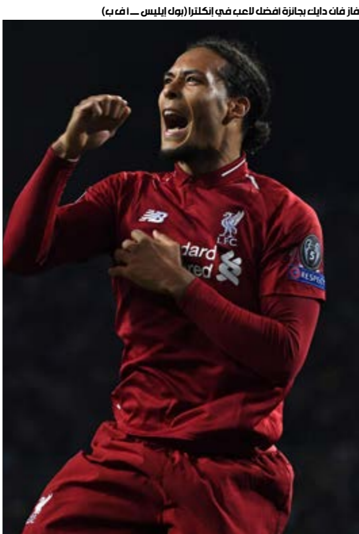
فان دايك بجائزة افضل لاعب في إنكلترا

كبير في المباراة، فالرياضي دخل المباراة الثانية والرغبة ظاهرة على لاعبيه بتحقيق الفوز، وهو ما حصل الرياضي يمتلك الحافز اليوم، وخاصة أنه إذا فاز على أرض الشياح فيسكون قد خطا خطوة كبيرة نحو اللقب، ومن جهته يمتلك بيروت الرغبة كونه بريد الحفاظ على عامل الأرض. من أجل جر الرياضي إلى مباراة رابعة في المباراة، يكون فيها صاحب الأرض تحت الضغط.