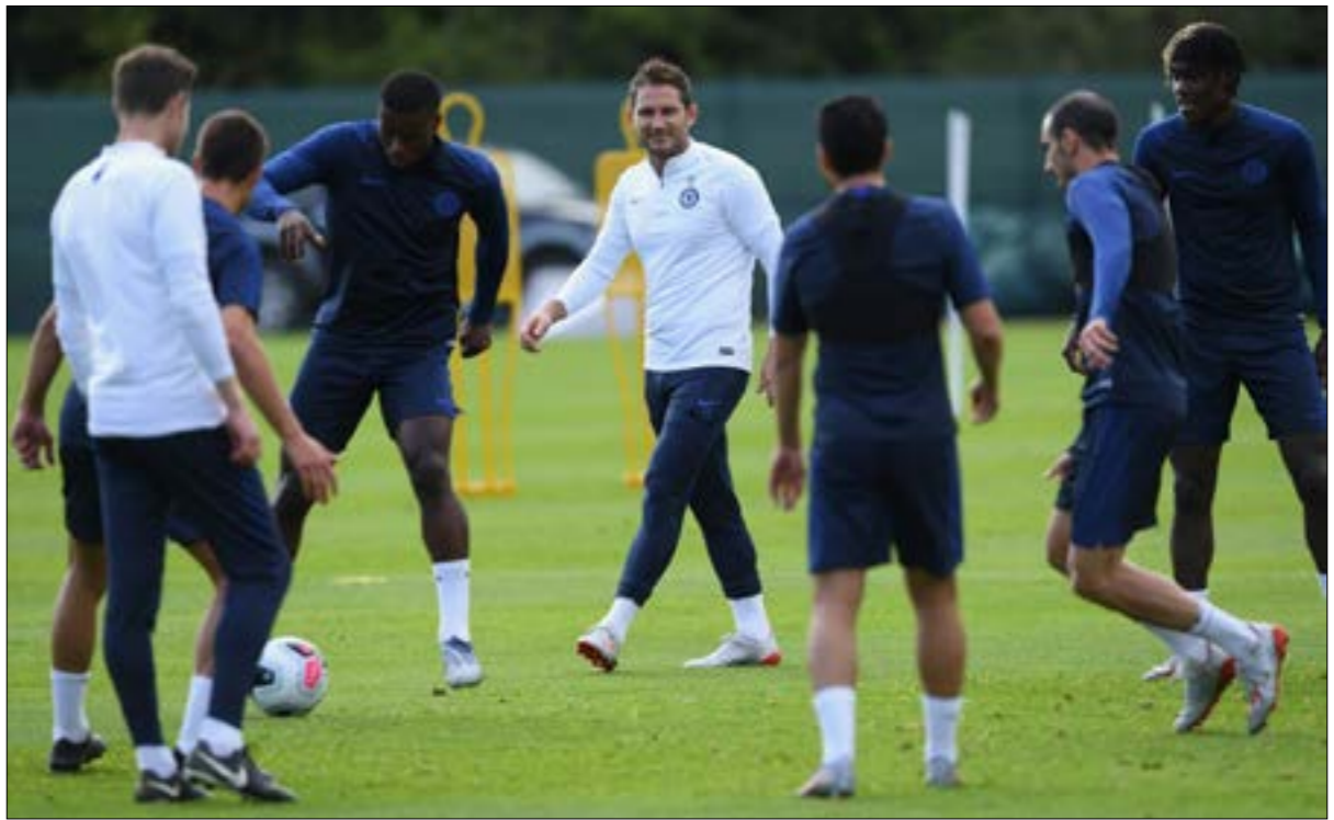
سيرتعد لامبارد على لاعبي الأكاديمية

رغم تحقيقه لقب الدوري الأوروبي في موسمهُ الأول مع تشيلسي، عاد المدرب الإيطالي ماوريسيو ساري إلى موطنه من بوابة يوفنتوس، تاركاً منصبه لأسطورة الفريق اللندني فرانك لامبارد. صيف صعب عاشه تشيلسي، مشاكل عديدة عصفت بالنادي اللندني، واجهتها الإدارة بسياسات أمقت الفريق نظرياً في دائرة المنافسة، أقله بلوغ المقاعد المؤهلة لدوري أبطال أوروبا في