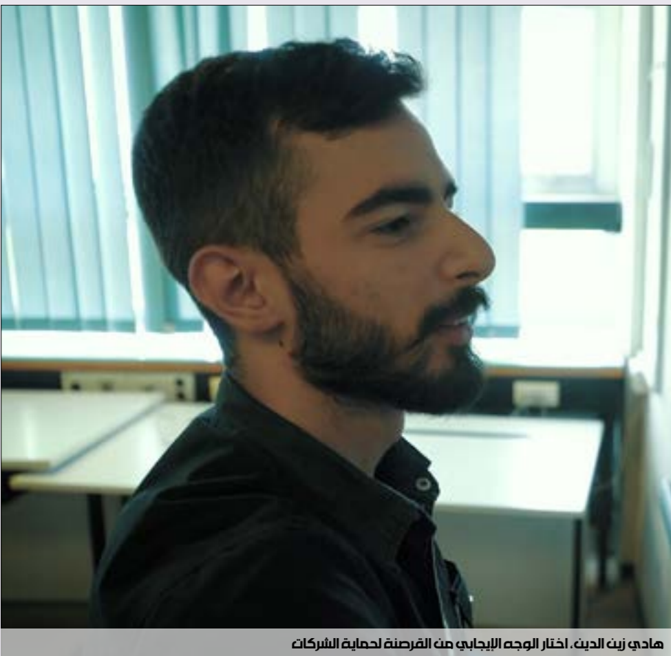
هادي زين الدت، اختار الوجه الإيجابي من الفرصة لحماية الشركات

فيما كانت السفن في الماضي تشكّل مصدر رزق القراصنة، فإن الداتا هي مصدر رزق المقرصنين في يومنا هذا. في الواقع ليس المقرصنون وحدهم من يعتاشون من الداتا. فالاقتصاد العالمي برقته بات مربوطاً بها، وهي تعدّ القوت اليومي للشركات التي تحتاج لها لمعرفة التفاصيل كافة عن المستهلكين، لتتمكن من استهدافهم بالشكل المناسب. من هنا أهمية من يستحوذ عليها ويتحكم بها.