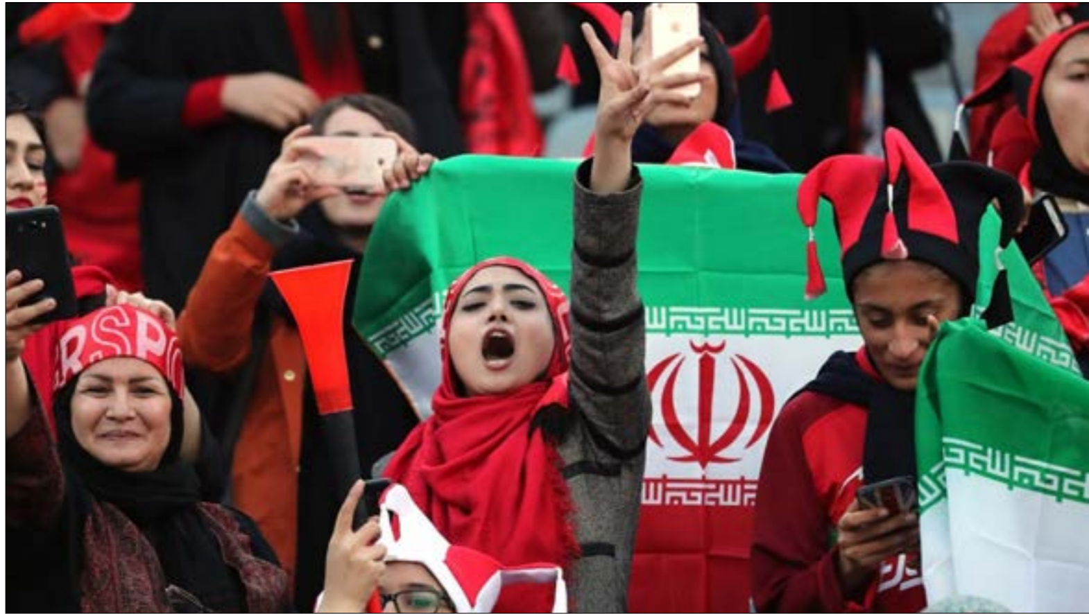
حضرت أعداد من المشجعات نهنئي دوري ابطال اسيا

نقطة جديدة تكسيها المشجعات الإيرانيات في مواجهتهن المستمرة مع اتحاد الكرة الإيراني. الأخير تراجع، وسمح للمشجعات بحضور المباريات الدولية من على المدرجات، بعدما كتّ ممنوعات من الدخول إلى الملاعب، هي خطوة أولى على طريق النضال الطويل