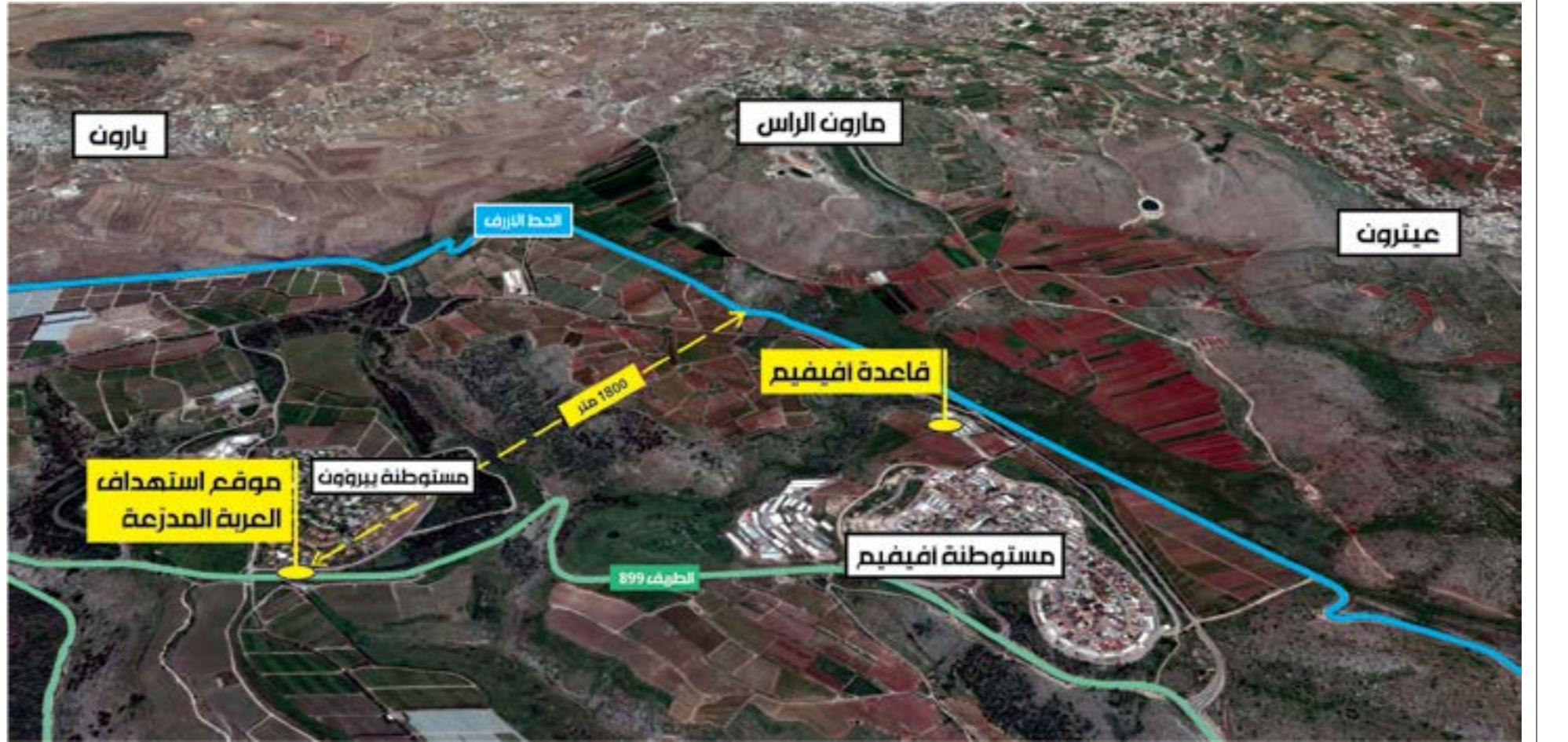
تصميم سنان عيسى

أكد الأمين العام لحزب الله السيد حسن نصر الله أمس أن المقاومة أعادت تثبيت معادلة الردع مع العدو لحماية لبنان. ولأجل ذلك، لن يكون أمام حزب الله أي خط أحمر، في حال حاول العدو مجدداً الاعتداء على لبنان أو التسبب باستشهاد مقاومين في سوريا. في إطار تعليقه على العملية التي نفذتها المقاومة الأحد الماضي باستهداف آلية لجيش الاحتلال عبر الحدود اللبنانية - الفلسطينية قبالة بلدة مارون الراس، توجه نصر الله، في خطاب الليلة الثالثة من عاشوراء، أمس، بالشكر إلى «المقاومين والمجاهدين القادة والأفراد والمسؤولين، لأنهم منذ 8 أيام إلى اليوم كانوا حاضرين وجاهزين على مدار الساعة وفي الميدان، وعلى عتصرين، وما تلاها بعد ساعات قليلة أي عملية المسيرتين المفخختين في الصحابة الجنوبية»، وأضاف «من المعروف أن الأولى سقطت ولم تحقق ما أرسلت من أجله، والثانية التي أرسلت لتتحجز هدفاً محدداً فشلت في تحقيق الهدف الذي جاءت لإنجازه، فكانت عملية فاشلة، ويتم تثبيت المعادلات التي تردع العدو وتحمي البلد»، وشكر الجيش