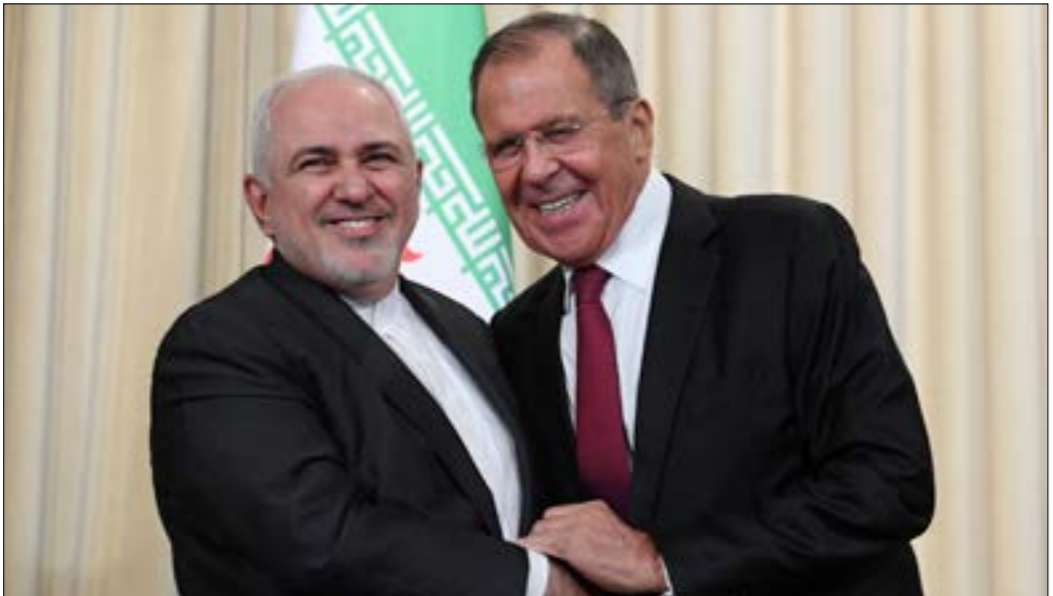
لازفروف: تدعم مبادرة ماكرون مادام الهدف التمسك بالاتفاق مع جون إيفانز واستثناءات (أف ب)