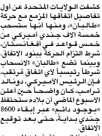
شكّلت «طالبان»، هجوماً على مدينة قندوز للثبّت انها تتفاوض مع موقع قوة