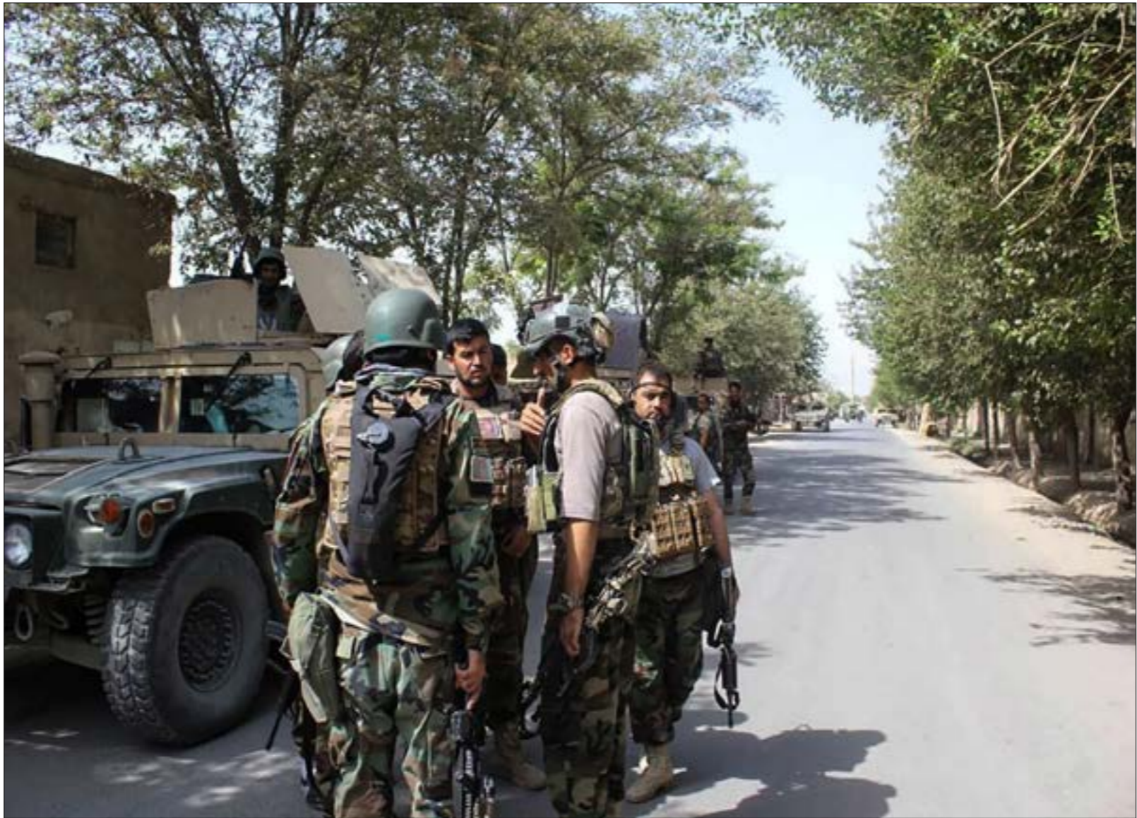
شكّلت «طالبان»، هجوماً على مدينة قندوز للثبّت انها تتفاوض مع موقع قوة

سيجري بموجبه توقيع اتفاق (حيث يقع مطار باغرام) انخفاضاً في العنف، مشدداً على أن عودة «إمارة إسلامية» بالقوة «امر غير مقبول». كما نثبّه إلى أن ترامب سيقرر «مستوى التمثيل» الذي قد أجرى محادثات منفصلة مع