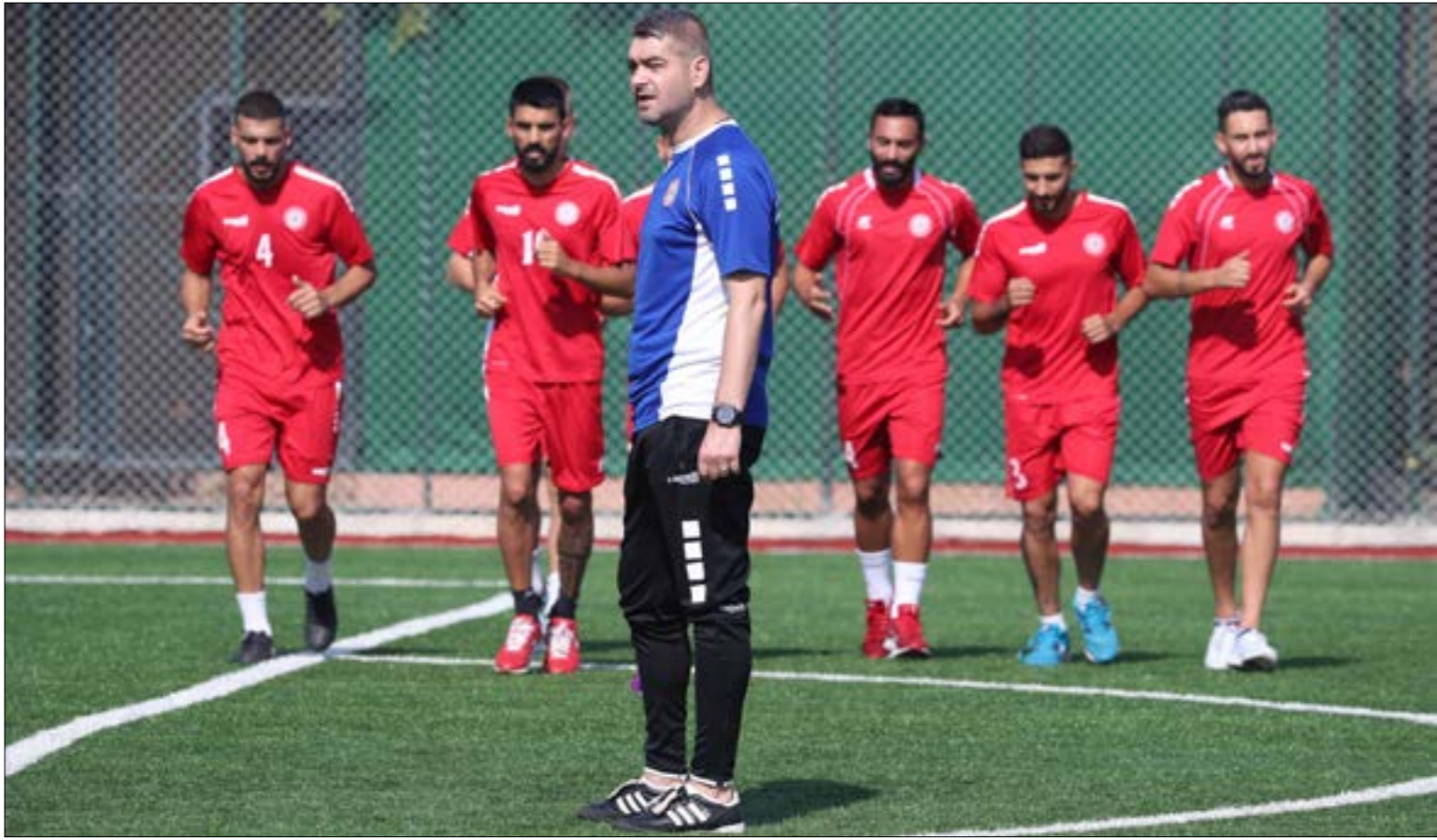
خاض لاعبو المنتخب تعريتهم الأخير على ملعب الانصار