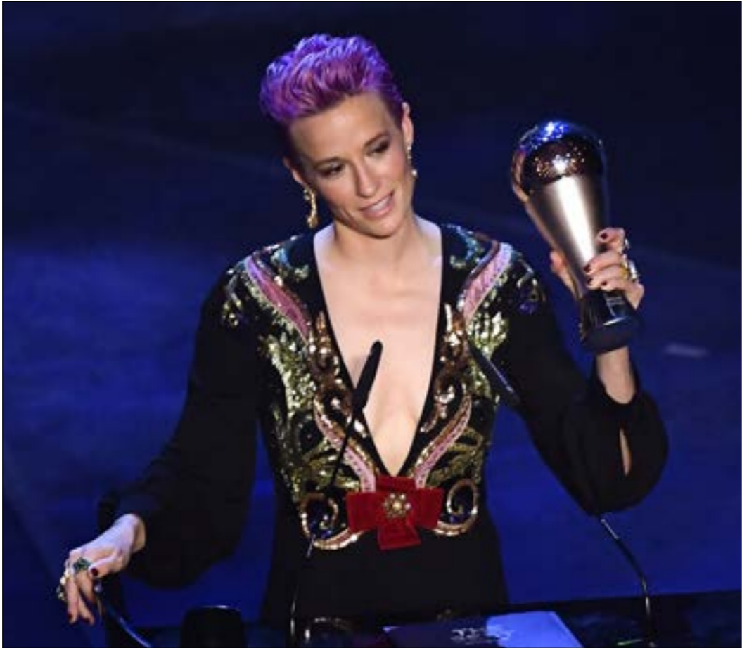
تعرض راينو بدفاعها عن حقوق المرأة والاقليات

بعد عام استثنائي قادت خلاله منتخبها الوطني إلى الفوز بكأس العالم للسيدات الأخيرة على حساب فرنسا (على أرض الأخيرة)، حصدت اللاعبة الأميركية ميغان راينو جائزة أفضل لاعبة في العالم لعام 2019 عن جدارة واستحقاق. في الحفل الذي أقيم مساء أمس الأول الاثنين في مدينة ميلانو الإيطالية، تفوّقت راينو كما كان متوقعاً على مواطنتها الكيس مورغان والانكليزية لوسي برونز اللتين قدمتا كأس عالم مميزة أيضاً. إلا أنّ ميغان التي قادت بلادها إلى اللقب الرابع في تاريخها وتوّجت بأفضل لاعبة وهذافة للبطولة العالمية، خلطت الأضواء بصلابة موقفها ودفاعها عن القضايا التي تؤمن بها، خاصة موضوع الدفاع عن حقوق المرأة والدفاع عن حقوق اللاعبات. للمرة الأولى في مسيرتها ك لاعبة كرة قدم، توّجت راينو أداها اللافت في المونديال الفرنسي للسيدات بحصولها على الجائزة الأعلى. بعد فوزها بالحداء، الذهبي لتصدرها قائمة هدافات البطولة برصيد 6 أهداف، ونيلها الكرة الذهبية كأفضل لاعبة أيضاً، ما هي تضيف لقباً جديداً مستحقاً إلى خزائنها. منذ بضع سنوات خلت لم يكن أحد يتوقع أن تكون أنظار العالم كله متجهة إلى اللاعبة الأميركية، أو أن يتم تكريمها في حفل عالمي من قبل أبرز نجوم اللعبة. كانت مسيرتها الدولية تمرّ بفترة عصيبة بعد عدة مناسفات وتنازع مخيبة للأمل. إلا أنّ اللاعبة البالغة من العمر 34 عاماً، حرصت على العودة بقوة إلى الملعب، لاستعيد مستواها المعهود وتنفّذ على نفسها على صعيد الأداء، والروح التنافسية. من شاهد مبارياتها في كأس العالم يدرك حجم موهبتها ومهاراتها الحاسمة في كل مراوغة أو تسديدة تُقوم بها على المستطيل الأخضر، وهذا