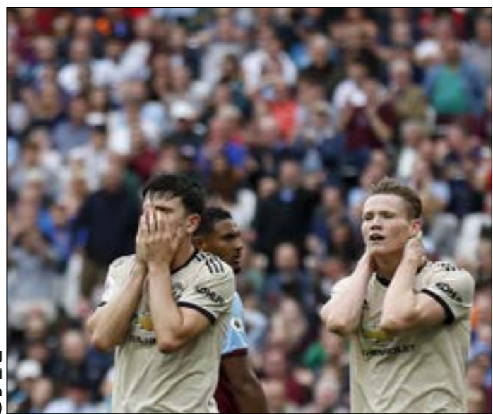
لم يهتف مانشستر إيه انتصار في 9 مباريات خارج الديار

خلال مغادرته للمعب «لندن» الخاص بنادي ويست هام يونايتد، دخل اللاعب والنجم السابق لمانشستر يونايتد ريو فيرينانديز في سجال مع المشجعين الذين يقفون خارج الملعب. ظهر خلال مقطع