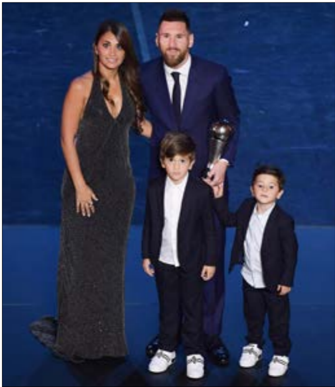
احرز الجائزة للمرة السادسة في مسيرته

وفي تصويت الجماهير المسجلة على موقع فيفا الإلكتروني، حصل ميسي على 1,359,728 مليون نقطة متقدماً بفارق كبير عن رونالدو (962,919 نقطة) وفان داك (704,235).