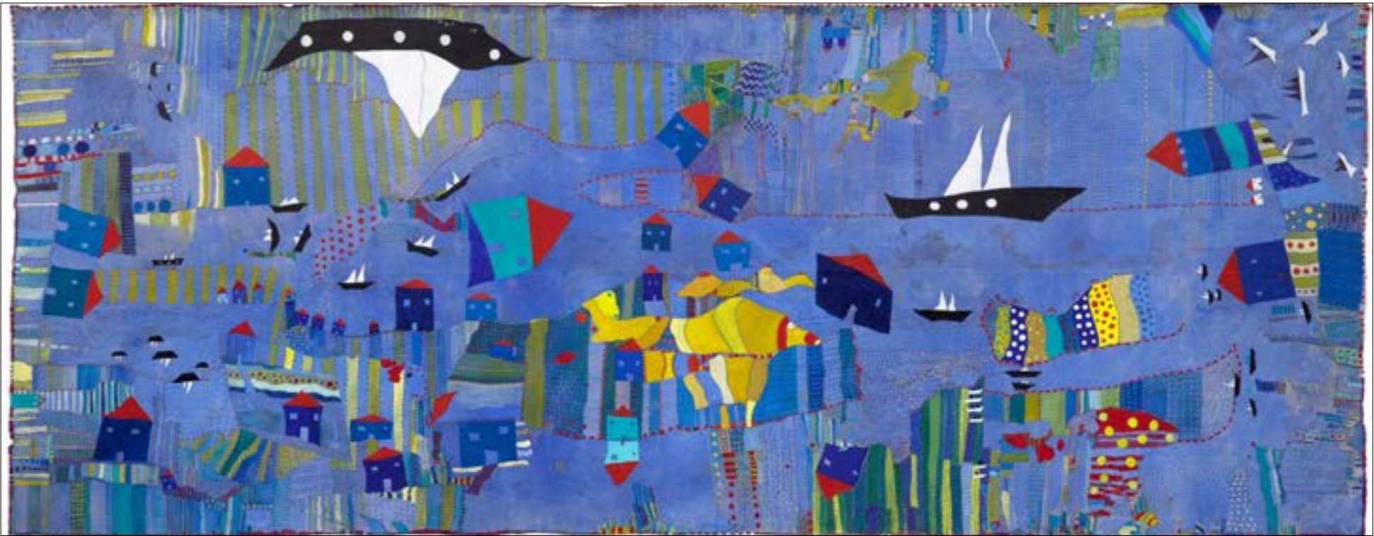
الزرافة الكبير، (مواد مختلفة على كفافس... 64,5 × 161 سنتم - 2012)

«كانت لدي مدرستان مهمتان في الحياة: الاستماع إلى اسمي والنساء والقصص التي يرويها، والأخرى هي اللبالي التي لا تتنهي في مدريد