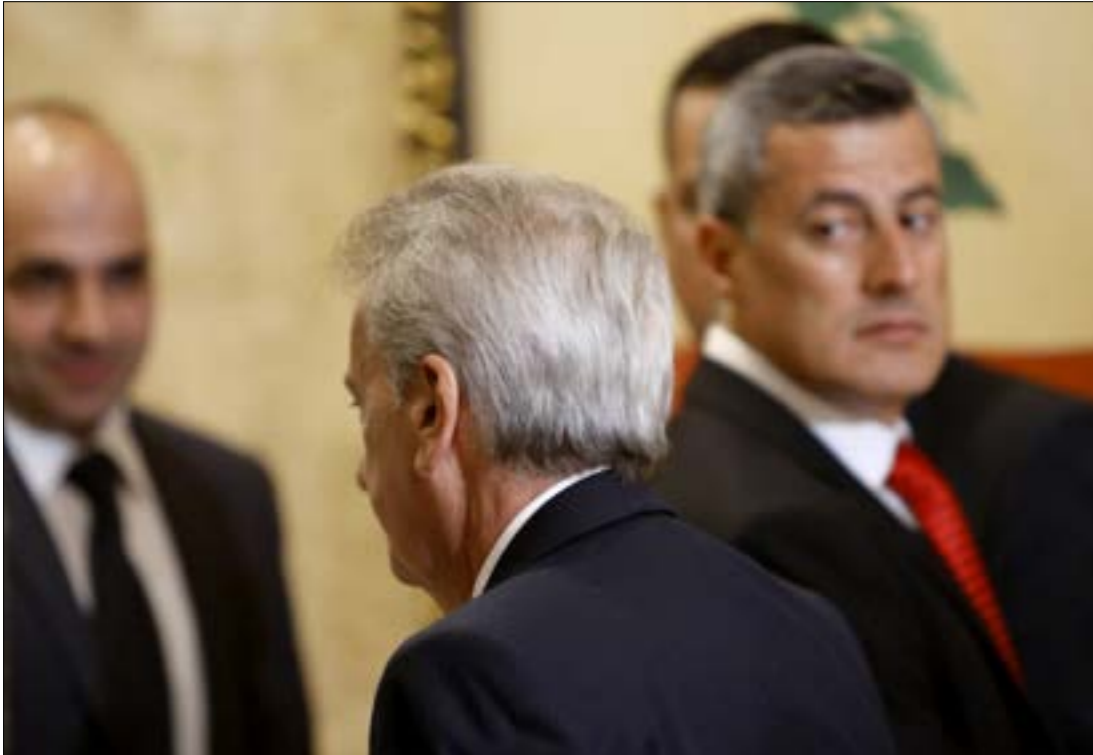
تدخل بيلنغسلي اجبر سلامة على الاعتراف بالأزمة

بسبب عدد من الملفات. وبحسب المصادر، شكّل هذا الموضوع مادة رئيسية خلال الزيارة التي قامت بها وزيرة الدفاع الفرنسية فلورانس بارلي في تموز الماضي على رأس وفد عسكري رفيع المستوى، إذ كانت لدى الفرنسيين معلومات عن تفاوض جهات لبنانية مع الإيطاليين، وحين سألت بارلي عن الأمر، أجاب المعينون بأن «لبنان يدرس العروض»، محاولين تبييع الإجابة، تارة من خلال القول إن «وزارة الدفاع هي من تبت بالأمم»، وتارة أخرى بأن «مجلس الوزراء هو من يقرر بناءً على تقرير قيادة الجيش». وقد استدعى ذلك زيارة قام بها السفير الفرنسي في بيروت لقائد