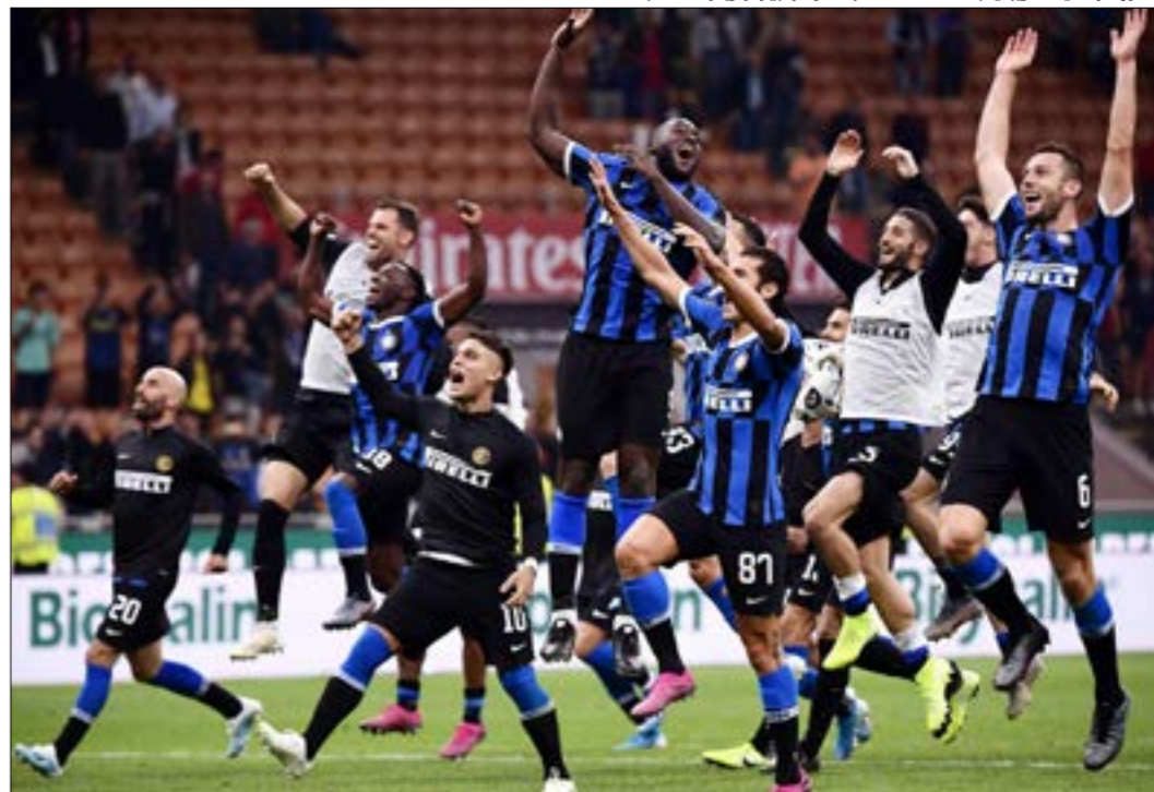
فاز إنتر في الدوري بعد أداء مقنع

هو موسم التحديات للنيراتزوري. بعيداً عن مسؤوليات كونتي يقف