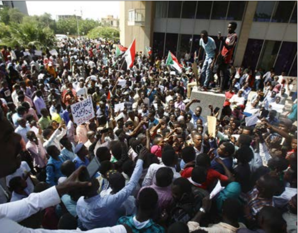
خلال التظاهرات، الر موظفون ومسؤولون كثيرون تركت مواضع عملهم من تلقاء انفسهم

الوظيفة بالطرق المتبعة فلا حرج عليهم». وكان «الحرية والتغيير»، ممثلاً بـ«تجمع أساتذة الجامعات الجماعية لكل مديري الجامعات والكليات»، أحد المكونات الرئيسة في «تجمع المهنيين السودانيين» الذي يقود الاحتجاجات منذ أواخر العام الماضي، أعلن دعمه وزيرة التعليم العالي، انتصار الرزين