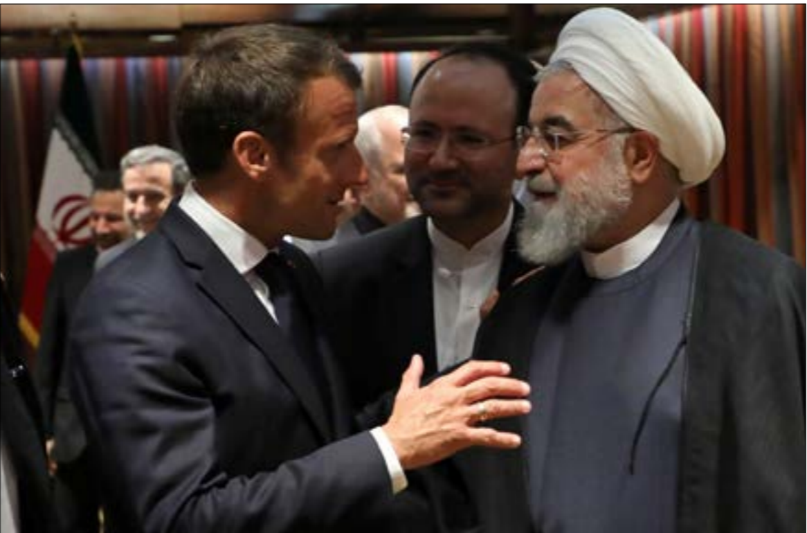
دعما ماكرون الطرفين إلى «التخلي بالشجاعة، أبناء السلام

الإيراني، حسن روحاني، في الفندق في نيويورك، حيث فرضت السلطات الأميركية قيوداً على تحركاته. وإن ابعدت فرص الرئيس الفرنسي، إيمانويل ماكرون، لجمع الرجلين، إلا أن روحاني استفاد من الترفال الدولي ليرمي بورقة تساعد على تحقيق استراتيجيته بلاده، أي التفاوض لا من موقع الضعف. إذ أعلن استعداده «للمحت إدخال التغييرات أو إضافات أو تعديلات محدودة على الاتفاق النووي حال رفع العقوبات» لكن لا فرض واضحة بعد لهذه المبادرة، خصوصاً أن ترامب أعلن تمسكه بسياسة «الضغط القوي» مع إشارته إلى إمكانية فرض المزيد من العقوبات. كذلك فإنه، في مؤشر على تعقيد الأزمة، أظهر الأوروبيون دعماً غير مسبق لفكرة خوض مفاوضات جديدة تشمل ملك الباليستي والأمن الإقليمي، في بيان الترويكا