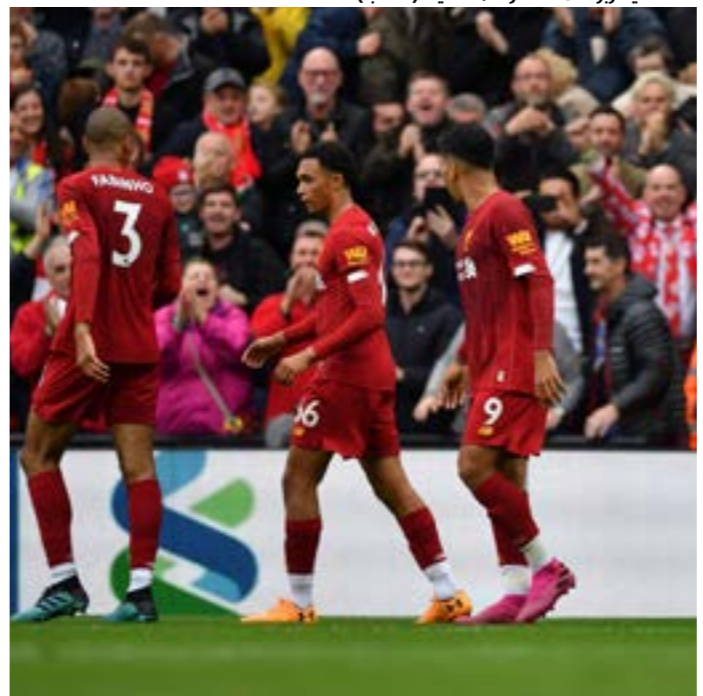
حقق ليفربول 8 انتصارات متتالية

على الجانب الآخر، يتطلع رجال المدرب الألماني يورغن كلوب لكسر الأرقام، ومواصلة بدايتهم القوية في الدوري، حيث حقق الفريق 8 انتصارات متتالية، ورغم عدم تقديم أداء مقنع في بعض المباريات، إلا أن