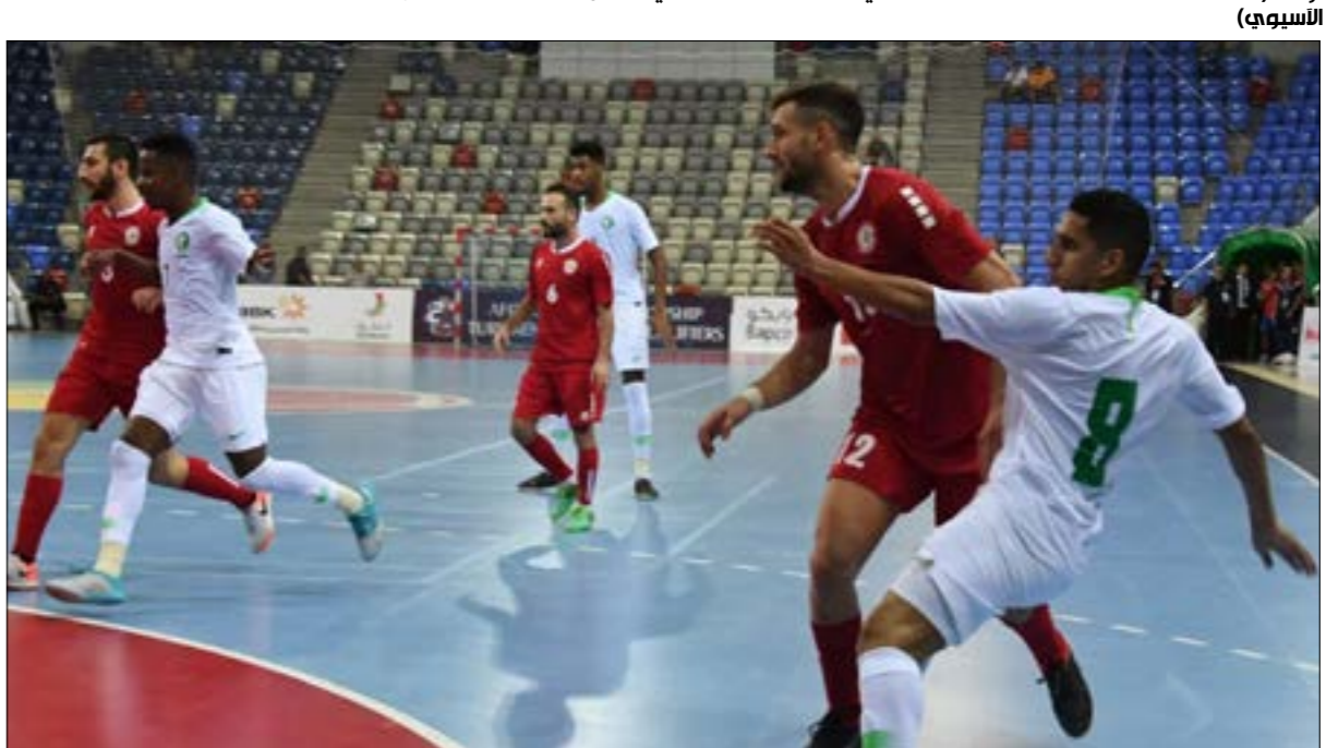
فاز منتخب لبنان بهدفين لوحيداً للاتحاد الآسيوي

وأظهر اللبنانيون تفوقاً تكتيكياً، خصوصاً عبر التمركز والتحرك والحفاظ على الكرة، فضلاً عن خلق التوازن في الدفاع والهجوم. وشهدت المباراة أخطاء تكتيكية عديدة، فأحتسب الحكام 5 أخطاء على منتخب لبنان قبل 5 دقائق من انتهاء الشوط الأول، مقابل عدم احتساب أي خطأ على المنتخب السعودي.