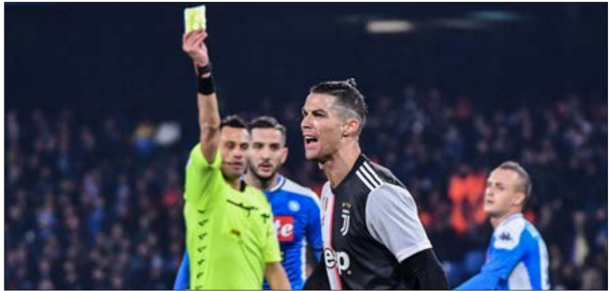
خسر يوفنتوس مباراته الأخيرة أمام نابولي

وأظهر الفريق أواخر العام الماضي ومطلع الحالي تراجعاً في مستواه، فلم يتمكن من تخطي الدور الأول من دوري أبطال أوروبا حيث سيكمل المشوار في الدوري الأوروبي (يوروبا ليغ)، ومن هنا جاء التعاقد مع اللاعبين الثلاثة الذين يعرفهم جيداً كونتي من خلال تدريبه تشلسي في الدوري الإنكليزي، علماً بأن موزيس تحديداً لعب تحت إشرافه في الفريق الأخير، عندما توج بطلاً للدوري الإنكليزي.