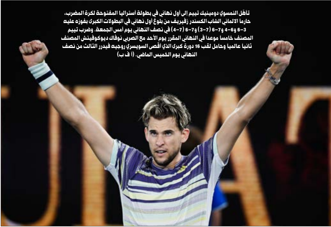
تأهل النمسي دومينيك تيم إلى أول نهائي في بطولة أستراليا المفتوحة لكرة المضرب. حارما الألماني الشاب الكسندر زفيريف من بلوغ أول نهائي في البطولات الكبرى بفوزه عليه 3-6 و4-6 و7-6 (3-7) و6-7 (4-7) في نصف النهائي يوم أمس الجمعة. وضرب تيم المصنّف خامسا موعدا في النهائي المقرر يوم الأحد مع الصربي نوفاك ديوكوفيتش المصنّف ثانيا عالميا وحامل لقب 16 دورة كبرى الذي أفضى السويسري روجيه فيدرر الثالث من نصف النهائي يوم الخميس الماضي. (ا ف ب)

افقيا 1-المتنقعات - 2- بوبك - نسي - 3- اكز - رعد - 4- ورم - 5- لهو - 6- جون كيتس - 6- سلمون - وب - 7- يتال - اب - بغ - 8- اراكيل - 9- يمدحُن - درب - 10- نواكشوط - ها عموديًا 1-الإكسجين - 2- كرملم - مو - 3- مُرم - ماينا - 4- سور - جول - حك - 5- تي - مون - اش - 6- نكران - ارنو - 7- كويا - 8- عنديب - 9- كد - 10- اس - هت - بيره - 10- تيوسيلبا ساقية باء جميعها بألفعل.