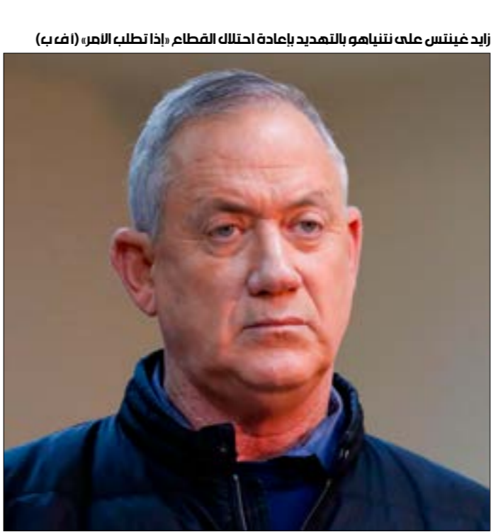
زايد غنيمس على نتياهو بالتهديد بإعادة احتلال القطاع (إذا تطلب الأمر، (أ ف ب)

لإغفاء مصداقية على تهديداته، التي تظهر - من ضمن ما تظهر - موقع العاصمة السورية في معادلة الصراع، وكونها عمقاً استراتيجياً للمقاومة الفلسطينية.