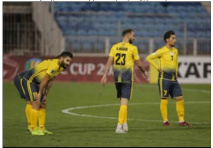
تلقى العهد خسارته الآسيوية الأولى بعد 13 مباراة (عدنان الحاج علي)

التصل إلى العنبري نفسه الذي سجّل الهدف الوحيد في المرمى الخالي (د. 69). بطبيعة الحال، لم يكن ظاهر وحده في الساحة لوقف المدّ الهجومي للفريق بدت لديه رغبة كبيرة للفوز، لكن الحقيقة أن العهد لو كان مكتمل