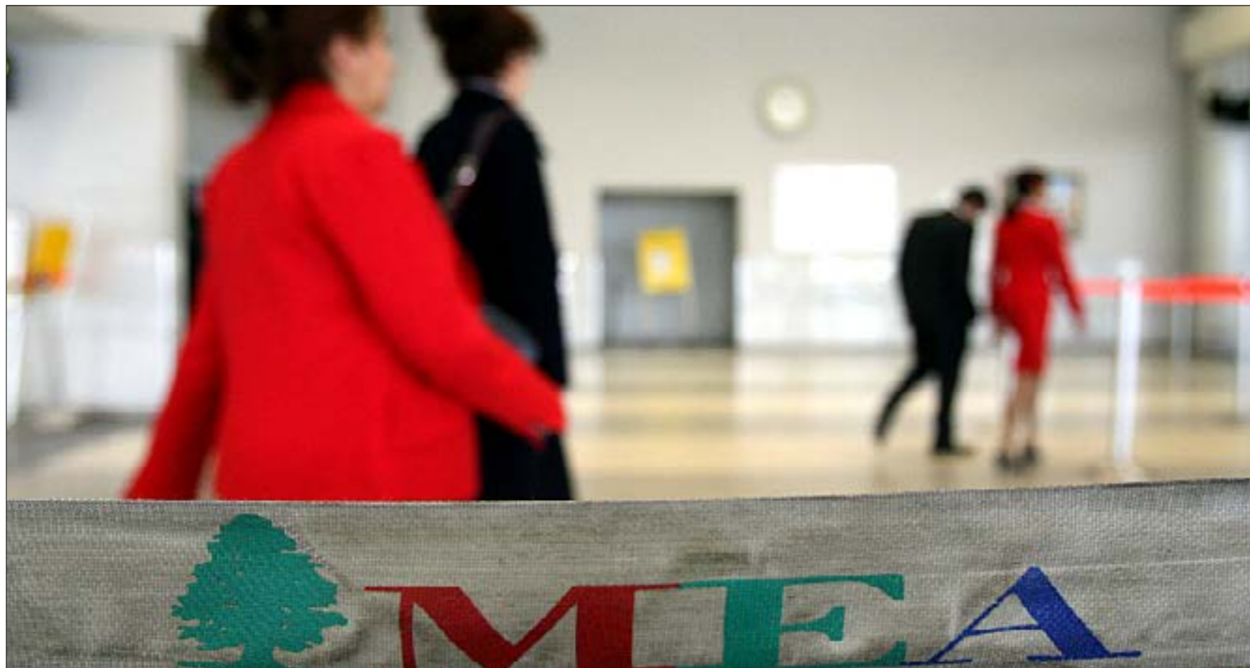
طلب سلامة تحريك عملات تحويل الأموال لحال اتحاد الطيران الدولي (مروان طحطح)