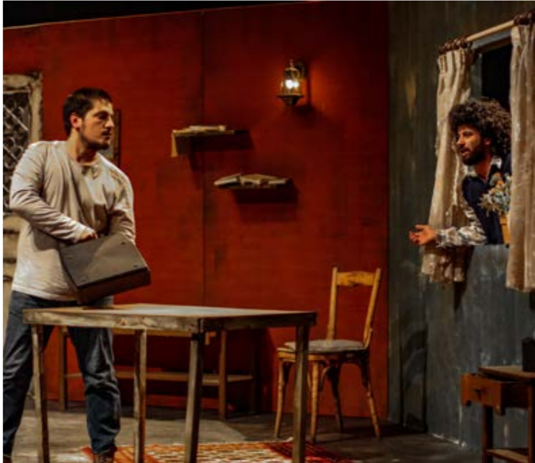
مسرحية «عم بقولوا إسماعيل انتخر» تقوم على السابور والعملة

تبقى الأعمال المسرحية التراجيكوميدية الشعبية الأكثر وواجاً لدى الجمهور المسرحي اللبناني، في كل مرة يتم فيها تقديم مسرحية من هذا النوع، تلقى استحساناً وإقبالاً عند الجمهور. رغم أن نوعاً آخر من الجمهور اللبناني يفضل مشاهدة الأعمال التي تنتمي إلى مرحلة ما بعد الحداثة، التي بدأت ملامحها بالظهور أواخر أربعينيات القرن الماضي في ألمانيا وغيرها من الدول الأوروبية، مع الكوريغراف بيثا باوش وغيرها ممن حملوا رؤية مسرح ما بعد الحداثة، ولكن، علامة يقبل المخرجون المسرحيون اللبنانيون الشباب في هذا الوقت؟ وأي نوع مسرحي يفضلونه؟