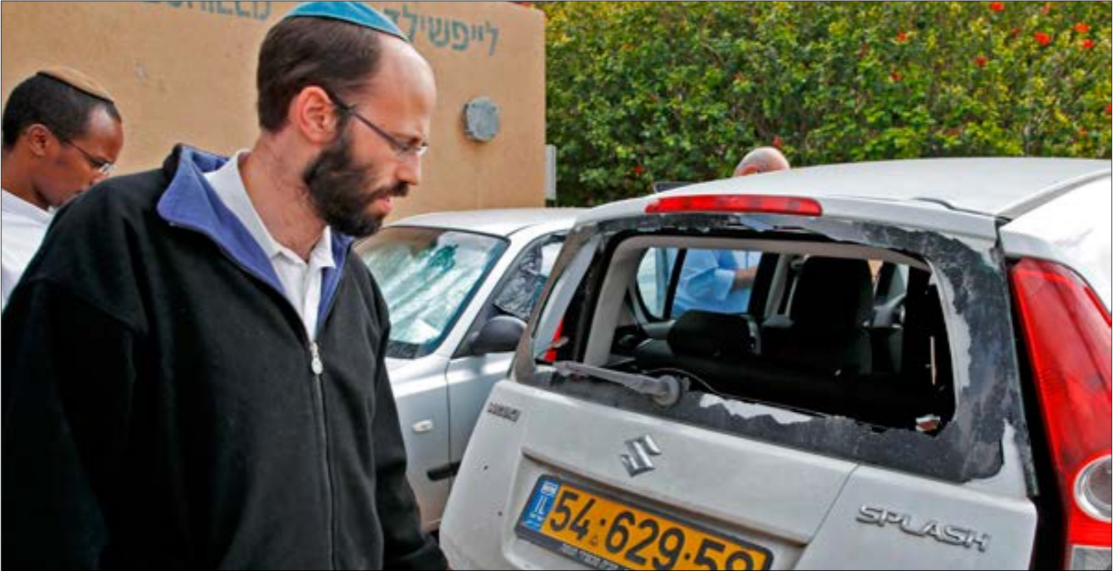
الهدنة هشة كسابقاتها وقبلها نتياهو وهو امام ايام قليلة على الانتخابات

في المقابل، تجاوز عدد غارات العدو خمسين غارة، استهدفت بها مواقع للمقاومة من دون أن يؤدي ذلك إلى إصابات أو شهداء، كما استهدف مجموعتين للمقاومة وسط القطاع وشماله، ما أدى إلى إصابة مواطن واحد كان يستقل دراجته النارية شمالاً وقبل دقائق من دخول التهدة حين التفتيف، سقطت قانيا من صاروخ له «القبة الحديدية» على منزل شرق الشجاعية، ما أدى إلى إصابة 13 فلسطينياً بجراح مختلفة. بالتوازي، أعلنت «كتائب المقاومة الوطنية»، الجناح العسكري له «الجبهة الديموقراطية لتحرير