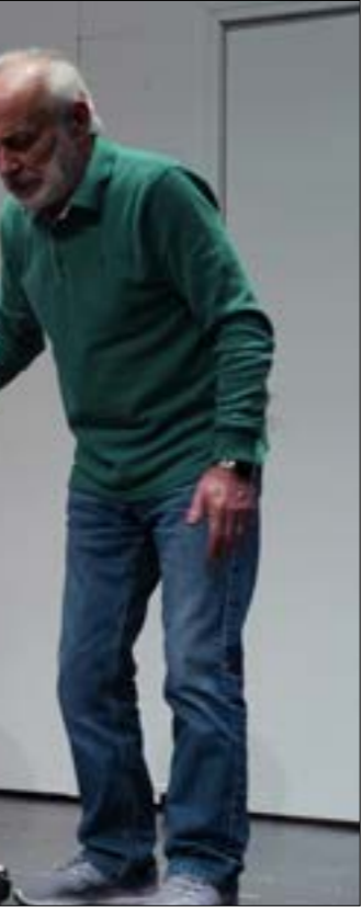
مسرحية تقوم على السابور والعملة