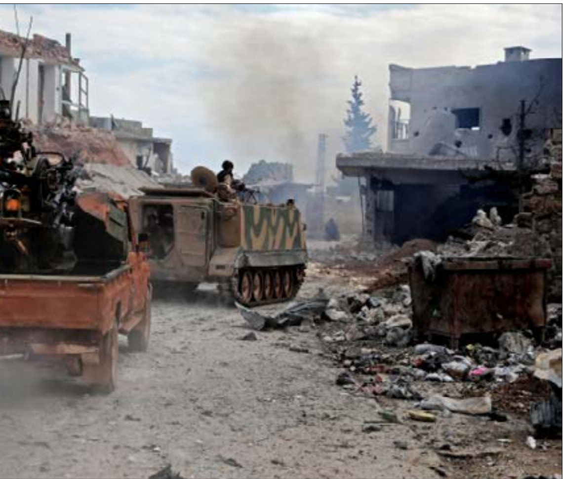
ينصّب الاهتمام التركي الميداني على النيرب غربي سراقب

أصدر مجلس الوزراء السوري، مطلع العام الجاري (20 كانون الثاني/يناير)، قراراً جديداً حقل الرقم خمسة، الرّم الجهات العامة المتعينة بسجلات ملكية العقارات والمركبات بانواعها، والكثاب بالعدل، عدم توثيق عقود البيع قبل وضع قيمتها أو جزء منها في الحساب المصرفي للمالك (البيع)، أو خلفه العام أو الخاص، أو من يتوب عنه قانوناً، اعتباراً من منتصف شباط. قرأ نزار، فور صدوره، ضجة في الشارع، حيث غمّ كثيرون زيادة في الإجراءات الروتينية من شأنها