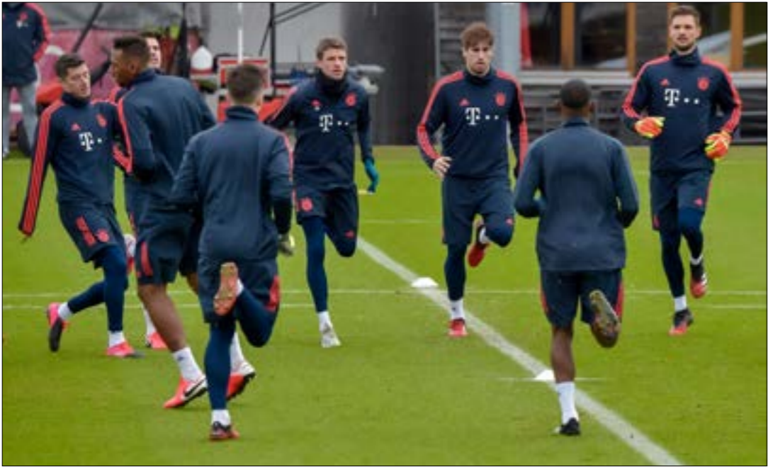
تحسّنت نتائج بايرن في الفترة الأخيرة

بعد سلسلة من التخبطات، أقالّت إدارة برشلونة مدرب الفريق السابق أرنستو فالفيردي وعيّنت مكانه ككيكي سبتين لتعديل المسار. انصفت بداية المدرب الجديد البطء على صعيد النتائج والأداء، غير أن الفريق تحسن