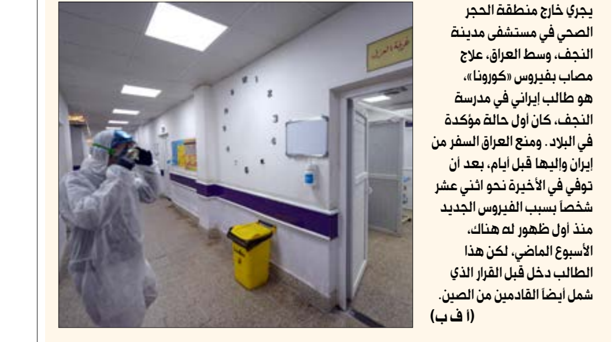
يجري خارج منطقة الحجر الصحي في مستشفى مدينة النجف، وسط العراق، علاج مصاب بفيروس «كورونا»، هو طالب إيراني في مدرسة النجف، كان أول حالة مؤكدة في البلاد. ومنع العراق سفر من إيران واليها قبل ايام، بعد ان توفي في الاخيرة نحو اثني عشر شخصاً بسبب الفيروس الجديد منذ اول ظهور له هناك.

وكان لوزير الأمن، نفتالي بينت، نصيبه في هذا التحدي الذي نجحت «الجهد» في أن تفرضه على كيان العدو، إذ لم تفض سوى أيام على تهديدات بينت ضدّ المقاومة، حتى عدّل الوزير عن مواقفه بالقول إن إسرائيل لا ترغب في عملية واسعة النطاق، لكنها ستلجأ إلى هذا الخيار إذا لم يكن هناك مفرّ منه». وكما في محطات مشابهة تحوّلت جولة التصعيد الحالية إلى مناسبة للتنافس الانتخابي وتبادل الانتقادات بين المسؤولين الإسرائيليين. وفي هذا السياق، رأى رئيس تحالف «أزرق أبيض»، بيني غانتس، أن «ردع إسرائيل سُحق في الستين الماضية بصورة خطيرة، وتخّ فقدان المبادرة» لكن غانتس اعتبر انطلاقاً من تجربة شخصية أن «الجولات (مع غزة) ستؤدي في النهاية إلى معركة واسعة، أو أن توافق حماس على تسوية فورية وفعالة وملموسة، ومن ضمنها إعادة الأقاليم الجنود الأسرى»، محاولاً المزايده على نتنهاهو بتقديم نفسه أكثر يمينية وتطرفاً في ما يتعلق بالقضايا الأمنية، عبر التوعّد بأن إسرائيل «لن تردّد في احتلال غزة إذا كان هذا ما تتطلبه إعادة الهدوء».