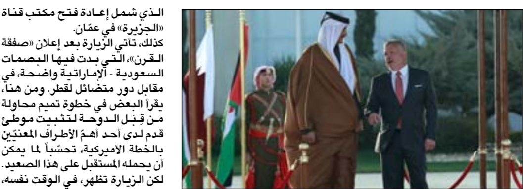
تاليّ الزيارة بعد اعلان «صفقة القرن»، ووضوح الدور المرسوم لعمان

السجن مدة 175 عاماً في أميركا.