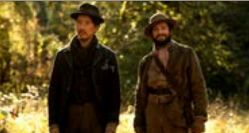
«البقرة الاولى» للاميركية كيلبي ريتشارد