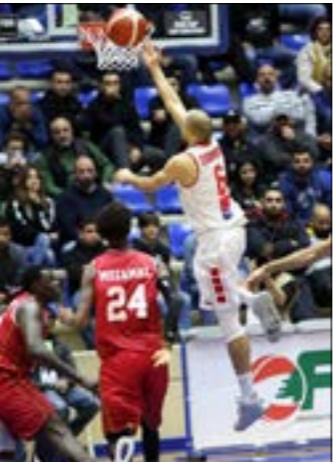
استحق منتخب الأرن الفوز