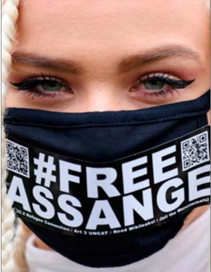
تجمع المشرات من داعمي اسانج امام محكمة وولويش لنجدا بآراء،ات محاكمته

موكب سيارات ضخّم لأمير قطر، تميم بن حمد، في الوفد المرافق له، سبّب في مضاعفة أزمة المرور المخاقة التي تشهدا العاصمة الأردنية عمّان منذ سنوات، فيما تزيّنت الشوارع بصور الضيف والملك عبد الله الثاني، بالتزامن مع عرض شاشات رقمية إعلانات ترويجية لصور أخرى يظهر فيها عبد الله وملك السعودية سلمان، أو عبد الله وأمير الكويت صباح الصباح، وكذلك الحال مع رئيس الإمارات خليفة بن زايد، والملك البحريني حمد بن عيسى، في ما يشبه أسلوب «ضربة على الحافر وضربة على السمل»، من أجل موازنة علاقات المملكة بـ«الأخوة الخليجيين» المتخاصمين في ما بينهم.