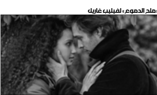
«ملح الدعوم» لفيليب غاريل