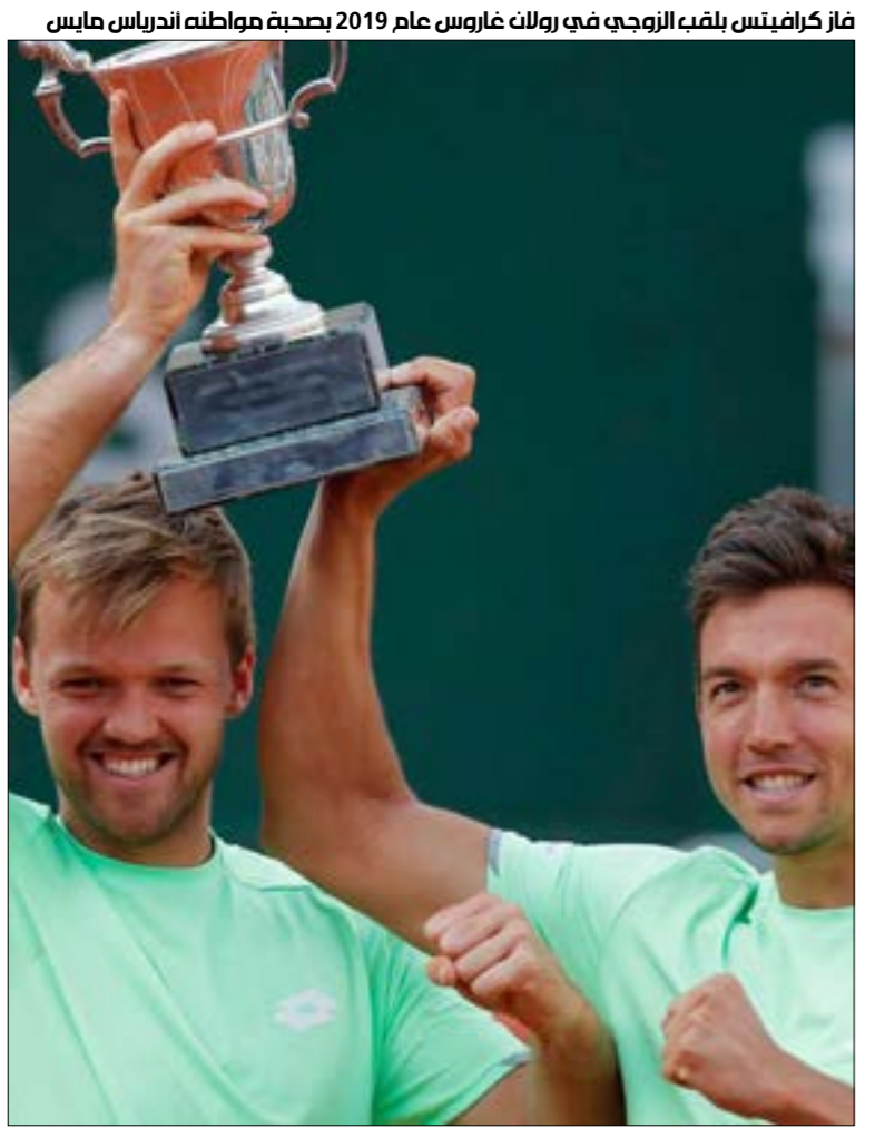
فاز كرافيتس بلقب الزوجي في رولان غاروس عام 2019 بصحبة مواطنه أندرياس مائيس

وعندما لا يكون في التمارين، يقضي كرافيتس وقته في تكديس الرفوف في زمن فيروس كورونا الذي أدى إلى وفاة 5750 شخصاً في ألمانيا حتى الآن من أصل 155193 إصابة. وأوضح «أقوم بفرض الرفوف والتأكد من تخزين النقائف والجبين بشكل جيد وفرض الصناديق الفارغة، الأسبوع الماضي توليت مهام الخدمة الأسمية عند المدخل، وقمت بتعقيم عربات التسوق». وكان كرافيتس يفكّر في تولّي وظيفة عادية إلى جانب كرة المضرب، لكن «يفضل كورونا، لدي الآن فرصة للقيام بذلك، كما أنّ خبرته تمنحه تقدراً أكبر كمحترف كرة مضرب. وكان كرافيتس ممتناً لتمكّنه «من تحويل هوايتي إلى وظيفة» في إشارة إلى كرة المضرب التي وضعتته وشريكه مائيس على خارطة اللعبة العام