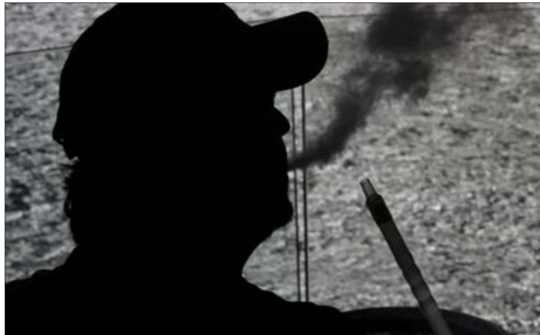
بسبب التدخين 4800 وفاة سنوياً ويكبد الدولة نحو 327 مليون دولار (مروان حططح)

الغد في اليوم، ويسبب التدخين 4800 وفاة سنوية في لبنان، وهو رقم ارتفع من 3000 عام 2008. وتكبد الأمراض المرتبطة بالتدخين الدولة نحو 327 مليون دولار سنوياً، وذلك وفقاً لستند «حج الحكومة اللبنانية على مكافحة التبغ خصوصاً في زمن كورونا»، الصادر عن مركز ترشيد السياسات في كلية العلوم الصحية في الجامعة الأميركية.