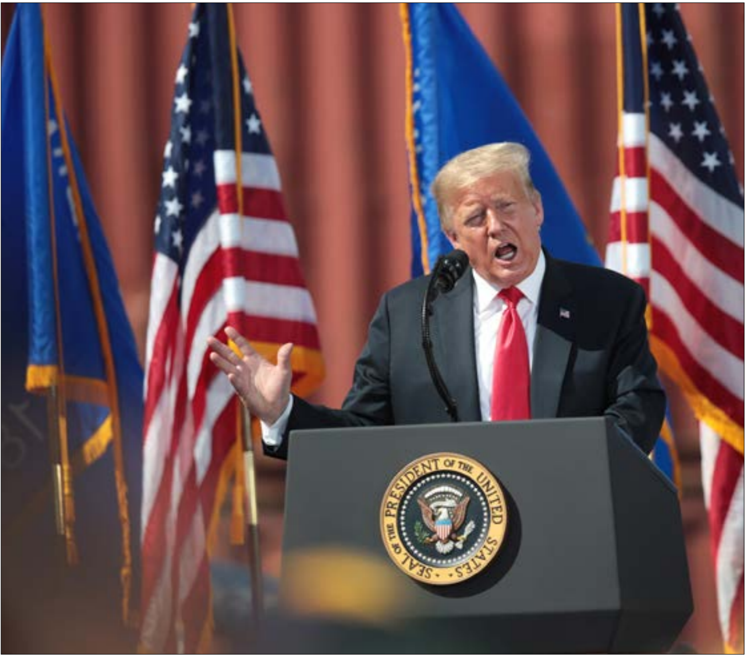
نفت حملة الرئيس بلنّة إمكانية انسحابه من السباق الانتخابي (اف ب)