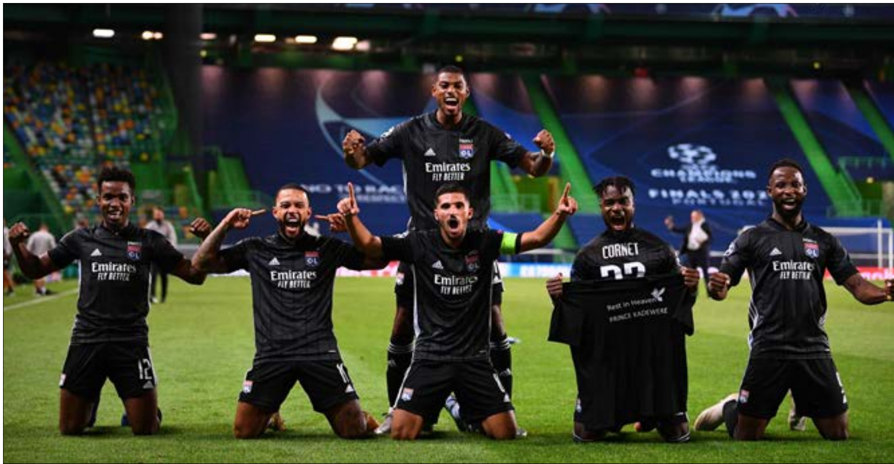
حقق ليون مفاجأة كبيرة بوصوله الى نصف النهائي النهائي