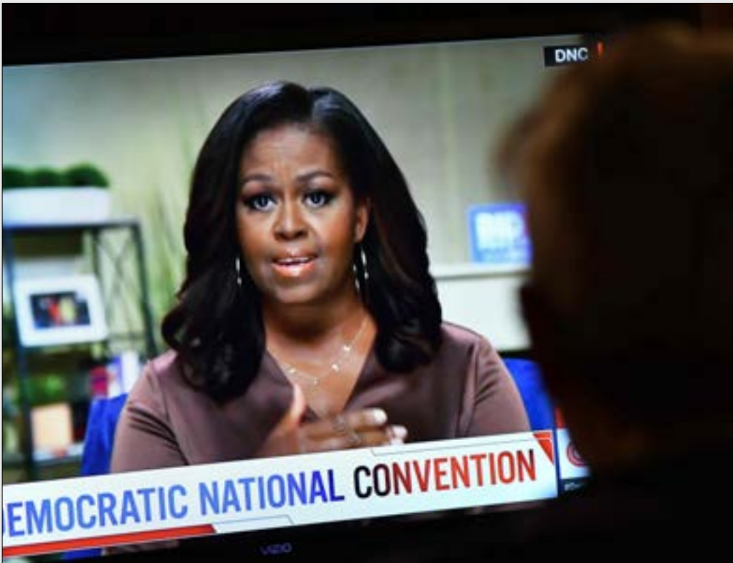
القت اوباما كلمتها في ختام الليلة الاولى من المؤتمر الذي يعقد افتراضيا بسبب كورونا، (اف ب)

تبادل كل من دونالد ترامب وميشيل اوباما الاتهامات في اليومين الماضيين. فبعد ما وجهت السيدة الاولى السابقة انتقادات لاذعة للرئيس الاميركي، في ذلك افتتاح مؤتمر الحزب الديموقراطي، رد الأخير بأن حكومة الرئيس باراك اوباما كانت الأكثر فسادا في التاريخ.