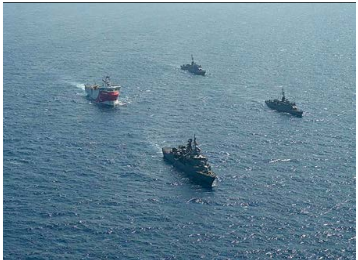
سفن حربية تركية ترافق سفينة بحث بح المتوسط

بينما تتزايد، أو تتبدل، التحالفات في المنطقة، تبدو لافئة كثرة الدول التي تدخل في صدامات مع تركيا مقارنة بتحالفات محدودة للأخيرة ارتباطاً بمواقفها السياسية في قضايا عديدة، لكن تدقّ هذه التحالفات حتى اليوم تحافظ على التناقضات داخلها. ففي الوقت الذي تستقوي فيه قبرص واليونان بعضوية الاتحاد الأوروبي وتستغل تركيا وجودها في «حلف شمال الأطلسي»، تبدو احتمالية المواجهة العسكرية بين اليونان وقبرص، مع تركيا، شبه مستحيلة. خاصة أن الأزمات الداخلية في الاتحاد والموقف الألماني الراجف في وقف التصعيد مع تركيا، عوامل تدفع إلى إرجاء أي أزمات جديدة. مع ذلك، تفهم برلين رغبة أثينا ونيقوسيا في الحفاظ على حقوقهما في ثروات المتوسط، لكنها ترى أن اللحظة غير مناسبة للاشتباك بسبب قضايا أخرى أكثر أهمية، وهو موقف تتشارك فيه مع باريس، رغم الدعم الفرنسي للعاصمتين، لكن الدعم ين يصل إلى درجة الاشتباك، في وقت تبحث فيه روما عن مصالح شركتها الأهم، «إيني»، المستثمر الأكبر في الاكتشافات وصاحبة الحصص الكبرى في النشاط في المنطقة.