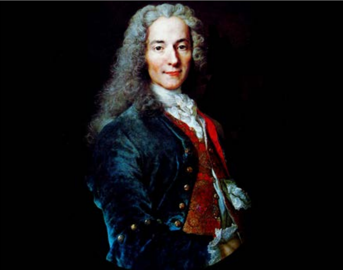
كتب فولتير الرواية حتى يرد على أحد مفكّري عصر التنوير آنذاك، جان جاك رهسو بعد مراسلاتٍ كثيرةٍ بينهما

إن استطعت الإلمام بها، ستخطو الخطوة الثانية وهي فهم النص