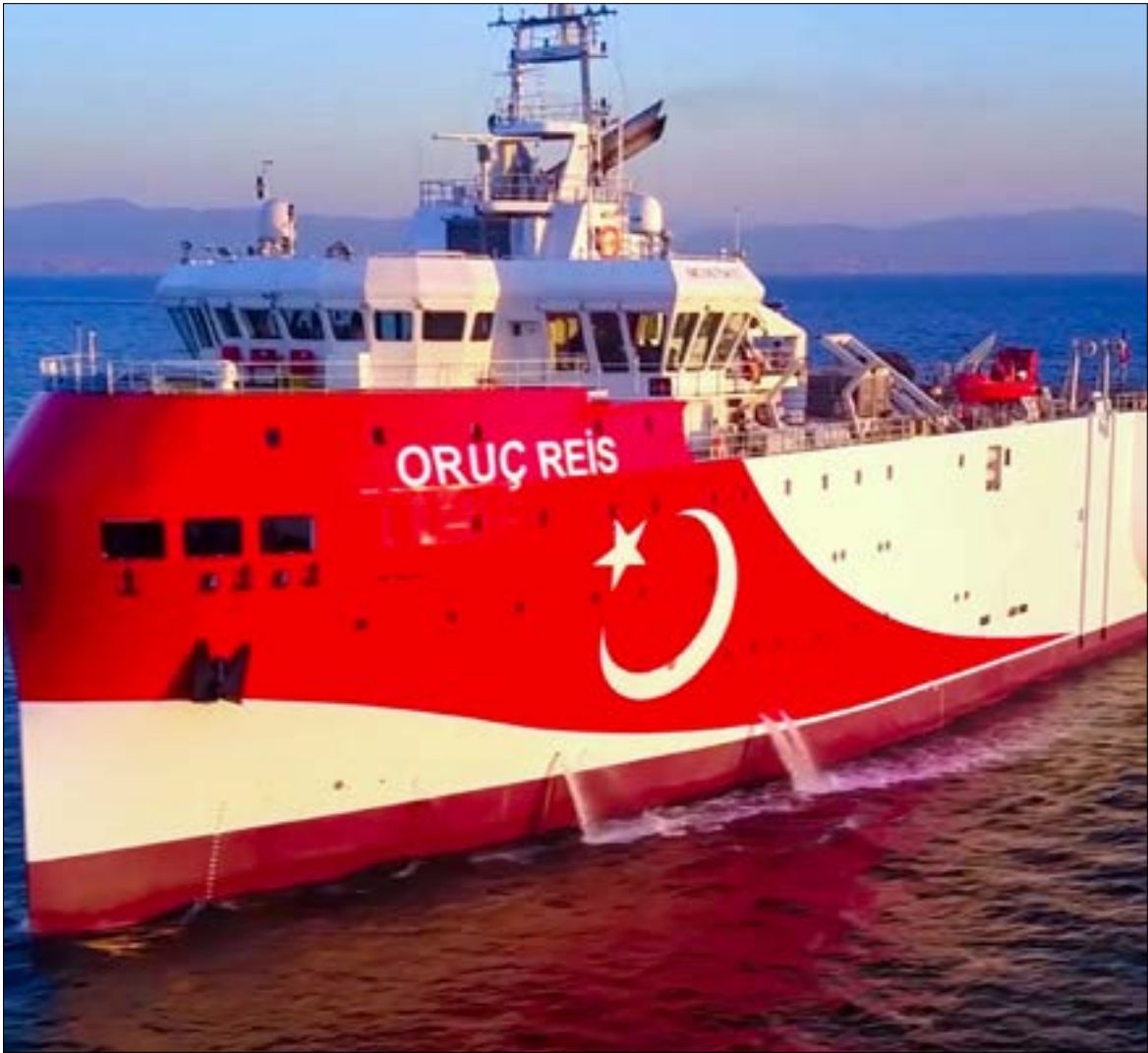
على عكس مصر واليونان وقبرص، لا تعتمد تركيا على الشركات الأجنبية في التنقيب

يبدو مسار المفاوضات مليئاً باللام، إذ تحاذر كل دولة من دول المتوسط العمل في مناطق غير خلافية مؤقتاً حتى ترسيم الحدود وفق رؤية