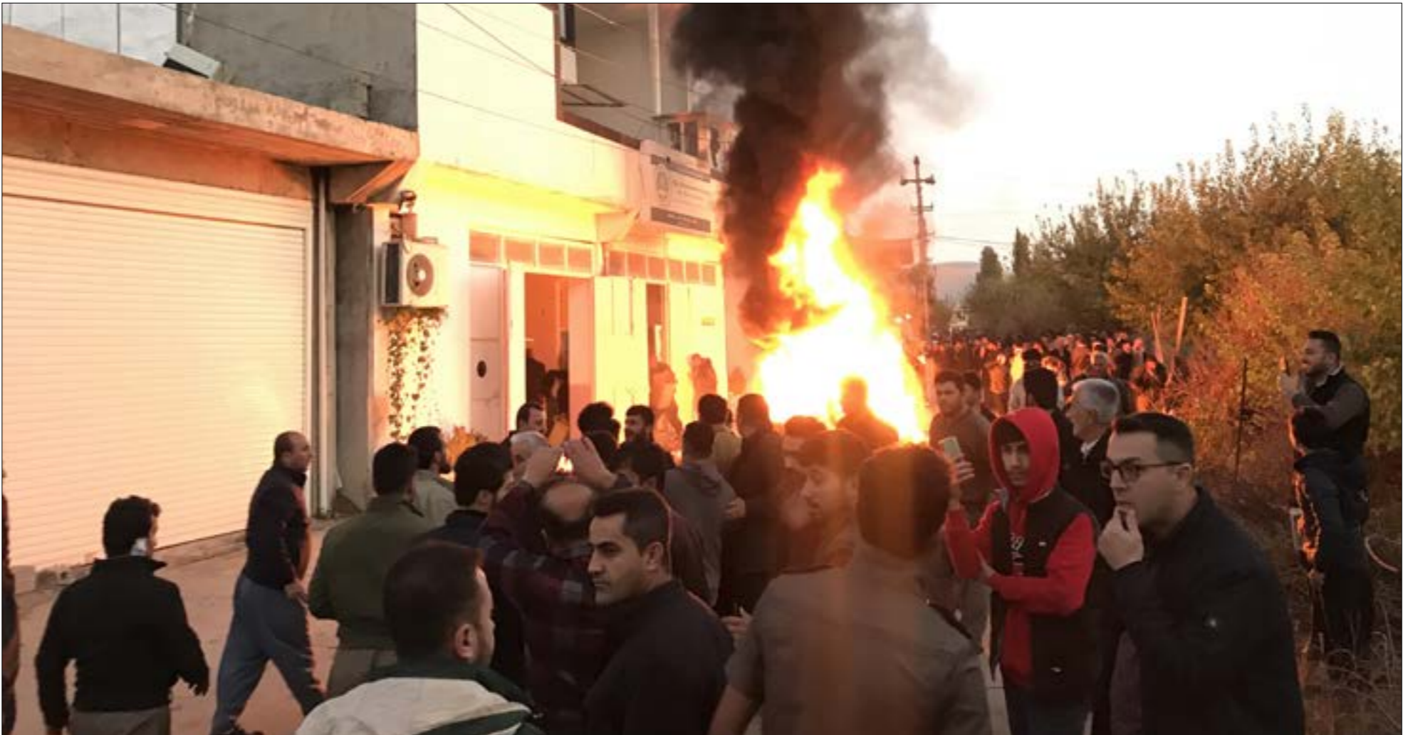
اضرم مئات المتظاهرين النار في مكاتب بالسليمانية احتجاجا على تأخر رواتب الدولة (الناضول)

2007، ثمّ نقض اتفاقية أربيل عام 2010، فسقوط مدينة الموصل بيد تنظيم «داعش» عام 2014، ومحاولة للحزب بافيل طالباني، حين أعلن في نهاية تشرين الثاني/ نوفمبر الماضي تشكيل لجنة التحقيق في ضلوع عدد كبير من «رجال المافيا» في أعمال «قذرة»، على حدّ وصفه، متعهّداً باعتقالهم ومحاسبتهم لإنهاء هذه الظاهرة. وبالعودة إلى رواتب الموظفين، فقد اقتلعتها بغداد من حصة «الإقليم» من الموازنة). نتيجة تعدد الأحزاب المعارضة القوية لنفوذ (بشكل الاتحاد الوطني»، إضافة إلى استفحال الفساد بغارق كبير من باقي محافظات «الإقليم»، بسبب «المافيات» التي تفرّض الاصوات