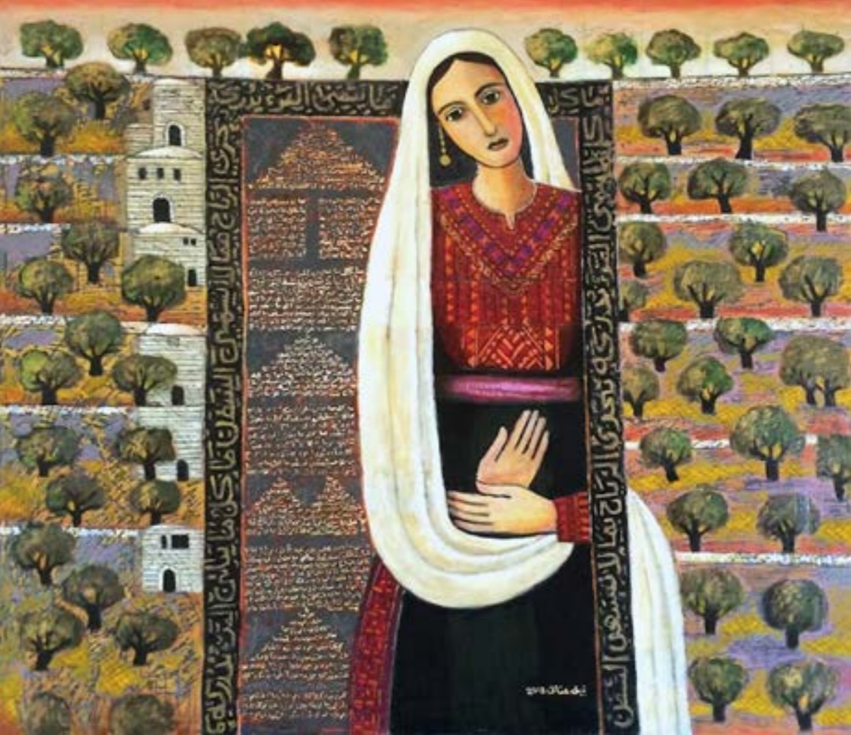
لوحة للفنان الفلسطيني نبيه غالي(غاليري زاوية، رام الله، جب)

وهكذا، تكون الحركة اليهودية قد تطوّرت، على امتداد عقود طويلة بين منتصف القرن التاسع عشر ومنتصف القرن العشرين، محتضنة من الاستعمارزين الفرنسي والإنكليزي للبلدان العربية لتنتهي في ظل جامعة الدول العربية المؤسّسة عام 1945، واستمّرت الخطابات القومية - الدينية بعد هزيمة الجيوش العربية، عقودًا لم تنفك الحكومات العربية خلالها من الوود بالقيام بالواجب القومي الديني للثأر ولرفض عودة المهجرين الفلسطينيين إلى ديارهم» حفظًا لكرامة الأمة من محطّتها إلى خليجها»، وظلت هذه الخطابات تحرّك آمال الفلسطينيين في المخيمات وأوساط القوميين في الصحافة