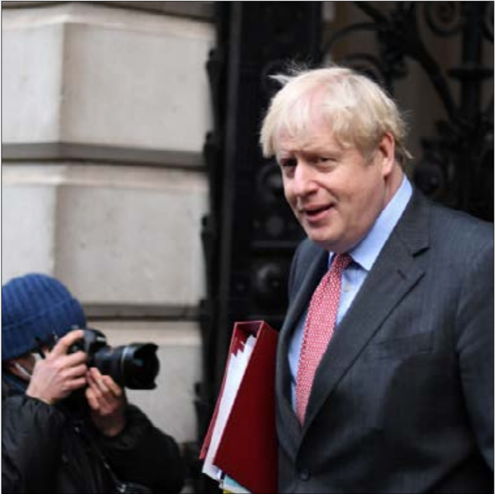
جونسون، يبدو الوضم صعبا جدا في الوقت الراهن سيدع قراره جهوده، (أ ف ب)