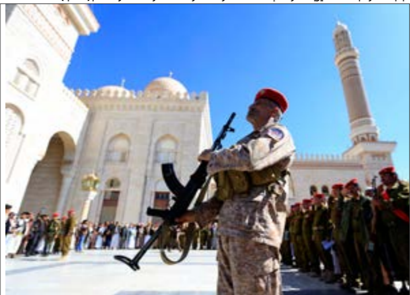
الباط مفتوح لكّل من يريد العودة إلى «حضن الوطن»، وفقاً لقانون العفو العام (ف.ب)

هادي من الدرجتين الثانية والثالثة، وأعضاء مجلس شورى وشخصيات اجتماعية وإعلامية خلال الفترة الماضية. ووفقاً للمصدر، فإن مردي العودة من السياسيين طلبوا الأمان، ومعاملتهم بموجب قرار العفو العام. وبحسب صحافيين موالين لحكومة هادي، فإن حكومة صنعاء زحبت إلى صنعاء قادمين من مدينة سيئون خلال فترة نفاذ القرار، وكلّ من غدل من الذين باتوا يعيشون في تركيا بعدما رحلوا من السعودية قازئين من إجراءاتها، عثروا عن أسهم لما قاموا به من دور إعلامي مساند للعدوان، وأكدوا أنهم لا يستطيعون العودة إلى بلد شاركوا في تدميره، متهمين السفير السعودي محمد آل جابر بتضليلهم وإجبارهم أثناء وجودهم في الرياض على تسويق روايات الأخيرة، على رغم كونها زائفة. من جانبه، كشف القيادي في حزب «المؤتمر الشعبي العام»، باسر الله، عن تلقّيه دعوة للعودة إلى صنعاء مع ضمانات بتأمين سلامته. متوجّهاً بالشكر إلى زعيم «انصار الله»، عبد الملك الحوثي، الذي قال إنه تتكّن من التواصل معه. وكانت العاصمة صنعاء قد استقبلت عدداً من الإعلاميين الموالين