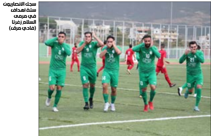
سحق الأنتصارون ستة أهداف في مرشح السلام زغرتا