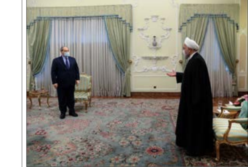
أكد روحاني، خلال استقباله المقداد، أن بلاده ستقف دالماً إلى جانب سوريا حكومة وشعباً

شكّل قرار مجلس وزراء «إقليم كردستان»، القاضي بصرف رواتب موظفي القطاع العام عن شهر تشرين الأول/ أكتوبر الماضي باستقطاع بلغ مقداره 21 في المئة، فتيلاً لانفجار سرعان ما وقع. إذ ما هي إلا ساعات على صدور القرار حتى لاحت السنة اللهب من ناحية بيره مكرون، شمال محافظة السليمانية (تعدّ الناحية إحدى وحدات التقسيم الإداري في البلاد، وهي تضمّ مدينة وبعض البلدات والقرى المحيطة بها). وأضرم المحتجّون النيران في شعار الأحزاب السياسية الكردية