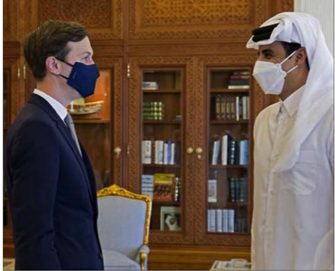
جاء التفاتح السعودي - البحريني قيادة فرج عمّان سنة من قرار الأردن التفاتح على قطر

كُل ذلك مضى، والأّن، بعدما تُسببت إرهابات الجهات الخليجي للتطبيع مع تل أبيب في إعادة عمّان حساباتها الإقليمية