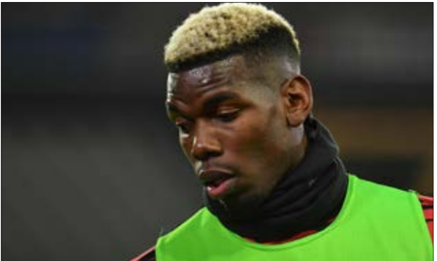
يلتفت عقده بوغبا بعد عام ونصف (أ ف ب)

أعلن ميخو رايبولا وكيل أعمال اللاعب الفرنسي بول بوغبا أن الأخير «غير سعيد» في مانشستر يونايتد الإنكليزي ويجب أن يغادر في نافذة الانتقالات المقبلة، ما يشير إلى إمكانية رحيل اللاعب الذي كان يوماً من الأعلّى في العالم. وقال رايبولا إن بوغبا (27 عاماً) يحتاج إلى «تغيير في المشهد» بعدما عانى ليثبت نفسه تحت قيادة مدرب يونايتد التروجي أولى غوار سولسكاير. وأضاف الوكيل لصحيفة «فوتوسبورت» الإيطالية «بول غير سعيد في مانشستر يونايتد ولا يمكنه التعبير عن نفسه بعد الآن كما يؤدّ وكما نتوقع منه». وتابع «عليه أن يغيّر الفريق، إنه يحتاج إلى تغيير في المشهد.