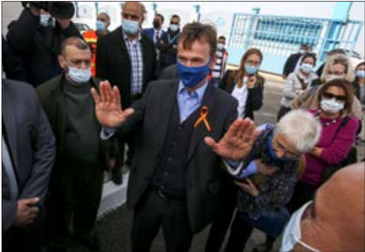
وفد الوفد الأوروبي بتشغيل محطة تحلية المياه ومد محطة الكهرباء، بالغاز

في ظلّ رزم المقاومة في غزة حالة الاستنثار والتأهب تحسباً للمغامرة، ما قد يُقدم عليها العدو. تتجدد الزيارات الخارجية للقطاع في محاولة لإدامة الهدوء، الذي يتهدّد تدهور الوضع الصحي والإنساني بتجزيره