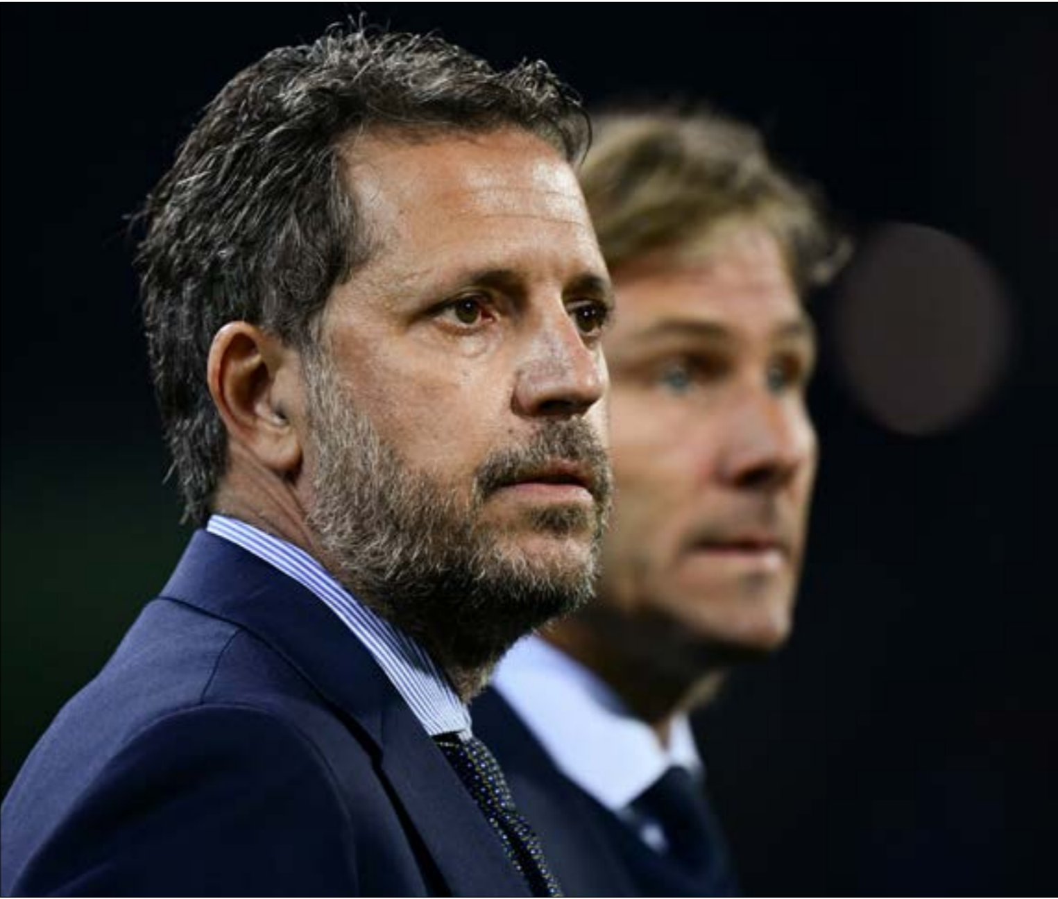
يواجه باراتيتشي عقوبات قد تصل إلى التوقيف النهائي (أ ف ب)

في النادي لدى تادية واجبه الدولي. وتطرق مدرب فرنسا ديديه ديشان إلى وضع بوغبا بقوله: «يعيش وضعية في تادية حيث لا يشعر بالسعادة من ناحية عدد الدقائق التي يحصل عليها للعب ولا من ناحية المركز الذي يشغله في الملعب». ولطالما تحدّث بوغبا عن رغبته في الدفاع عن الوان ريال مدريد الإسباني في أحد الأيام، لا سيما إذا كان هذا الأمر يعني اللعب بإشراف مواطنه المدرب زين الدين زيدان. وكان هدف بوغبا الرابع في المباراة أمام ويست هام (3-1) السبت، الهدف الأول له في ثماني مباريات في الدوري الممتاز هذا الموسم.