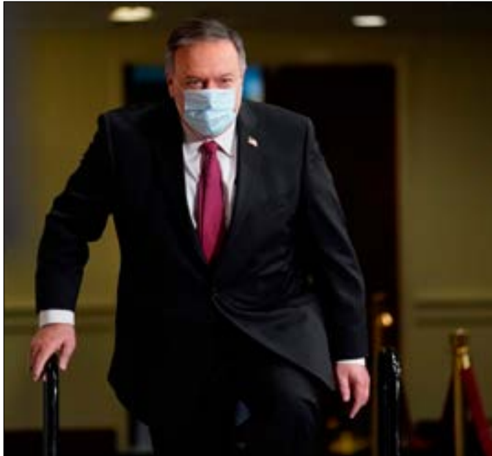
بنّاء بومبيو أن سلسلة الضغوط القصوى، تصدّف إلى عرقلة تنظيم العلاقات الأميركية - الإيرانية (أف ب)

في مناسبات عدّة، خلال الأسابيع الأخيرة، بيّن بومبيو أن سياسة «الضغط القصوى» التي تتبناها إدارته تجاه طهران، إنّما تهدف إلى عرقلة تطبيع علاقات الأخيرة مع واشنطن، في حال قُورت الإدارة الدبلوماسية. «التحوّلات المفاجئة في السياسة إدارة ترامب الخارجية»، باتت تثير مخاوف الحزبين في الكونغرس، وفي