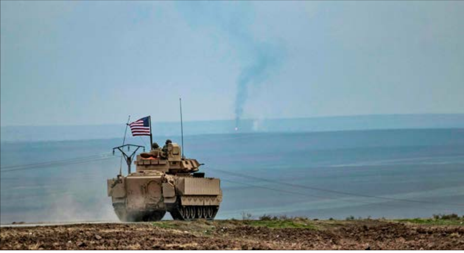
تسعى لك إيبي إلى استغلال الأيام الأخيرة لإدارة ترامب، لتوجيه أكبر عدد ممكن من الضربات إلى أعدائها