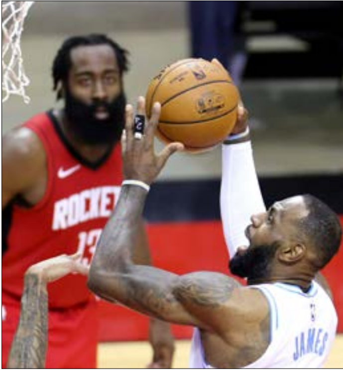
سجّل ليبرون جيمس 26 نقطة و8 تمريرات حاسمة

ولدى الخاسر، سجّل العملاق الصربي نيكولا يوكيتش 23 نقطة و11 تمريرة حاسمة و8 متابعات، لكنها لم تكن كافية في ظل تفوّق بروكلين (46-68) في الشوط الثاني. ونجح بروكلين في حسم المباراة في ظل غياب نجمه الآخر كايري إيرفينغ للمباراة الرابعة توالياً لأسباب شخصية. ويبقى موعد عودته