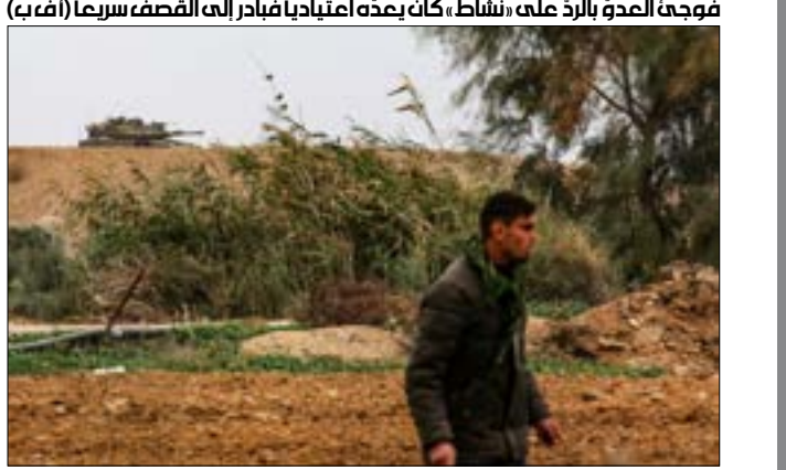
فوجحة العدو بالرّد على نشاط، وكانه يعبثاً بتدابير إمداد إلف القصف سريعاً

في السياق، وصف المحلّل العسكري في صحيفة «معاريف» العبرية، يوسي يوشع، الحادثة بـ«الخطيرة»، فيما اعترف جيش الاحتلال بتعرّض البية هندسية «كانت تُجري نشاطات جنوب غزة في الطرف الغربي من السياج لإطلاق نار آخر»، أدى إلى ردّ الدبابات بقصف موقعيّن بالقرب من نقطة الإطلاق. وبعد ساعات، تعرّضت قوة أخرى للاحتلال لإطلاق نار من مقاومين، لتردّ أيضاً قوات العدو بإطلاق النار على عدد من مواقع الرصد