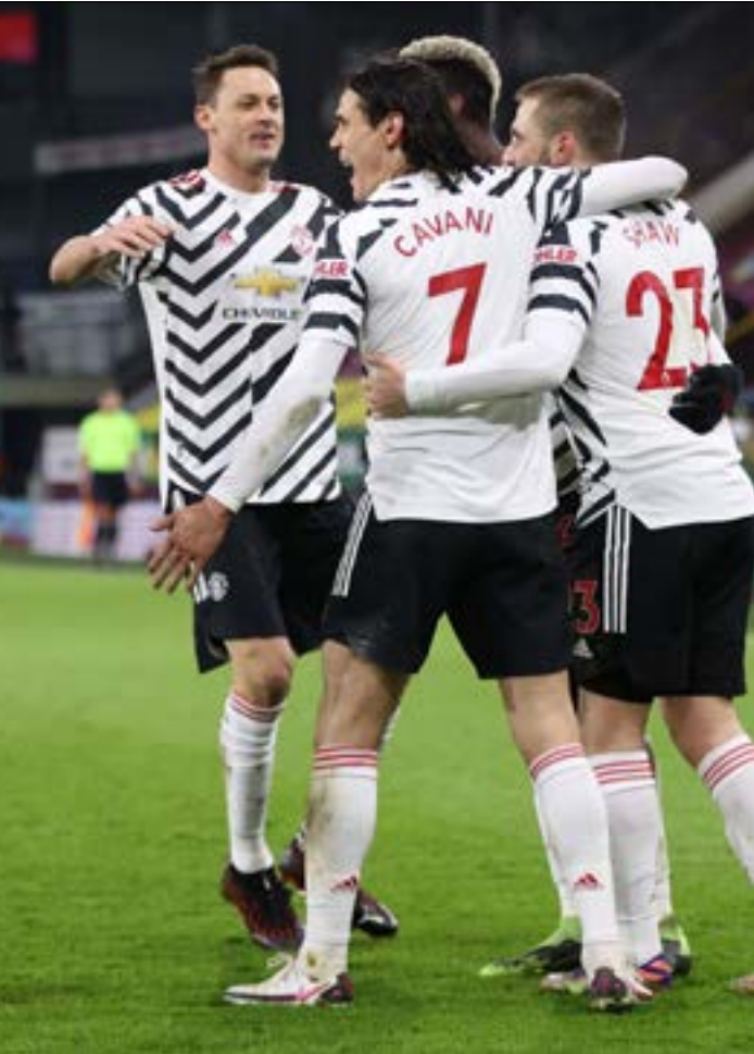
استناد مانشستر يونايتد بلا شك من الصرات التي تلقاها ليفربول

الفريق، لا إلى مدى يحتاج إلى وقت للتعرف على الأرضية وإلى صبر القتمين لتحقيق النتائج الياجبية. هنا، شرع سولشاير في السير بين الأسماء، فعمل على صرف حوالي 250 مليون جنيه استرليني لسد الفراغات، لكنه رغم ذلك لم يرتق