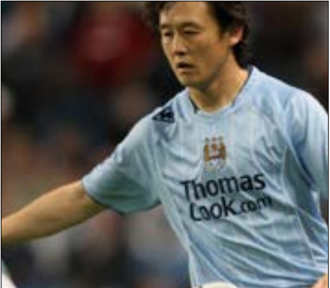
باتي كلام جيهاي بعد اسوم من تعيين نادي بكين غوان

وأضاف «السيناريو الصعب كان الإلغاء، أتمنى أن يكون هذا الحدث هو الضوء في نهاية النفق المظلم».