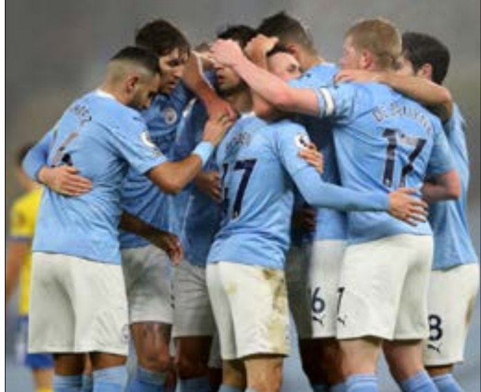
أرسلت الرابطة توجيهات جديدة للأندية لتخفيف احتمالاتهم

وأردف قائلاً «ساتابع البطولة من المنزل وسابقى مع عائلتي والودي أطفالي بسبب الوضع الدقيق الذي تعيشه إسبانيا مع الفيروس. اتعنى التوقيت للفرق المسافرة».