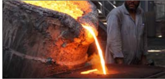
نظمة الدولة في استغلال اموال الشركة، وتخصم الأرض المقامة عليها، لمشاريع أخرى

بدأت الشركة باكتتاب شعبي، وبرأسمال يصل إلى نحو 21 مليون جنيه، وقد تمّ إنجاز المرحلة الأولى منها في زمن قياسي ارتبطاً بالظروف التي انطلق العمل فيها، ليتّم التشغيل بعد ثلاث سنوات فقط بتعاون مع شركة «ديماج ديسبرج» في ألمانيا الشرقية، والتي وفرت التقنيات اللازمة قبل أن يتعلمها المصريون. كان الاعتماد أساساً على الحديد الخام الذي يُستخرج من المناجم في الواحات البحرية وأسوان، إلى جانب إنتاج كميات