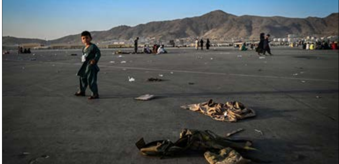
زادت الدعوات الدولية إلى فتح «ممرات إنسانية» لمن يرغب في مغادرة أفغانستان

سيما باكستان وإيران. بموجة لجوء هونر. أعلنت الجهاد ضدّ الحركة بعد تعيين أخوند زاده زعيماً لها. متهمّة إتياه بتولي هذا المنصب بأمر من الاستخبارات الباكستانية. ولا تعني «ممرات إنسانية» لُن يرغب في مغادرة البلد.