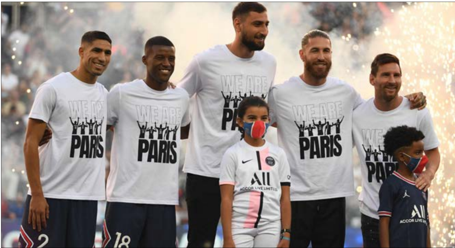
بملاك النادي الباريسي العديد من النجمة

بلقى مسابقة دوري أبطال أوروبا، إذ إنّ وجوده في فرنسا سيغيّر بلا شك من موازين القوى في ما خض تقويم البطولات الخمس الكبرى، حيث قيل دائماً أن بطولة فرنسا تأتي في المركز الخامس بعد انكلترا وإسبانيا وألمانيا وإيطاليا. وصول النجم الأرجنتيني إلى العاصمة الفرنسية، وأرقق أيتها بصورة عنزة وهي التي تختصر وصف الأفضل في التاريخ بكلمة «GOAT» بالإنكليزية، ليقول الفرنسيون بأنّ للفلاحين الآن أفضل من وسم بهذا اللقب. فعلاً تأخر ميسي بتخطي رفع مستوى طموحات باريس سان جيرمان منذ الأزل بالفوز