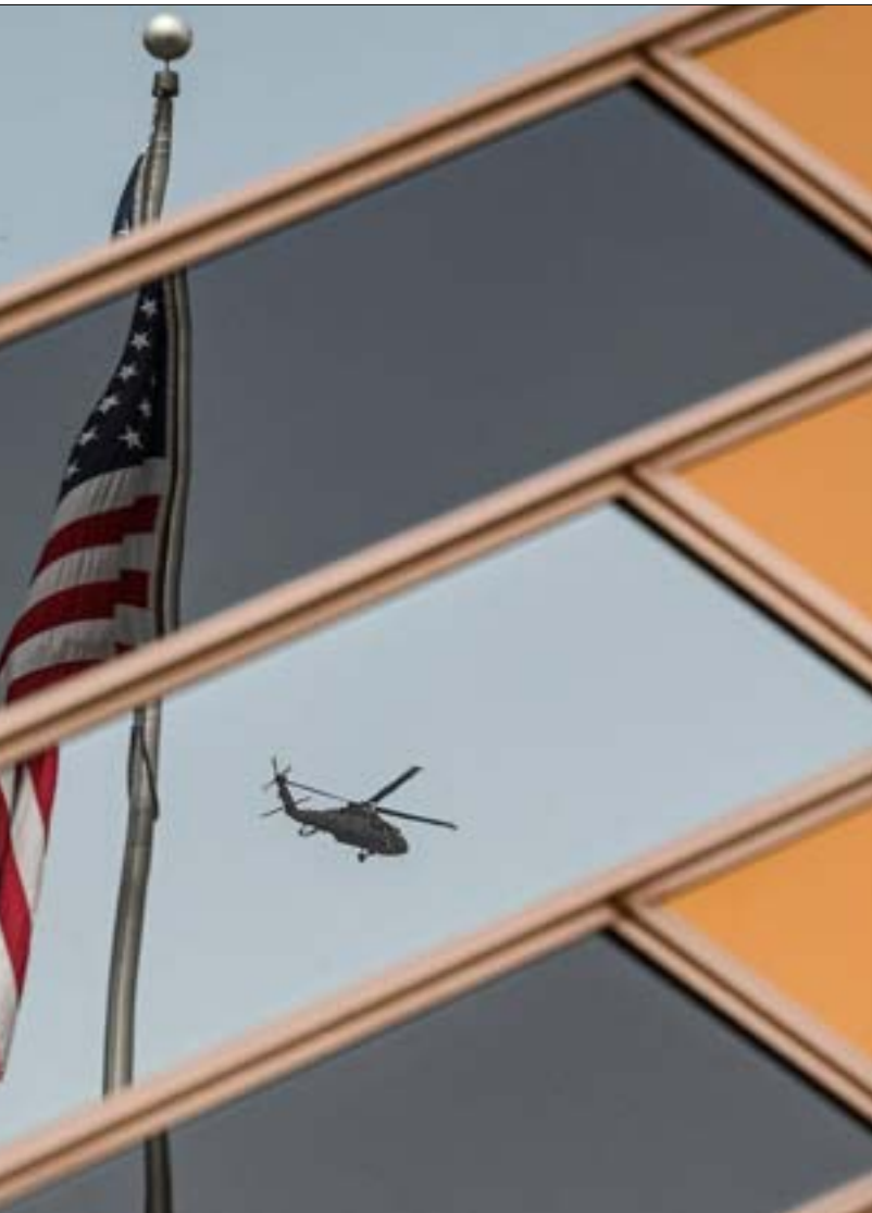
طاق التشكيل حكم بايند كماند اعلى القوات المسلحة (اف ب)

ثالثاً، على الصعيد الدولي، سيثير خروج الولايات المتحدة الفوضوي من أفغانستان الشكوك بشأن صمود واشنطن كحليف. ويعد إعلان أن «أميركا عادت»، في أوّل رحلة خارجية له إلى أوروبا في وقت سابق من هذا الصيف، بات من الواضح أن دعوات الرئيس الأميركي لإنشاء حلف من «الدول الديموقراطية»، في وجه «الدول المستبدَّة»، ستقوِّض بسبب قراره التحلّي عن «حكومة ديموقراطية» هشة في أفغانستان. أكثر من ذلك،