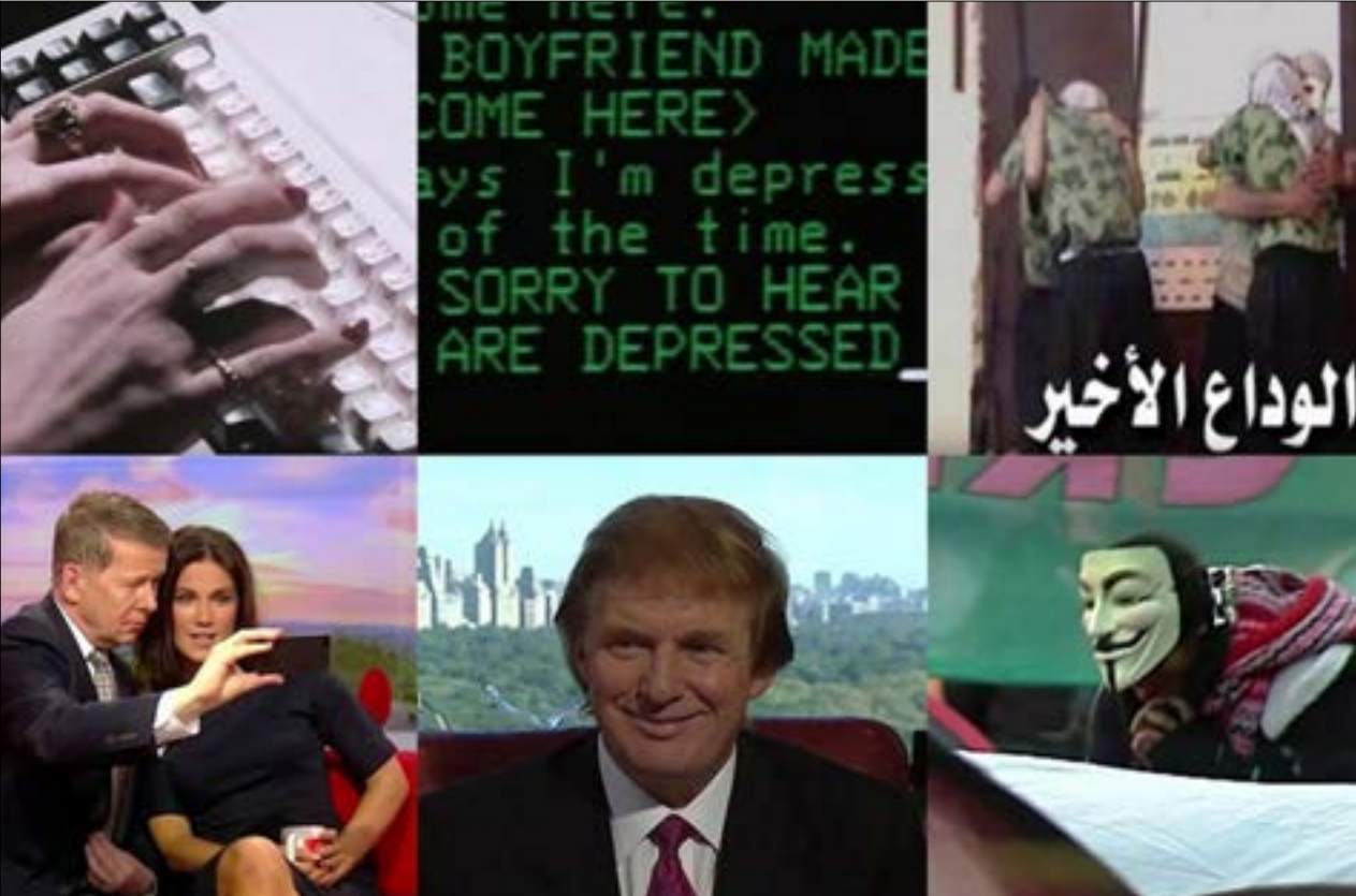
ربط استراتيجيات السياسة الخارجية لهنري كيسنجر على شبكة الأنترنت وتكتيكات الكذب السياسي

والتحالف الغربي ضد القاعدة. وبعد ذلك جاء «الربيع العربي»، فساعدت الولايات المتحدة متمزّدي البلاد في القبض على الزعيم. وراء هذه القصة كلها علاقات متضاربة من الإنقاذ والخيانة نشأت بين سوريا والولايات المتحدة في سياق الحرب بين لبنان وإسرائيل عام 1982، وبخاصة مع رفض هنري كيسنجر معالجة أزمة اللاجئين الفلسطينيين المتزايدة في سوريا ولبنان والأردن، وغضب الرئيس السوري حافظ الأسد. من وجهة نظر كورتس، خشي كيسنجر وجود عالم عربي موحد، معتبراً أن ذلك سيقلّص على ميزان القوى الذي يميل للغرب، وقد سعى إلى حمايته أكثر من أي شيء آخر، خاصة عندما رأى الأسد الوحدة العربية على أنها الطريق الوحيد للسلام، وغضب عندما شجع كيسنجر الدولة المصرية على