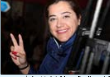
انضمت إلى المحطة قبل 11 عاماً

التي يتهمها بالحصول على الدعم المالي من الخارج.