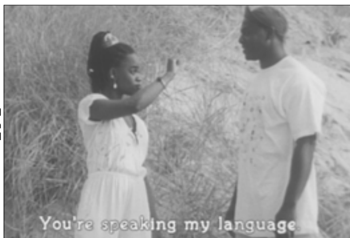
لقطة من الشريط

عرض فيلم Compensation: غد الأربعا، الساعة الثالثة بعد منتصف الليل بتوقيت بيروت - منصة «زوم» (الرابط متوافر على موقعنا)