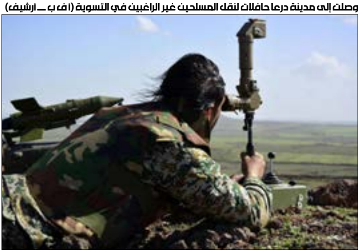
وصلت إلى مدينة درعا محافلات لنقل المسلّحين غير الراغبين في التسوية

دفعت قوات الرئيس المنتهية ولايته، عبد ربه منصور هادي، ومعها ميليشيات حزب «الإصلاح» خلال الأيام الماضية، بتقلعها العسكري نحو آخر خطوط الدفاع عن مدينة مأرب، الممتد من محيط تبة المصارية وتبّة السحلة إلى أرض الهبوط والميل، في محاولة لصنّد هجمات الجيش واللجان الشعبية، أول من أمس، انفجاران عنيفان يُعتقد أنها ناجمان عن صاروخين متوسّطي المدى استهدفا قاعدة صنح الجن العسكرية التي تحتضن مقرّ وزارة دفاع هادي. في هذا الوقت، وبينما لا يزال تجديد حركة «أنصار الله» عرض ميادرتها الخاصة بمأرب، يتفاعل في الأوساط القبلية والسياسية والإعلامية، رأى نائب وزير الخارجية في صنعاء، حسين العزدي، أن «نائب هادي، علي محسن الأحمر، وقيادات الإصلاح والقاعدة، يعيشون أوضاعاً مرهقاً، ولم يُعدّ شنّ طيران التحالف السعودي - الإماراتي