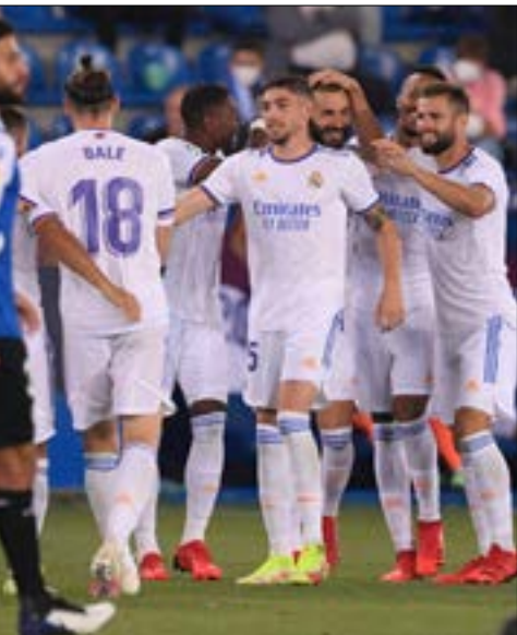
بني راك مدريد هم برشلونة يوفنتوس خارج المنظومة

وبالحديث عن الملاعب لا بدّ من التوقف عند وجود ميسي في تركيبة باريس سان جيرمان، فهو الحلقة الذهبية المفقودة في تلك التشكيلة التي قيل يوماً أنها لا تُقهر بوجود نيمار ومبابي والأرجنتينيين أنجيل دي ماريا وسوارو إسكاري وغيرهم من الأسماء الأملعة. لكن رغم كل هذه الأسماء افتقد الفريق الباريسي إلى لاعب محوريّ حاسم يمكنه زيادة لمعان زملته والفريق بشكل عام. القائد السابق لبرشلونة الإسباني هو فعلاً الحلّ للكثير من المشاكل الفنية التي عانى منها ال PSG، أولها أنه سيكون المفتاح القادر على جعله إلى دفاع متكثّل من خلال سرعتهم ومهاراته الاستثنائية. صحيح أنّ مبابي امتلك الأولى ونيمار امتك الثانية، لكنهما برعا أكثر في رسم الهجمات المرتدة