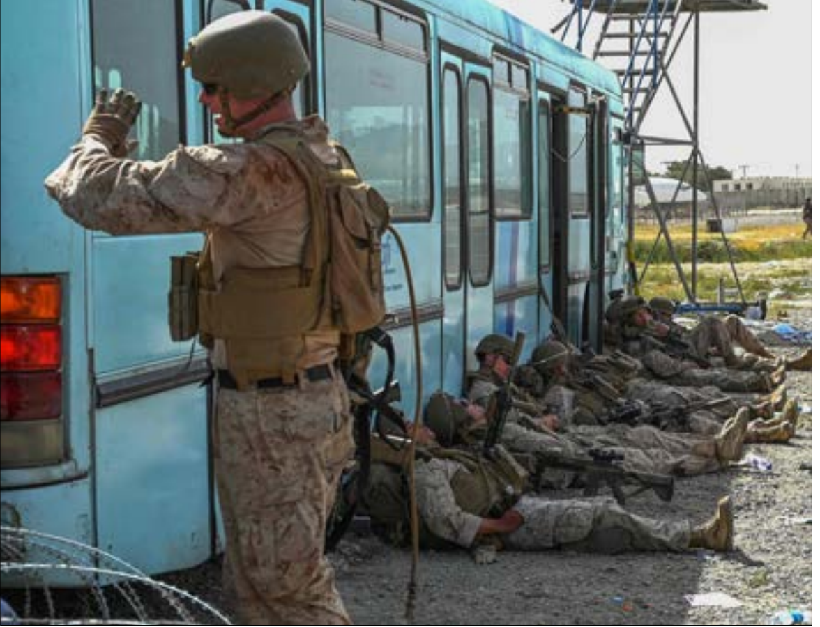
من الممكن تصوّر تعاون إقليمي بين دول الجوار و«طالبان» لنزع فتائل التوتر

فرضية امتلاك واشنطن خطة بديلة. ستضعها موضع التنفيذ عن بعد. إلى التخلي عنهم من دون أي تشاور لكن هذه الفرضية تتجاهل التحولات الجيوسياسية الكبرى في محيط أفغانستان. وتنعامي عن مفاعيلها الكارثية على مستقبل «الوجود» الأميركي في منطقتنا من جهة. وعلى عزم وتصميم اعدائها وخصوصها لهذه المنطقة وفي نواح أخرى من المعورة. على مواجهتها والتصدي لخططاتها من جهة أخرى.