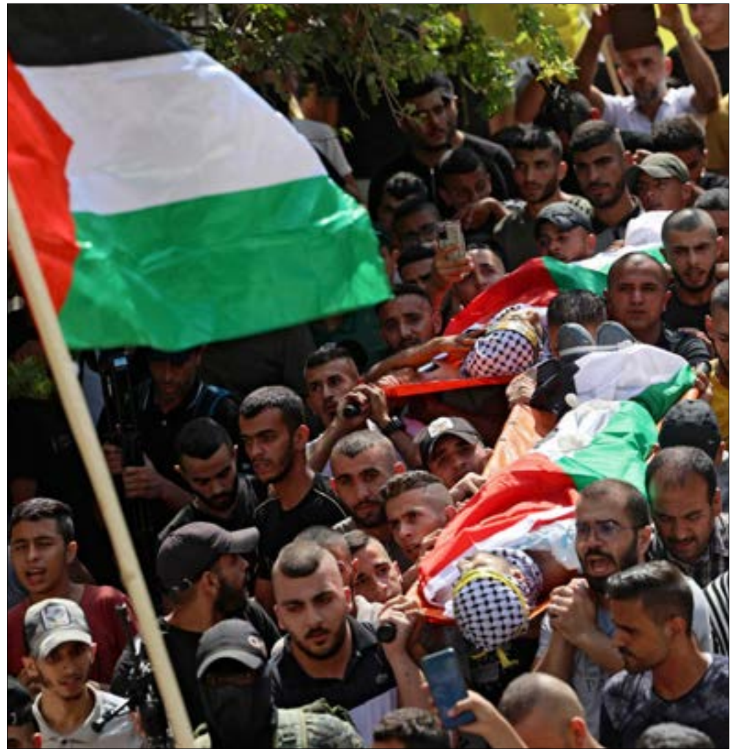
عشرة شهداء ارتقوا في جنين منذ بداية العام الجاري