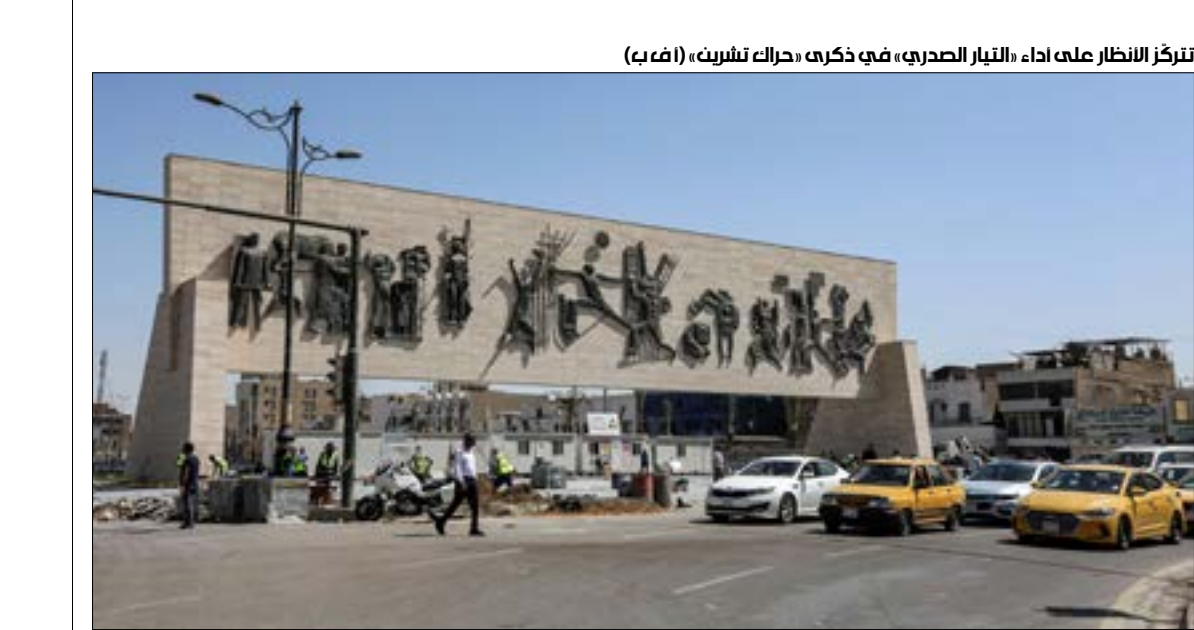
تتركّز الأنظار على أداء «التيار الصدري»، في ذكرى «حراك تشرين»

مرغوب»، مضافةً أنّ «جميع مكوّات الإطار ترى أنّ تحالف إدارة الدولة هو حاجة مرحلة مناسبة لتجاوز الانسداد الحاصل بإفضل طريقة ممكنة». وإن تُقَر بوجود «ماخذ تُسجّلها بعض الأطراف المنضوية داخل «التسيقي» على التحالف الجديد»، فهي تستدرك بأنّ هذه الأطراف «لا تُبدّي أيّ رغبة في عرقلة ما تمّ التوصل إليه مع أوسع شريحة من الطيف السياسي العراقي، خصوصاً أنّ هنالك رؤى وأفكاراً كثيرة منادٍ بتجاوز «الصدر»، الذي لا يزال يرفض التعليق على هذا المخطّط، علماً أنّه كان قد رفض، قبل استقالة نوابه 74، تقاسم الحكومة مع «التسيقي». وإلى أبعد من ذلك، تذهب مصادر أخرى، من داخل «الإطار» أيضاً، متحدّثة إلى «الأخبار» عن أنّ مشروع «تحالف إدارة الدولة» إنّما يمثل «استجابة محلية لإرادة دولية في تمرير الاستحقاقات الأساسية في البلاد، من أجل ضمان