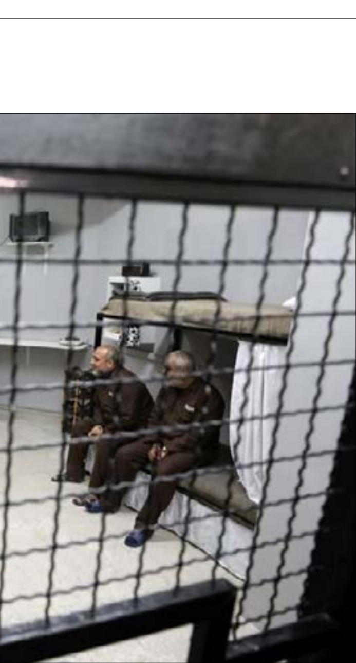
أصدرت قوات الاحتلال منذ عام 1967، ما يزيد عن 50,000 امر اعتقال إداري

وقال الأسرى، قبل خوضهم الإضراب، في رسالة توجّهة بإسمائهم، إنّ «خوض هذه المعركة ضدّ سياسة الاعتقال الإداري، والتي نامل أن تتدرج بانضمام كلّ المعتقلين الإداريين إليها، هي حلقة هامّة في سلسلة النضال لإنهاء هذه الجريمة البشعة»، مضيفين أنّ «ما يميّزها أنها تُخلّ على أكتاف مجموعة مناضلين ارتضوا خوضها لإعلاء الصوت ضدّ ظلم الاحتلال، على طريق إنهاء هذه السياسة التعسّفية». وعذّوا هذه المعركة «تجديداً لأخلاقنا الثورية الفلسطينية، التي لم تتمكّن قوى البطش من تحييدها أو انتزاعها،