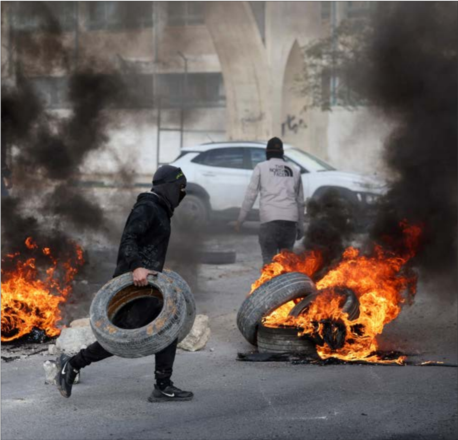
تلخ مجزرة أريحا من تاحيات على الواقم الميداني في الضفة وقطاع غزة على السواء.