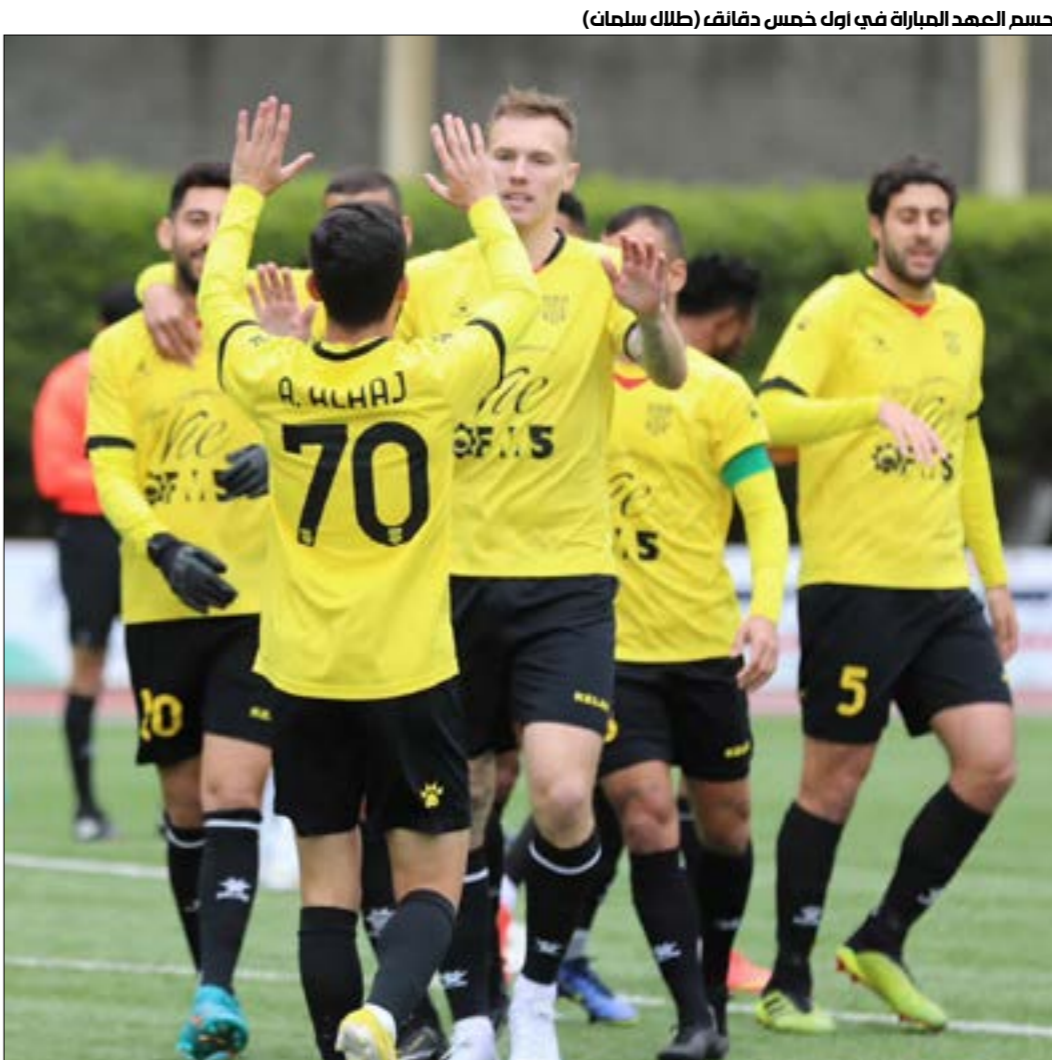
حسم العهد المباراة قبل أول خمس دقائق