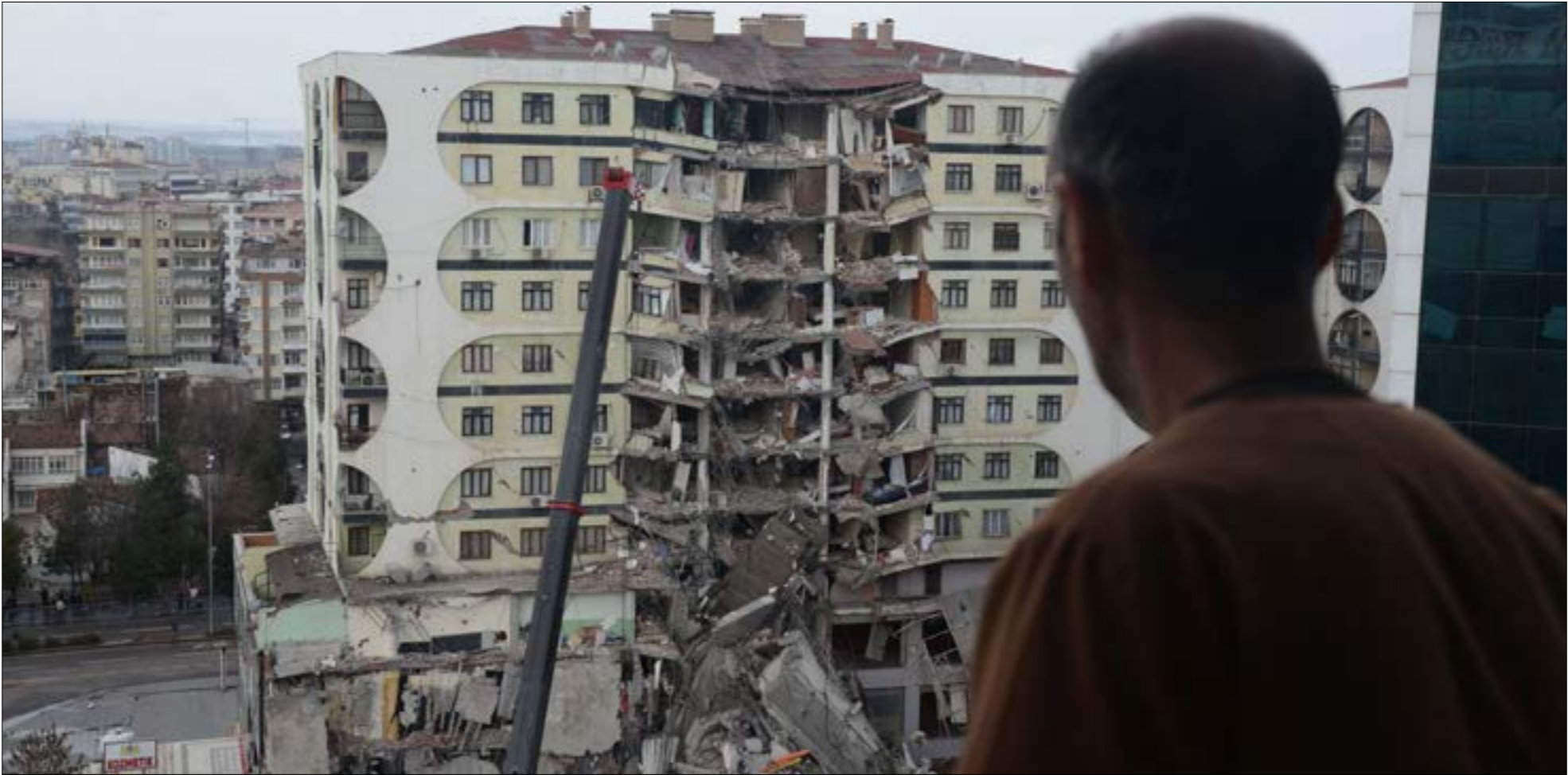
لن يظهر الضحية قبل مرور عدة أيام ورنما أسابيع

الزلازل، ضياء الدين تاشكار، فقال إن الهزّات الارتدادية التي شهدتها قهرمان ماراش خفيفة، وحيث لم يُعرف ملتها بعد الزلزال الكبير الذي وقع في إسطنبول، عام 1999. إلا أن الزلزال كان الثاني الأكبر في تركيا خلال مئة عام، بعد الأوّل الذي حدث في أرزنجان، في عام 1939. وبحسب هذا الخبر، فإن خطّ الصدع للزلزال الجديد أسفر عن تكسير طبقة كانت تتشكّل بعد آخر زلزال حصل عام 1504، مضافاً أنه «علمياً، كان مثل هذا الزلزال متوقّعا»، أمّا الباحث في