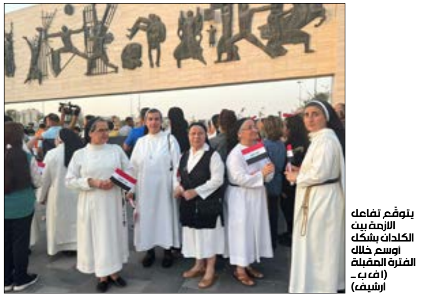
يتوقّع تفاهل الأزمة بين الكلدان شكّل اوسع ذلك الفئة المصنفة (أرمن - أرشيف)

ما زال قرار الرئيس العراقي، عبد الطيف رشيد، سحب المرسوم الجمهوري الخاص بتعيين ساكو في منصب بطريرك الكلدان في العراق والعالم، يثير استياء لدى أطراف دينية وسياسية من داخل البلاد وخارجها. وكان ساكو قد غادر بغداد وتوجّه إلى أحد الاديرة في إقليم كردستان، ردّاً على سحب المرسوم الجمهوري، وصدور أمر باستدائه للمقول أمام القضاء، وتظاهر مسيحيون في مناطق منفردة من البلاد ضدّ خطوة رشيد التي عذّوها بمعاينة «عدم احترام لهم»، فيما أعلن المرجع الديني الشيعي، آية الله علي السيستاني، تضامنه مع ساكو. وعلى مستوى الخارج، انتقدت الولايات المتحدة، في تصريح للمتحدث باسم وزارة الخارجية، ماثيو ميلر، قرار سحب المرسوم ومخاطرة ساكو بغداد، وهو ما ردت عليه رئاسة الجمهورية العراقية ببيان شديد اللهجة، مؤكّدة أنها مستعدة سفيرة واشنطن لدى بغداد، لينا رومانوسكي، بشأن هذه المسألة.