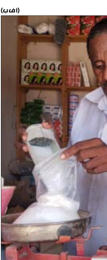
(أ ف ب)

بالتوازي، وبعدما شهدت مدينة القدس المحتلة مسيرة للمستوطنين، التي دعت إليها «جماعات الهيكل» المرعوم وعدد من منظمات اليمين الاسطيانية، وشارك فيها وزراء واعضاء «كنيست»، تحشد الجماعات نفسها لاقتحام واسع للمسجد صباح اليوم في ذكرى «خراب الهيكل»، وذلك في إطار تكثيف المستوطنين استفزازاتهم للمقدسين، ومحاولتهم ترسيخ هذه المسيرات كعامل تحفيز على اقتحام الأحياء العربية وأرقة البلدة القديمة، وتثبيت تدفق بشري يهودي دائم في المدينة، بما يولد ضغطا كبيرا على أهلها. ومن المتوقع أن يشهد الحرم القدسي يوما شديدا وعصيبا نظرا إلى عدد المستوطنين الكبير الذين ينوون اقتحام المسجد، وسط انتشار أسنّي كبير سترافقه حتما انتهاكات واعتداءات على المرابطين ومرافق المسجد.