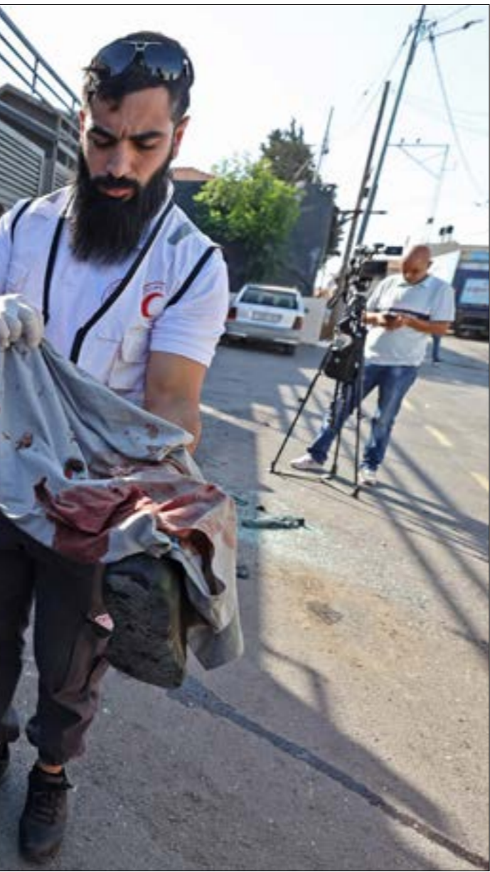
نركز التصعيد الإسرائيلي، خلال الأسبوع المنصرم، في مدينة نابلس، التي شهدت ارتقاء 6 شبان

تتصنّر اتهامات المؤسسة الأمنية الإسرائيلية، على إثر الغشل الذي منى به جيش الاحتلال في عدوانه الأخير على المخيم. وفيما لا قدرة لدى العدو على انتظار ما يمكن أن تقوم به السلطة من إجراءات على الأرض للسيطرة على حالة المقاومة هناك، عاد إلى الواجهة التلويح بشنّ عملية جديدة ضدّ المخيم، باعتبارها أمرا لا مفر منه. وفي السياق، سزّبت مصادر في المؤسسة الأمنية الإسرائيلية، أسس إلى الإعلام، أن العملية التي تبدو تحصيل حاصل لن تكون على نطاق واسع كما جرى في العملية الأخيرة قبل أكثر من 20 يوماً، بل ستكون لعدة ساعات قليلة بهدف إحباط البنية التحتية للخلايا المسلحة. والظاهر أن ما يحفز ذلك إقرار المؤسسة الأمنية الإسرائيلية بانّ خلايا المقاومة في المخيم بدأت بترميم قدراتها، وإنتاج عموات ناسفة قوية وزرعها، إلى جانب جمع ذخائر جديدة. كما أنه على رغم محاولات السلطة السيطرة على الوضع في جنين ومخيمها، إلا أنه لا يمكن لجيش الاحتلال أن يعتمد عليها كليا في القضايا الأمنية، بحسب صحيفة «يديعوت احرونوت»، التي نقلت عن مسؤولين أمنيين قولهم إن هناك «محاولة لعدم إلحاق ضرر بمحاولات السلطة الفلسطينية بسط سيطرتها هناك، وهذا أمر يمثل مصلحة إسرائيلية» وبالتالي «لا يمكن إبطاء الإرباب بعملية واحدة، يجب دخول مخيم جنين للقيام بعمليات من حين إلى آخر، وإحباط محاولات تأسيس بني جديدة». كذلك، نقلت عنهم أن أيّ عملية جديدة ستكون «بعملية