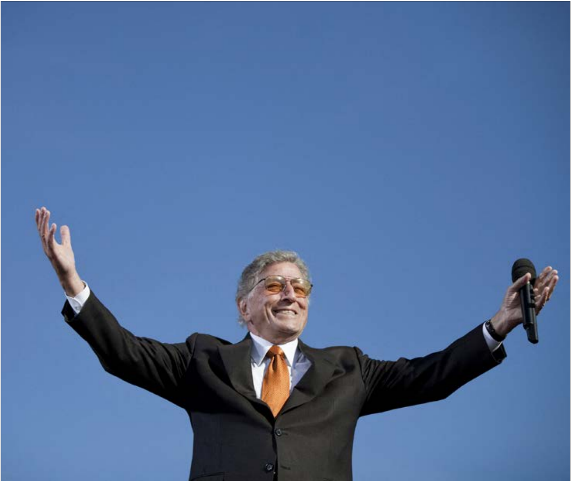
جلس، في المقعد الملحق في جمن، كما وصف مشاركته إلى جانب الجيش الأميركي في الحرب العالمية الثانية، وعانى الفقر والحزن في طفولته

«أجبر» جمهور ليدي غاغا على سماع روائع الريبرتوار بتوزيع مذهل («بيغ باند» جاز ووتريات) وجمهور الجاز على «هضم» ليدي غاغا. واضح أن أداءه في هذا الألبوم ينمّ عن عقل موسيقي كبير وخبرة في التعامل مع نمط جدي، وهما صفتان لا تملكهما المغنية الشهيرة، لكن الأخيرة تصرّفت بذكاء وطواعية وقدمت نتيجة جيدة جداً نسبة لما يمكن توقّعه منها هنا. الأهم أن الكثير من الغنّاتين الذين يخفت نجمهم