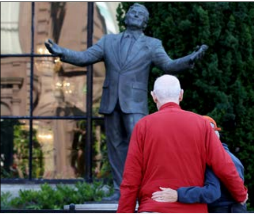
نعلما ليينيت في

«أجبر» جمهور ليدي غاغا على سماع روائع الريبرتوار بتوزيع مذهل («بيغ باند» جاز ووتريات) وجمهور الجاز على «هضم» ليدي غاغا. واضح أن أداءه في هذا الألبوم ينمّ عن عقل موسيقي كبير وخبرة في التعامل مع نمط جدي، وهما صفتان لا تملكهما المغنية الشهيرة، لكن الأخيرة تصرّفت بذكاء وطواعية وقدمت نتيجة جيدة جداً نسبة لما يمكن توقّعه منها هنا. الأهم أن الكثير من الغنّاتين الذين يخفت نجمهم