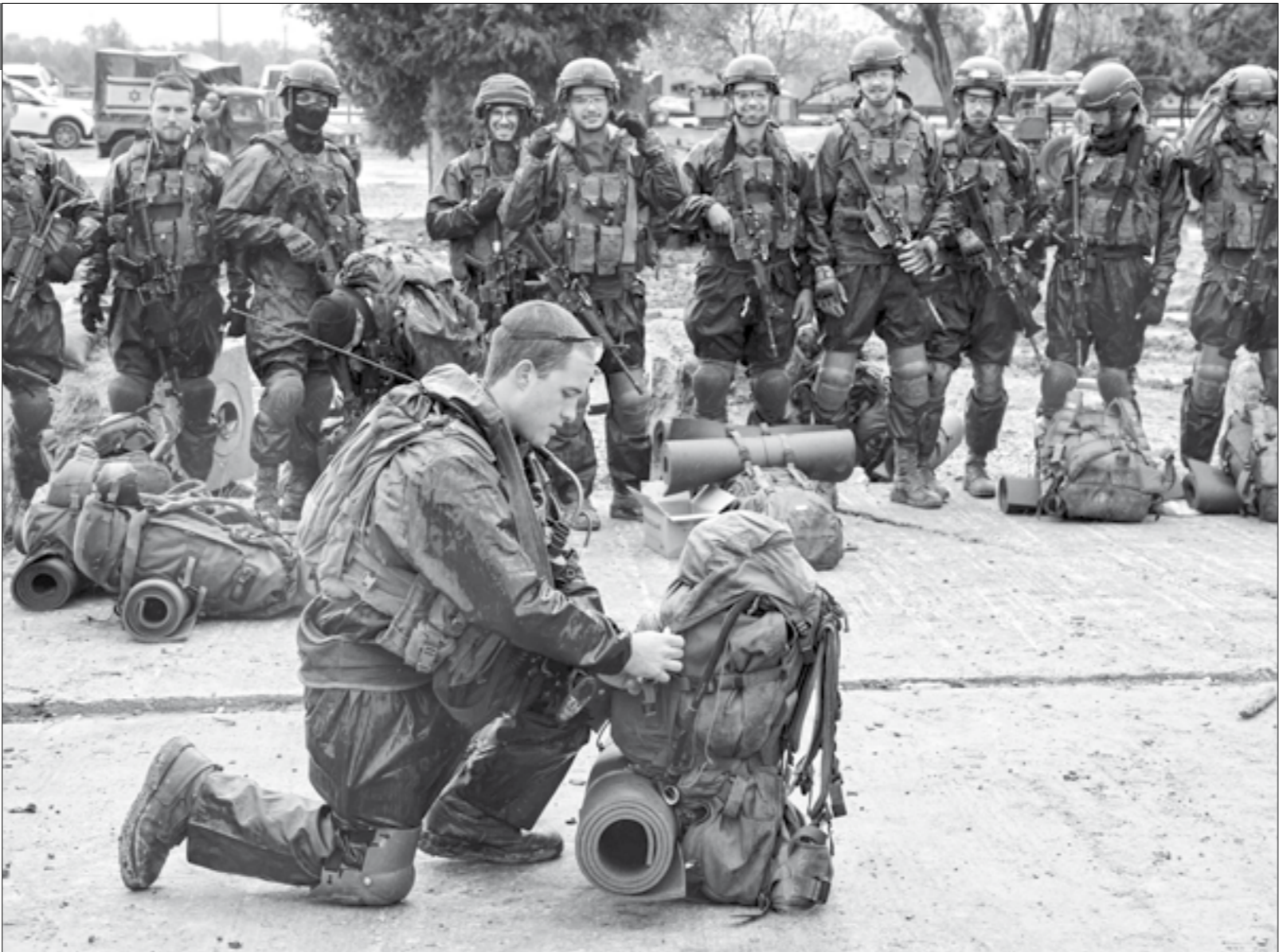
إسرائيل ترفض ملك هذا الانتقال، حالياً، وإن كانت هذه هي وجهتها لاحقاً

وإذا كانت الأهداف المشتركة بين الجانبين، واحدة، فإن ثمة خلافاً في الرؤية أيضاً حول المخرج السياسي للحرب بسواء بوتيرتها العالية أو المنخفضة، أي بعد أسابيع طويلة، وربما أشهر غير أنّ المزيد من الضغط الأميركي، معطوفاً على الخسائر المديانة - كما حدث في الشجاعة، حيث سقط العشرات من جنود النخبة بين قتل وجرح في عملية تصدّ واحدة - قد يدفعان إسرائيل إلى التراجع عن موقفها، وإذ يتقرب الجنود الإسرائيليون مزيداً من تلك الخسائر، وهو ما