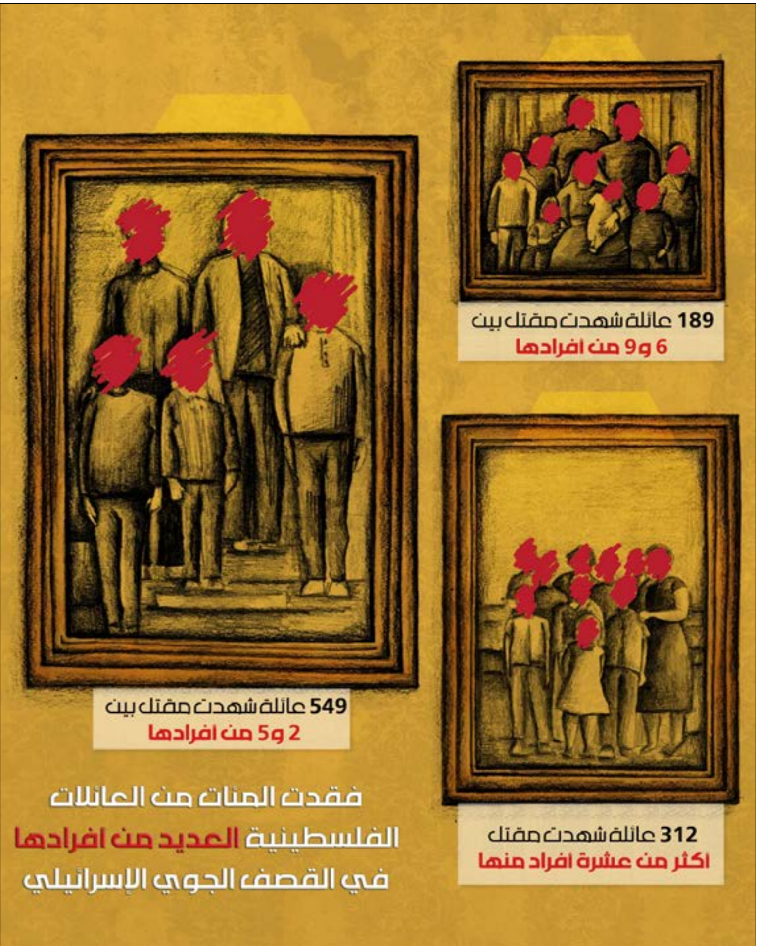
(مع موقع المنظمة)

منذ تأسيسها عام 2012، تستخدم الموسوعة التفاعلية للقضية الفلسطينية البيانات والأبحاث لإيصال التجارب الفلسطينية بصرياً وإحداث تغيير في السردية. يتشارك القائمون على المنظمة إيماناً بأنّ «البيانات والتواصل الإبداعي لهما دور في حركة حقوق الإنسان الفلسطيني، وخصوصاً في تسليط الضوء على الأسباب الجذرية للظلم». يكرسون جهودهم لخلق سردية تعكس على تغيير ديناميكيات السلطة لنشر الرواية الفلسطينية كجزء من الروايات الأوسع المناهضة للاستعمار والعنصرية. في ظلّ الإبادة والمحرقّة المستمرة في غزة منذ السابع من أكتوبر، تصبّ المنظمة تركيزها على إظهار هوية الشهداء وسرد قصصهم الإنسانية كعنصر أساسي في الحرب