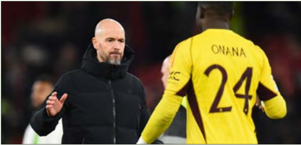
مقد المدربة تة هاف السيطرة على غرمة الملايس (أ ف ب)

يونايتد ضمن بورصة كيار الأندية الخيبة الأخيرة تمثلت بالخروج المبكر من دوري أبطال أوروبا، في ضربة موجعة للشبابين الحمر» والكرة الإنجليزية عموماً.