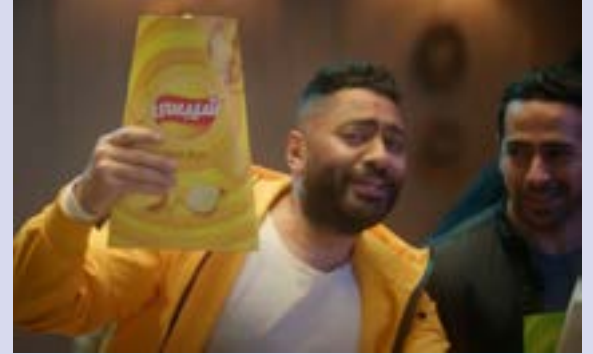
الفنان المصري في مشهد من الإعلان الجديد

تزامن ذلك مع خروج تصريحات تؤكد أنّ تامر حسني قرّر تجميد كل نشاطه الفني بما في ذلك الحفلات والأفراح الخاصة، تضامناً مع أهل غزة الذين يتعرّضون لحرب إبادة منذ ستة أشهر، لا بل تسرّبت أخبار عن «إصابته باكتئاب حاد» بسبب الوضع برّمته.