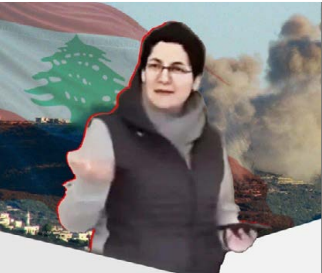
مؤيدين مؤلف الأخت مايا زيادة.

عند قول نصر إنّ مسؤوليات زيادة محدودة. باختصار، بات الموقف إلى جانب اللبنانيين يتعرّضون للعدوان على يد احتلال إجماعي «لغة سياسية» لا تخض «الانتماء إلى الوطن»، وبات تأييد اللبناني الذي يدافع عن أرضه «بثجير الانقسامات» ويستدعي «جزاء» العجيب أن كل هذا لم يصدر عن «تلفزيون المرّ» مثلاً، بل عن قناة تجهد على قدم وساق لإظهار تغريدات ناشطين معروف في التوجّه ورفضها ما يتعرّض له أهل الجنوب وأهل غزّة على حد سواء. ولم ينقل التقرير «الرأي الآخر» سوى في الثواني العشرين الأخيرة منه ونقلاً عن الغائب، فقالت معدّته إنه «رغم هذه