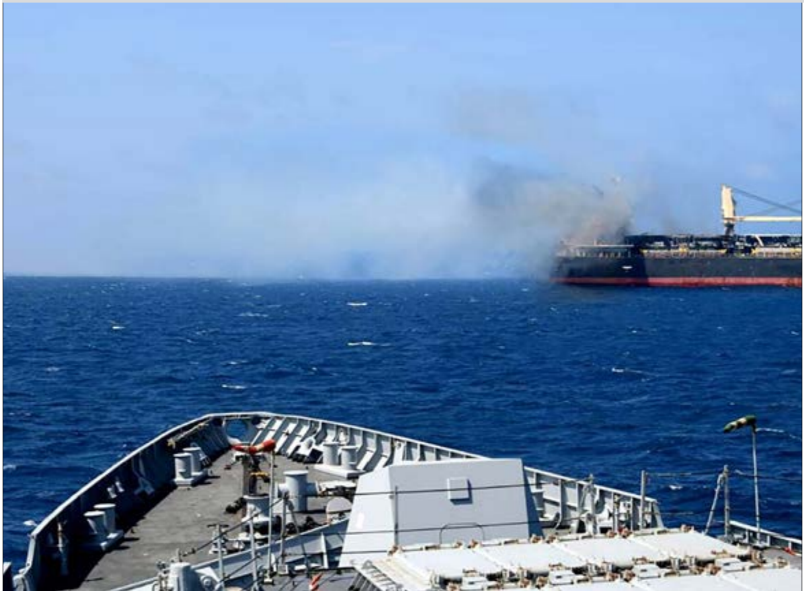
قوات صنماء، لتوعد بتصعيد عملياتها خلال شهر رمضان (ف ب)

الواحد تصل قيمته إلى 6 ملايين دولار. كما أن واشنطن تواجه تحدّي تقدم خصومها في إنتاج الصواريخ والطائرات من دون طيار، والتي كانت حتى وقت قريب متاحة فقط للدول الأكثر ثراءً، وهي بالتالي، تكلفه الإنتاجية لعملياتها العسكرية من حيث التناج، مقابل الأسلحة المتوافرة لدى الخصم. والجدير ذكره، هنا، أن المجتمعات