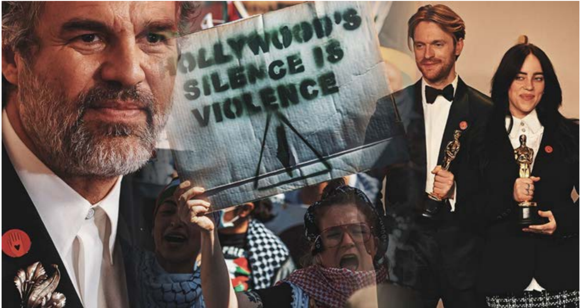
مارك روفالو وأعضا الجوس الاحمر، وتظاهرات خارج مقرّ مسرح دولبي، والمغنية بيلي إيليش وشفيقها فينياس أوكونيل بضمات الدبوس الاحمر

جائزة أفضل ممثل لكليمان مورفي في دور جيه روبرت أوبرهايمر، وروبرت داووني جونور أوسكار لأفضل ممثل مساعد عن دور السياسي لويس ستراوس، وحرم الممثل بول جياماني من جائزة أفضل ممثل،