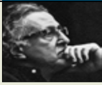
أسعد أبو خليل

كسبب إضافي، لأنه لم يتخصّص في الكتابة عن عبد الناصر إلا أعداؤه (هناك كتاب جديد لألكس رويل عنه والكتاب نقل للعداء الخليجي ضد عبد الناصر، ويشخّ من المعلومات والمعرفة). يسألني تلاميذي دوماً عن سير أكاديميّة بالإنكليزية عن عبد الناصر وأجديني لا أزال أحيلهم إلى كتاب روبرت ستيفنز من عام 1972. تجاهل عبد الناصر مقصود: كرهه كان سياسة خارجية رسميّة لكلّ دول الغرب، ما يسند سردية وطنيّة الرجل الذي لا تزال صورته تعلق جدراناً في دول غير عربيّة حول العالم. هناك عدد غير قليل من الدراسات الأكاديميّة عن البعث، وهناك سير لا عد لها عن صدام حسين، لكنّ تجاهل عبد الناصر مقصود لأنه كان فعّالاً في معاداته للغرب، ولأنّ شعبيّته لا تزال حصرمة في عيون المستشرقين والصهاينة في الغرب. أجد أنّ جيلاً جديداً من الأكاديميين يعبر عن اهتمام مستجدّ به، وقد يؤدّي هذا إلى إنتاج مرحّب به. عسى أن تصدر الثلاثيّة بالإنكليزية كي يستفيد منها الدارسون. سأعود إلى المجموعة حالما تصلني.